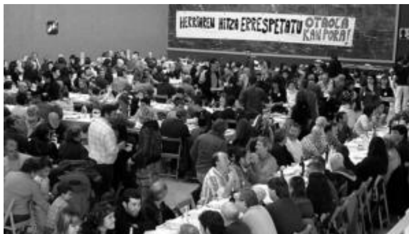
Irudian, pilotalekuan, zikiro-jatearen garaian zegoen giroa. HITZA

■ Etxebizitza. Voith Gorostidi eremuko lehenengo fasean etxebizitza salgai. Bi logela, 2 komuna, terraza zabala, sukualdea, egongela, garajea eta trastelekua. 300.000 euro (BEZ barne). Negoziatzeko prest. Interesatuak deitu: 657 70 05 68.