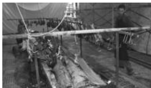
Goian, txistulari goiztiarrak; behean, zikiroak erretzen. N.URBIZU