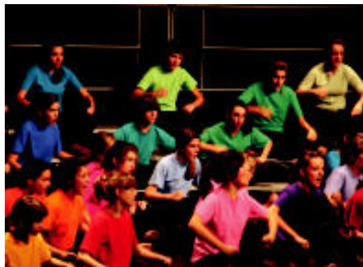
Leioa Kantika Korala abesbatzak euskal giroko kantuak taularatu zituen. E. E