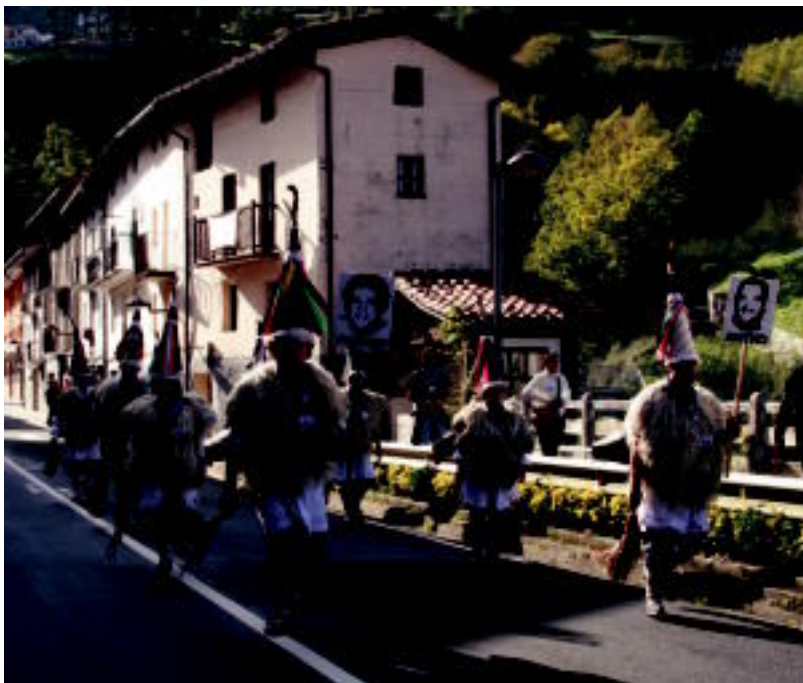
Zanpantzarrak ere ibili ziren herriko kaleetan zehar Elkartasun Egunaren harira. E. EZBIZA