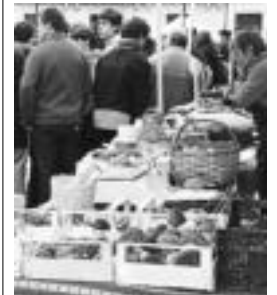
Ostiraleko onddo postu bat. N.U.

Perretxiko zerrrenda joan den astekoa izan zen. Berrikuntzarik ez, eta ikusitako produktu gehienak, kanpokoa.