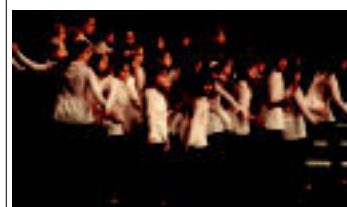
Hernalde Katalanetatik etorri ziren Amics de la Unio abesbatzakoak. www.40abesbatza.com