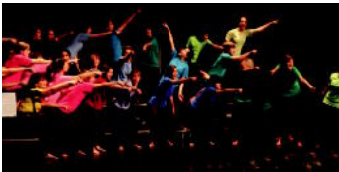
Leioa Kantika Korala abesbatzak eskualde giroko kantuak taularatu zituen atzo goizean, kolorea jarritz Tolosako 40. Nazioarteko Abesbatza Lehiaketari. www.40abesbatza.com

Kultura » Gaur, sari banaketarekin eta amaiera kontzertuarekin esango diote agur hurrengo urtera artea, Nazioarteko Abesbatza Lehiaketari.