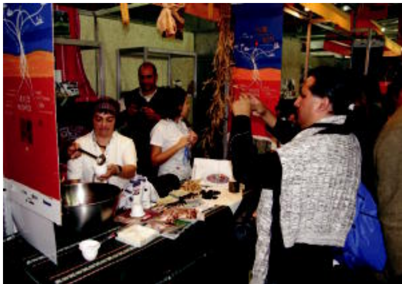
Turinen izan dira Babarrun elkartekoak bost egunez, babarrunak erakusten.