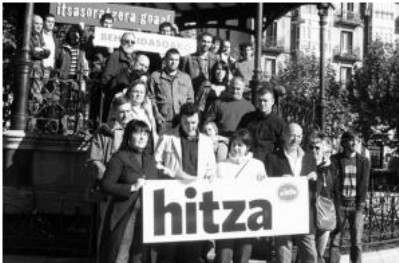
Atzo egin zuten laguntza kanpainaren aurkezpena. HITZA

Behe Bidasoan Antxeta Irratia, www.bidasoamedia.info eta euskarazko beste zenbait komunika-