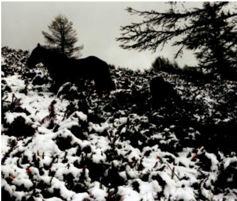
Elurrak Leitza inguruko bazterrek zuritu zituen atzo; postal ederrak benetan. ASIER IMAZ

Gaurkorako euria iragarri dute adituek, baina temperaturek zertxobait egingo dute gora, elurra 1.400 metroko altuera geratuko delarik. Eta biharko, errezeta berdina: euria eta hotza, temperaturek berriz ere behera egingo dutelarik.