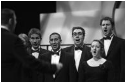
Londongo Chantage abesbatzako kideak emanaldi batean.