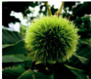
Che-ren biharko proiektioan ikusiko den irudi bat, lehen irudian. Drogei buruzko hitzaldia izango da azaroan, Herri Krosa bezala. Gaztain eta talo-jatea ere antolatu dute azaroaren 22rako.