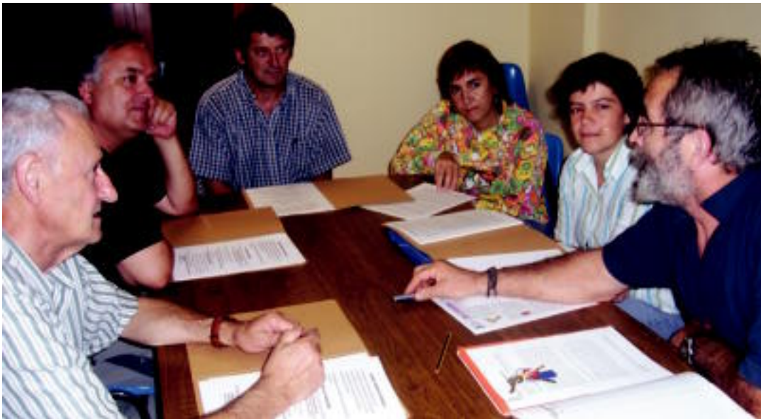
Hernandorena Kultur Taldeko kideak bere bileretako batean. AIURRI