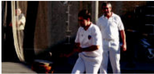
Behar-Zanako pilotaria, herenegun, sake bat egiten. IYUYA URRUTIA