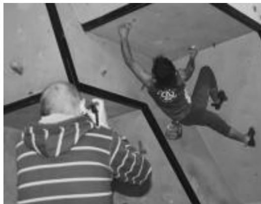
Aurten ere Boulder Txapelketa antolatu dute Oargi elkarteak kideak. N. URRUTIA

Egitarauren bizkar hezurra proiektzioak izango badira ere, III. Boulder Txapelketa bere garrantzia izango du. Azaroaren 22an jokatu da eta izena emateko aukera egunean bertan amaitu da, hau da, txapelketa hasi baino ordu bete lehenago, Oargin bertan.