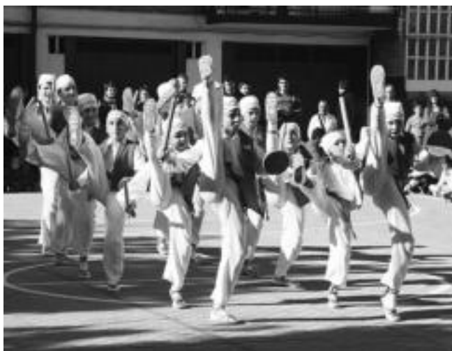
Zazpi herrietako dantzari txikiak izan ziren Alegian. Eguraldi onarekin Dantzari Txiki Eguna are dotoreagoa atera zen. PATXI RENOBALDES

Hamaiketako pilotalekuan egin behar zuten, baina eguraldi aparta aprobeztatu, kanpoan