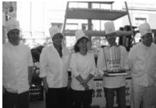
Bost gozotegi ezagunetako ordezkariak, tarta erraldoiaren aurrean. HITZA

Orain, bi asteko tartea edukiko dute parte-hartzaileek finaleko jarduna prestatzeko. Bestalde, batzuek kanporaketetan bi kantu aurkeztu dituzten arren (aukeran izan dute bat edo bi abesti) abesti bakarra abestu ahal izango dute finalean, aurkeztutako bi kantuen artean puntuazio altuena lortu duen abestia hain zuzen ere.