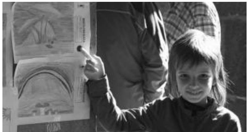
93 espezie ezberdin sailkatu zituzten. Haurrek berriz euren espezieak marraztu eta erakutsi zituzten. IVUYA URRUTIA