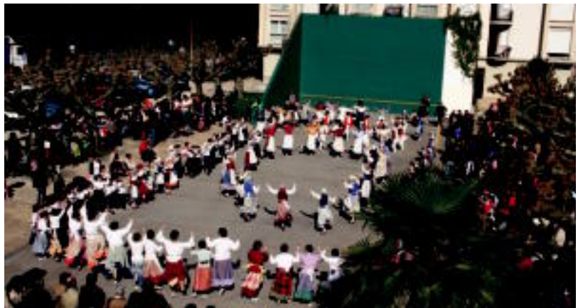
Herriko plaza nagusian obretan ari direnez, Larraitzen eta Kalebeheran aritu ziren dantzariak. P. RENOBALÉS

LEITZA Urte luzez antolatu gabe egon ondoren, aurtan egin dute berriro; «jende ugari izan da» 11