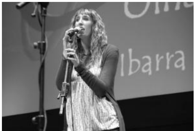
Ibarrako Oihane Sarasola ere Villabonako kanporaketan aritu zen. EUSKAL KANTUZALEEN ELKARTEA

to egiteko aukera eman dio eta horrek «esperientzia eta segurtasuna» eman dio, batez ere.