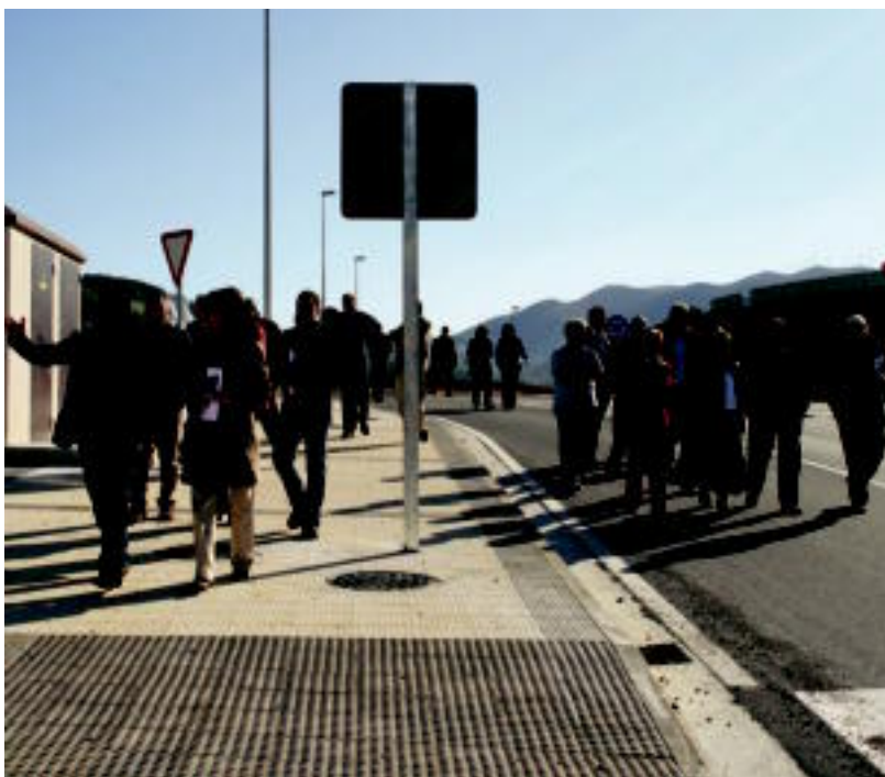
Udaleko eta Nafarroako Gobernuko eta lana egin duen enpresaren ordezkariak, atzo. A. IMAZ