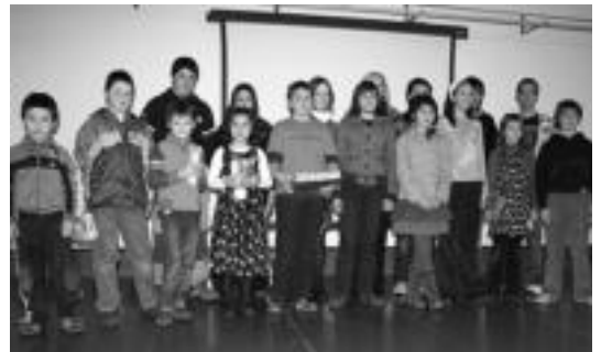
lazio lehiaketan saridunak izan ziren idazleak. A. IMAZ

Bi sari banatuko dira maila ba- koitzeko eta lan sarituak Udalaren esku geldituko dira. Sari banaketa abenduaren 19an egingo da. Epai- mahai aditu batek aukeratuko ditu idatzeko zaletasuna sustatzea da ordetzaria izango du.