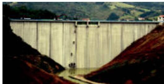
Urez betetzen hasiko dira laster. N.URBIZU

IBARRA Kontzientzia ezkertiarreko talde batek osatu du «sentimendu iraultzailea pizteko» 6