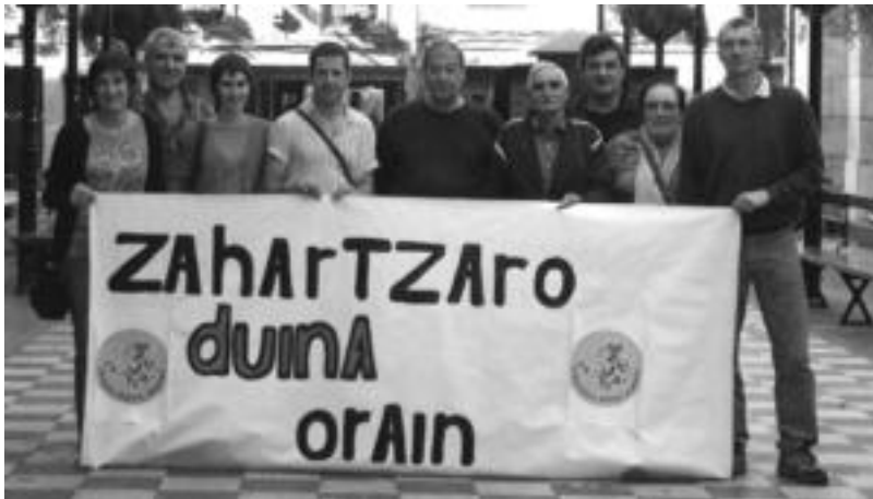
Zahartzaro Duinaren Aldeko plataformakoek, oztopen gainetik, parte-hartzen jarraituko dute. HITZA