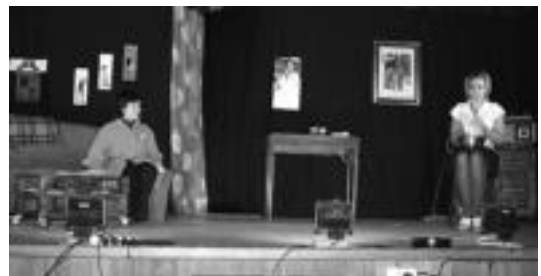
Atzo egin zuten antzeziaren une bat. A. IMAZ