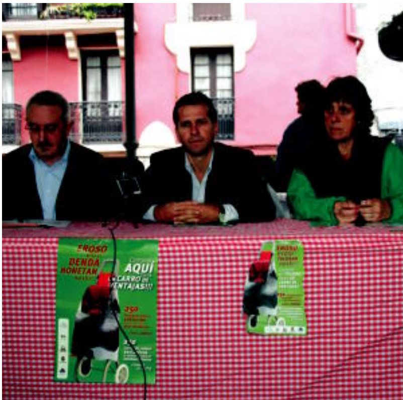
Atzo egin zuten ekimen berri honen aurkezpena sustatzaileek. ESTI EZEIZA