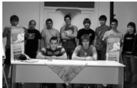
Villabonako hainbat gaztek bat egin dute Independentzia egunarekin. E. EZBIZA

Urriaren 25a aukeratu dute independentzia eguna ospatzeko, izan ere, egun honetarako deitu zuten EAJk herri galdeketa. Bestalde, Gernikako Estatutuaren urteurrena ere egun honetan betetzen da. «Egun Euskal Herriak bizi duen salbuespen egoera» salatuko dute Hernanin, baina aldi berean festarako unea ere izango da.