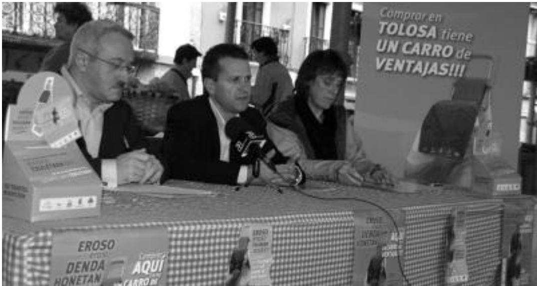
Atzo goizean aurkeztu zuten ekimena Zerkausion; bertan izan ziren merkataritza elkarteetako ordezkariak eta Udalekoak. ESTI EZBIZA