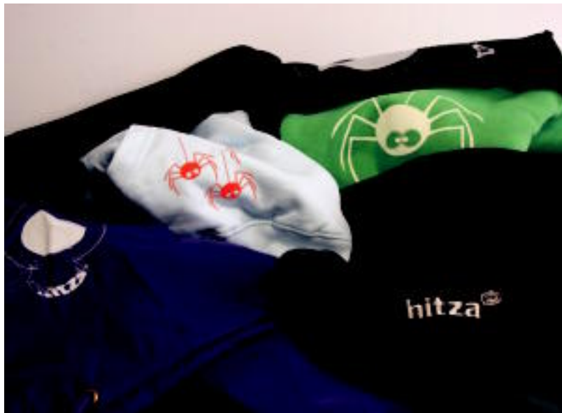
Elastikoak, jertseak, fularrak, zirak, jakak edota buffak aurki daitezke HITZAREN arropa berriaren artean. A. BELAUNZARAN

Mauka luzedun elastikoak, gazte zein helduentzako jertseak, haurrentzakoak... denboraldi berriaren ere denetarik aurki daitezke HITZAREN arropa eskaintzan.