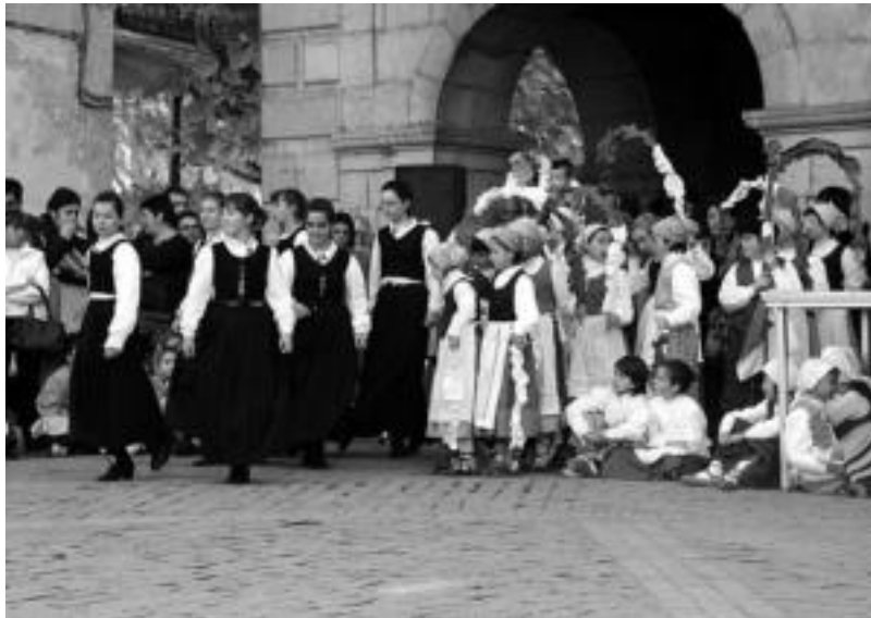
Iaz ere Dantzari Txiki Eguna antolatu zuten eta aurten bezala herri askotako dantzariak elkartzeko dira. NAIARA GARZIA

Alegian dantza egiteko plaza eta leku apropos ugari daude, herriko plaza falta izanagatik ere, hau ez da oztopoa izan. Dantza taldekoek onartzen dute, «plaza herrigunean egotearekin jendea ikustera joate-