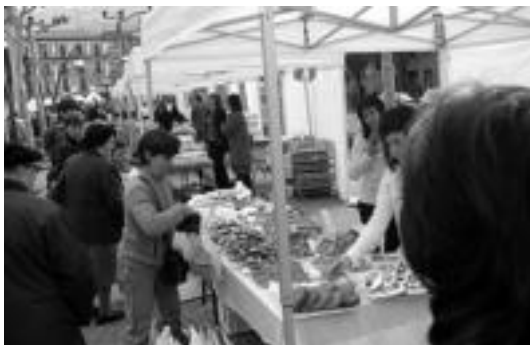
Pasa den urteko Tolosa Goxua azokaren une bat. P. ALBERDI