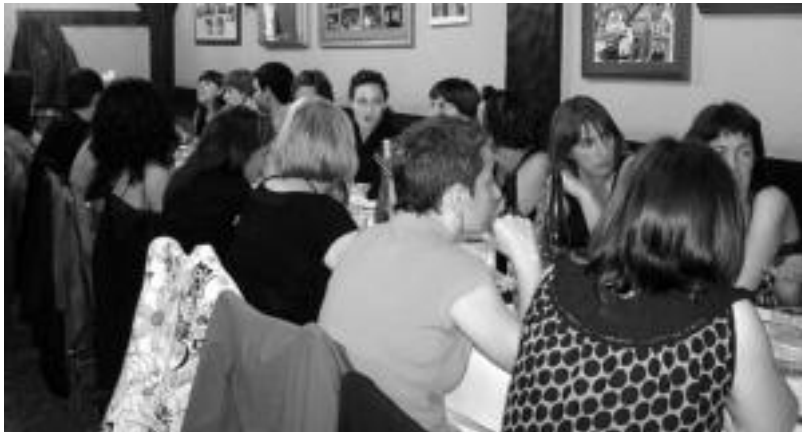
Mintzalaguna proiektuan zein euskara ikastaroetan parte hartu zutenek afaria egin zuten ikasturte amaieran. HITZA

Villabona-Zizurkil » Iazko arrakasta ikusita bultzatu dute berriro proiektua bi udaletako Euskara Zerbitzuetatik.