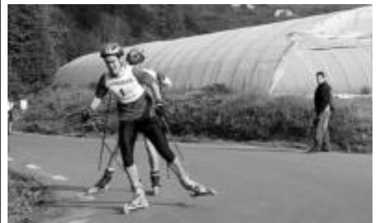
Iazko Rolleski Igoeraren zenbait parte-hartzaile ahaleginean. JOXEMI SAIZAR

Era berean, adierazi dute Mintzalaguna egitasmoan parte hartzeko laguntzaile euskaldunak behar dituztela, eta hilaren 29an, 19:30ean, bilera bat egingo dela interesatuen guztiak, Villabonako udaletxeko gela polibaleantean (liburutegiaren gainean). Informazio gehiago nahi izanez gero, hona jo daiteke: Villabonako Euskara Zerbitzua, 943 693 501 zenbakian edo euskara@villabona.net helbideran, edo Zizurkilgo Euskara Zerbitzua, 943 69 24 95 zenbakian edo kultura@zizurkil.com helbideran.