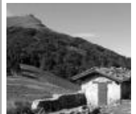
Larrun ezagutzeko aukera. HITZA

Bigarren solairuak 500 metro koadro ditu eta alboan, gainera, honez gain, ia 2.000 metro koadroko partzela du. Une honetan ez dira erabiltzen, baina eremu hori bezero nagusienekin aztertzen ari diren proiektu enpresarial berriak ezartzeko erabiliko dute.