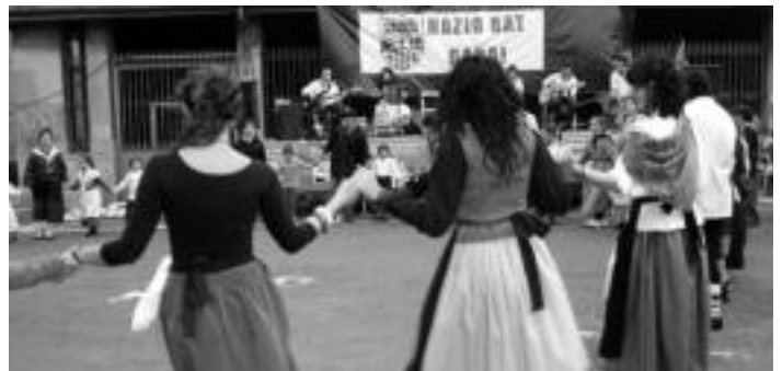
Ekitaldiz beteriko eguna izan zen eta guztiak ere arrakastatsuak: herri bazkaria, azoka, perratzaileak, harri-jasotze erakustaldia, talogileak eta dantza emanaldiak. HITZA

Tolosaldeko eta Leitzaldeko HITZAn jarri eta Gipuzkoako beste 4 Hitzetan DOAN agertuko da