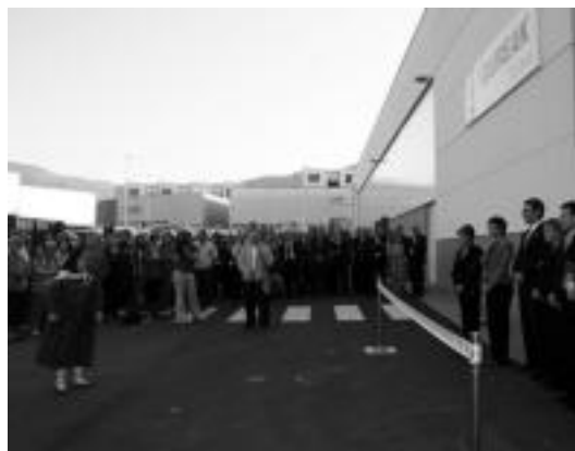
Hasiera emateko, aureskua dantzatu zieten agintariari. E. EZEIZA

Gureak taldearen isla da. Ezin duak gizarteratzeko lan handia egiten ari gara Gureak-en, baina horretaz gain, erakutsi dugu enpresa lehiakor bat izatea lortu dugula», gaineratu zuen Gureak taldeko lehendakari eta zuzendariak. Luzatutako datuen arabera, Taldeak 4.000 pertsonari lana ematen die gaur egun eta gehienak ezintasun bat duten pertsonak dira. Hala, eraikin berri honekin dagoeneko 40 dira Gureak Taldeak Gipuzkoan dituen lan zentroak.