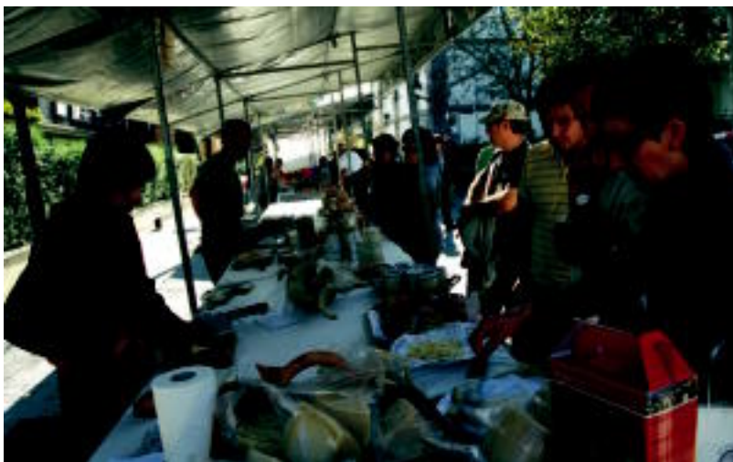
Bulebarrean egin zuten Alegiko azoka, lanak direla eta; Zizurkilen 50 postu jarri zituzten.