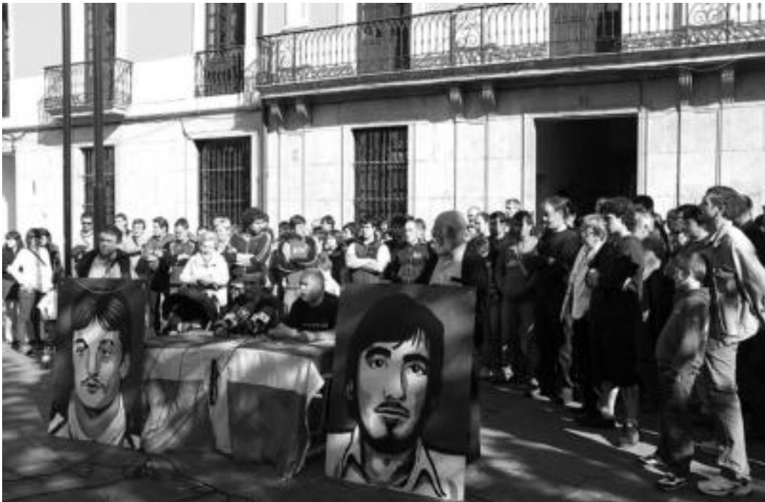
Jende asko gerturatu zen igandean Tolosako Triangulo plazara aurreko eguneko manifestazioan gertatutakoa salatzeko.