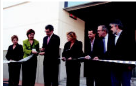
Etخانiz, Olano, Romeo eta Bildarratz, besteak beste, inaugurazioan.

TOLOSALDEA Atzo inauguratu zuten 4.000 metro koadroko lantegia Apattaerrekan »