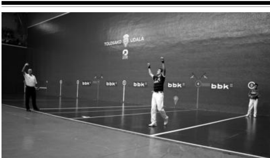
Tolosako Beotibar pilotalekua pilotazalez beterik aurkeztu zen atzokoan, ezusteko handi bat ikusteko aukera izan zuten hauek. A. IMAZ