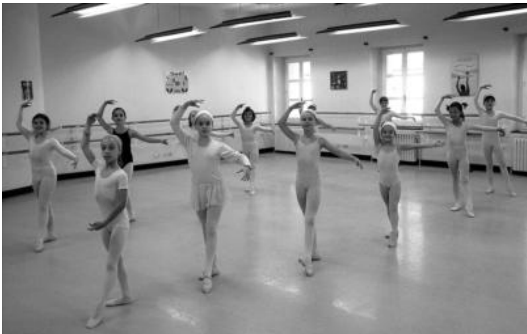
Dantza Klasikoko klaseetan ikasleek baletaren oinarriko pausoak ikasten dituzte.