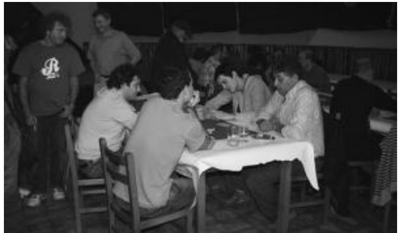
Elkartean mus txapelketa egin zuten; bikoteek gogor jokatu zuten garaikurra. N. URBIZU

Toka txapelketa izango da eguerdian eta babarrun-jatea izango dute bazkaltzeko garaian. Bertan, Goteraseri (Jabier Ugarte) omenaldia egingo diote, eta Ttonktor elkarteak abestia kantatuko dio. Ondoren, Kultur Asteko azken ekitaldi bezala, dantzaldia izango da Koxkorrena orkestrarekin. Aurtengo Kultur Asteak itxura polita izan du: berriz ere bertakoen parte-hartzea ezinbestekoa izan da eta bertakoek gozatzeko aukera izan dute.