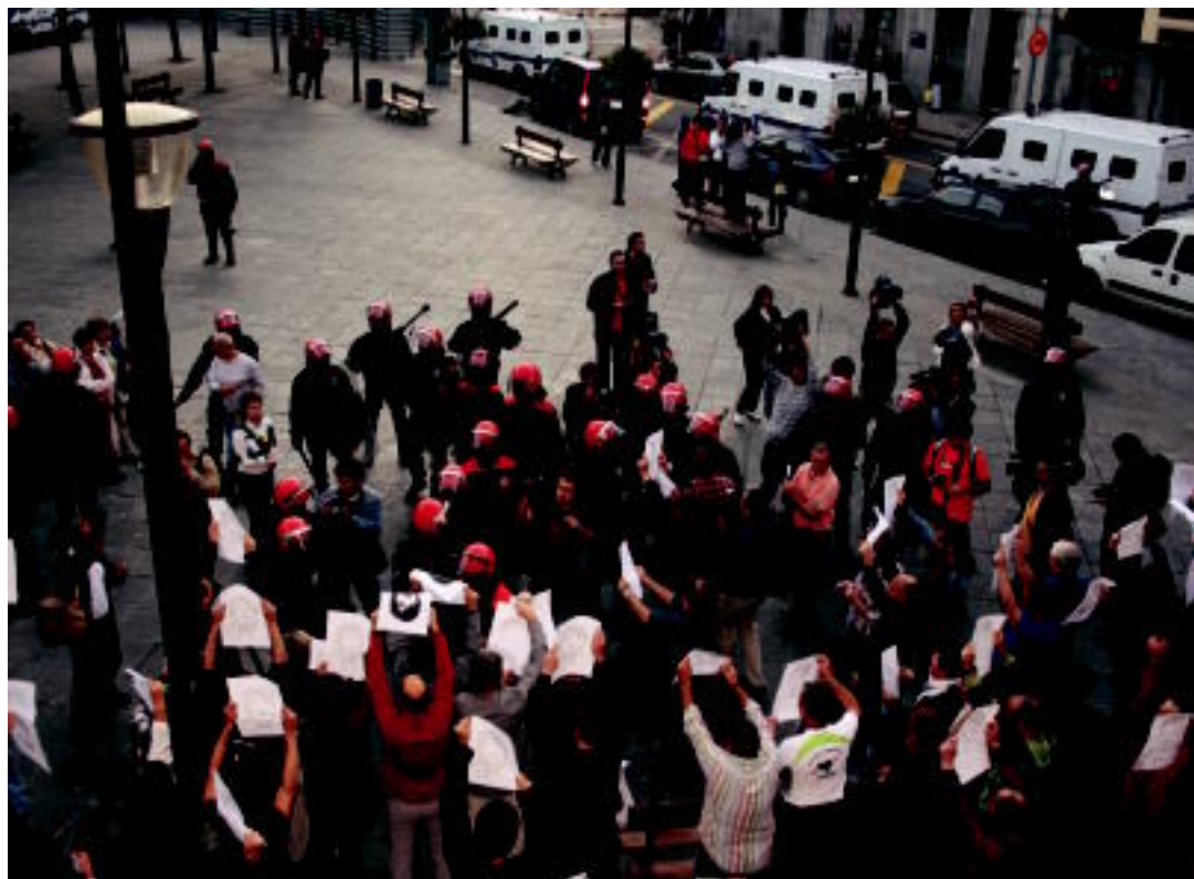
Ertzaintza manifestarien aurrean jarri ziren, manifestazioa debekatzeko; tentsioa bizitu ziren. N.URBIZU

ATXILOKETAK Ertzaintza behin baino gehiagotan oldartu zen manifestarien aurka eta sei lagun eraman zituen 6