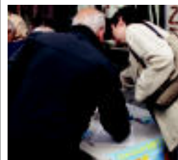
Herritarrak sinatzen.

Gurea aretoa jendez lepo, Gipuzkoako Kantu Txapelketan 6