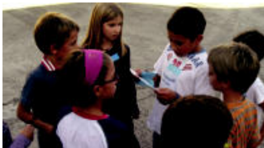
Altxorren bila jolasa egin zuten umeek. N.URBIZU

TOLOSA Gaur izango dute azken eguna; ekitaldi ugari antolatu dituzte 5