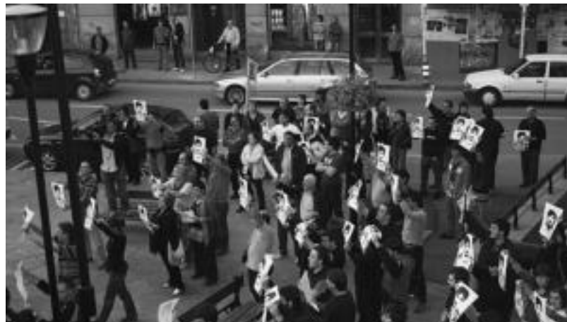
Jende ugari Joxi eta Joxeanen irudiak atera zituen eta protestan hasi ziren ertzainen jarreraren ondorioz. N. URIBIZU

ziren. Ostiko eta jipoi asko ikusi ahal izan ziren. Behin baino gehiagotan oldartu zen Ertzaintza.