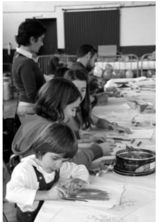
Etzeko gazteenak margotzen ere aritu ziren Ferialekuan. N. URBIZU