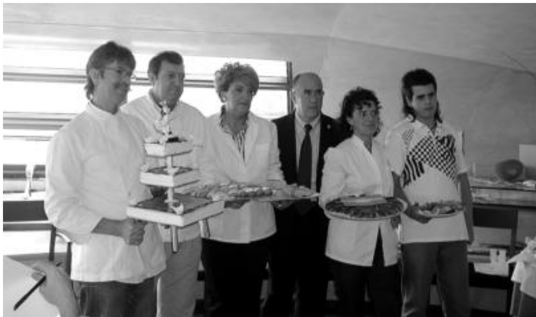
Hilaren 25ean ospatuko den Tolosa Goxua azoka aurkeztu zuten atzo, Udaleko ordezkariak eta hiriko gozogileak. E. EZEIZA