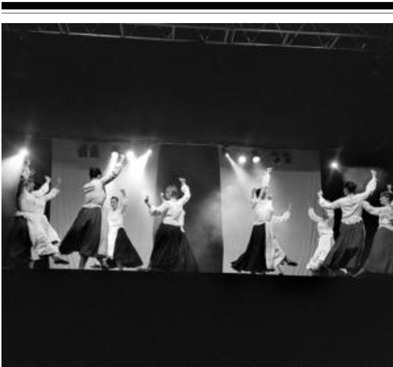
Alurr dantza taldeak hainbat ikuskizun prestatu ditu bere ibilbidean zehar. HITZA