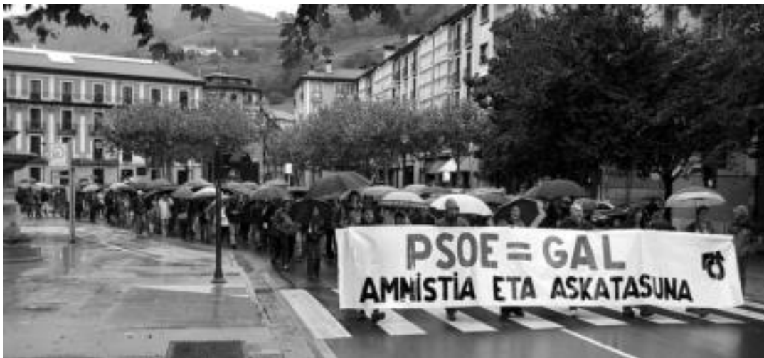
Gaur 19:30ean lore eskaintza egingo zaie Lasa eta Zabalarri Benta-Haundin. Etzi manifestazioa egingo da Tolosako Triangulotik irtenda 19:00etan. IMANOL GARCIA