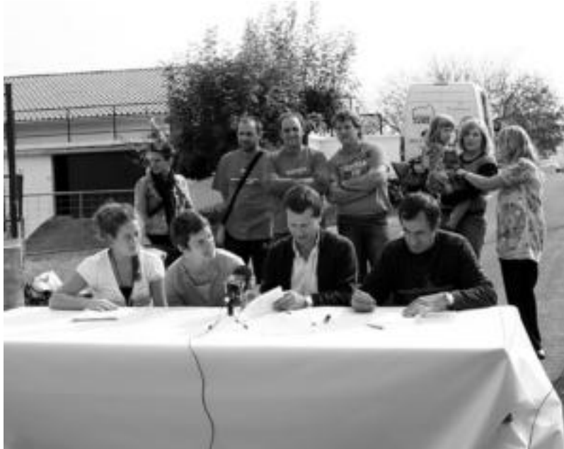
Alurtxiki auzo elkarteak ordezkariak eta Tolosako Udalekoek larunbatean sinatu zuten lankidetzaren hitzarmena. HITZA

Larunbateko ekitaldia etorkizuneko asmoak eta helburuak lortzeko abiapuntu izan zen. Bazkaria hasi aurretik, Tolosako Udaleko ordezkariak, eta auzokoeak, lanki-