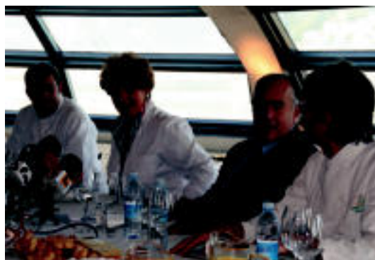
Oraingoan Donostiako La Perla aukeratu zuten aurkezpena egiteko.

TOLOSA Urkizu auzoa berpizteko lankidetzaz hitzarmena sinatu zuten pasa den larunbatean Alurtxiki auzo elkarteak eta Tolosako Udalak 4