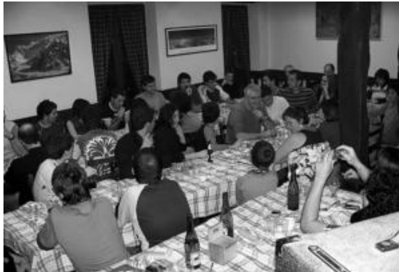
laz ere bertso afaria egin zuten, Intxurre elkartearen. Jendetsua izaten da eta giro polita sortzen da. HITZA

Asteroko helduen bertso eskola honetaz gain, umeen bertso-eskola ere martxan jarri nahian dabil-tza. «Baina oraindik dena zehaztu gabe daukagu».