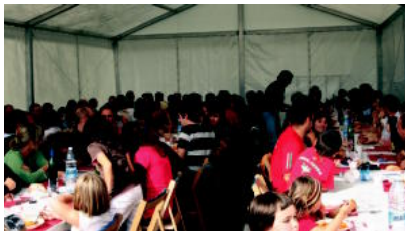
Jende ugari ibili zen Urkizuko auzo bazkarian; bertan sinatu zuten hitzarmena Udalarekin.