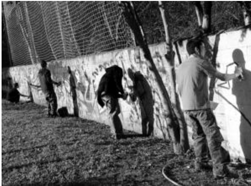
Larunbat honetan, 16:30etik aurrera, Graffiti erakustaldia izango da; garai berean, skate txapelketa. NEREA URBIZU