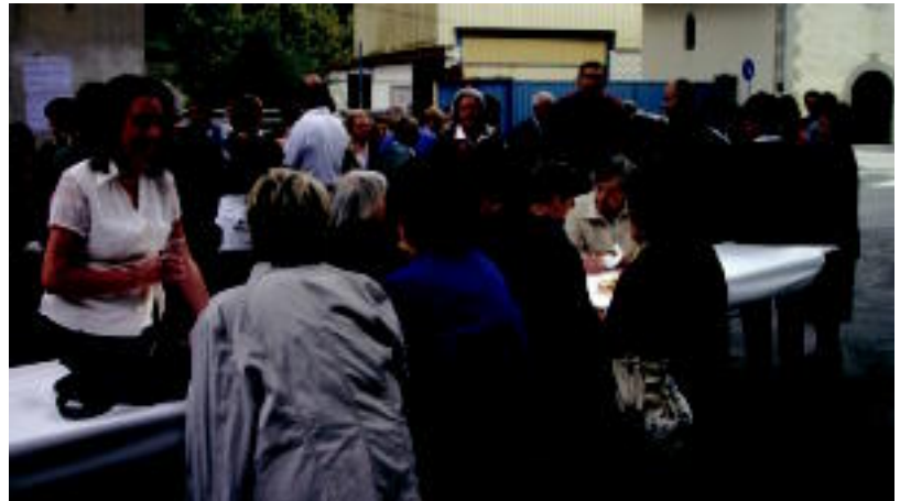
Hamaiketako ermitaren ondoan egin zuten, duela urte batzuk egiten zuten bezala, HITZA

Kutturru parkean ia bertatik bertara dago, ermitaren ingurutik gora aldera. Aurten parkeari pega eginda