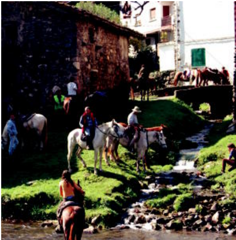
Orotara, 63 zaldi elkartu zituzten pasa den asteburuan Leitzatik Goizuetarako ibilbidean. HITZA