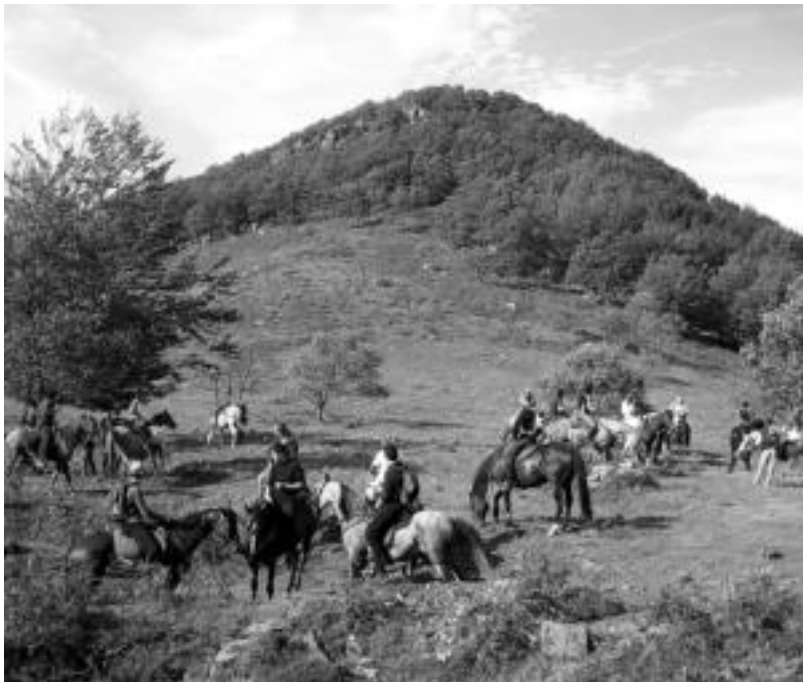
63 zaldi elkartu zituzten iragan asteburuan Leitzatik Goizuetarako bidaian. HITZA