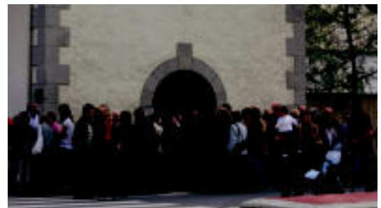
Meza Pilar ermitan ospatu zuten, HITZA

Kutturruko obrek martxora arte iraungo dute, gutxi gorabehera: datorren Pilarrerako bukatuta egongo dira, beraz.