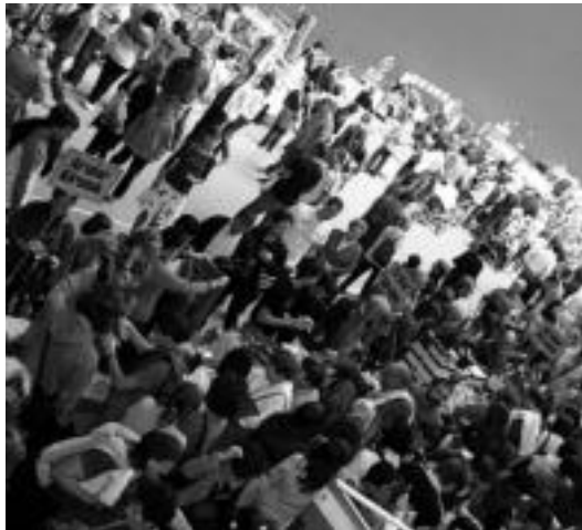
Goizean goiz hurbildu zen jendea Beotibar pilotalekura. E. EZBZA

Lan handia suposatzen du azoka antolatzea: «Bi egunetz izaten den lanaz gain, material guztia aukeratu egin behar da, prezioa jarri eta kaxatan sartu ondo bereiztuta, gainera, igandean berriz ere arropa gehiago atera genuen». Hori dela eta, «ezinezkoa» da urtero antolatzea; hurrengo edizioa egon