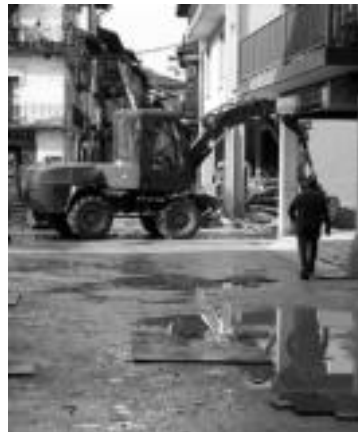
Azokan zaldiak eta hegaztiak izango dira animalien artean. Azoka ez da plazan izango, obretan baitaude.