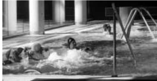
Usabalgo Spa zerbitzua dohainik eramateko aukera dago. HITZA

Gizartea » Tolosaldeko landetxe batean bi gau igaroz gero, Usabalgo Spa zerbitzuetarako sarrera dohainik eskainiko dute.