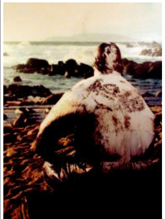
Galiziako Muxia herriaren inguruan aterata zituzten argazkiak.

TOLOSA Jendetza hurbildu zen Beotibar frontoira eta «oso gustura» daude antolatzaileak 2