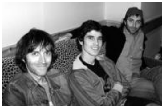
Duela 10 urte hasi zen hirukotea izango da Berastegin, larunbat honetan.

Hirukote moduan agertuko dira Bide Ertzeanekoak, larunbat honetan Berastegira. Duela 10 urte hasi ziren bezala. 1998ko udazkenean plazaratu zuten beraien le-