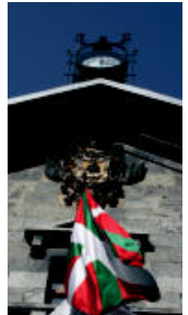
Atzo eguerdiko irudia. A. IMAZ

Leitzako Bai Euskal Herriarik azaldu duenez, «1977. urtean hiru egunetarako jarri zuten ikurrina udaletxean. 1979. urtean, Euskal Herriko Aizkolari Txapelketaren baitan, Amnistia eskatzen zuten pankarta batekin batera, ikurrinak bere tokia berreskuratu zuten. 1995. urtean, HBren eta EAren udal ordezkariak 1991n onartutako mozioa bete egin zuten, hau da, karguak hartu bezain laster ikurrinamodu iraunkorrean udaletxeko balkoian jarri zuten. 2005ean, Nafarroako Gobernuak, ikurren inguruko erabakia praktikan jarri zuten, eta garai horretako alkateak, herriari ezer galdetu gabe eta bere erabakiz; 10 urteren ondoren, ikurrina kendu zuten».