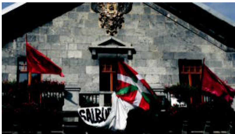
Ikurrina Leitzako udaletxean jarri zuten, Hispanitate egunean. A. IMAZ

TOLOSA Elkarrizketa digitalean irakurleen galderak erantzun zituen zuzenean 2-3