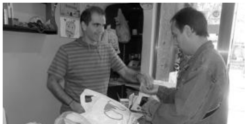
Argazkian, zerbitzuak euskaraz eskaintzen dituen dendari bat.

letarako, besteak beste, arkitektoak, ingeniariak, informatikariak, abokatuak, aholkularitza, kultur zerbitzuak, aisialdi zerbitzuak, kirol zerbitzuak eta informatika-Internet; eta herritarrentzako, margolariak, elektrikariak, iturginak, arrotzak eta igeltseroak. Bestalde, informazioa eguneratzeko sistema irekia izango da, edozein mo-