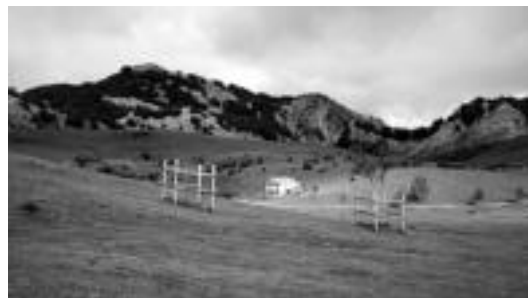
Gorbeira joango dira igande honetan Sagain taldekoak. HITZA

Autobusa 08:00etan aterako da udaletxe aurretik eta itzulera arratsaldean izango da (ordua zehaztu gabe). Autobusean ordaindu beharrekoa: 12 urtetik berakoek 5 euro eta 12 urtetik gorakoek 10 euro. Izena eman nahi duenak kiroldegian egin dezake eta horretarako azken eguna etzi izango da. Informazio gehiago lortzeko, www.sagain.org helbidean.