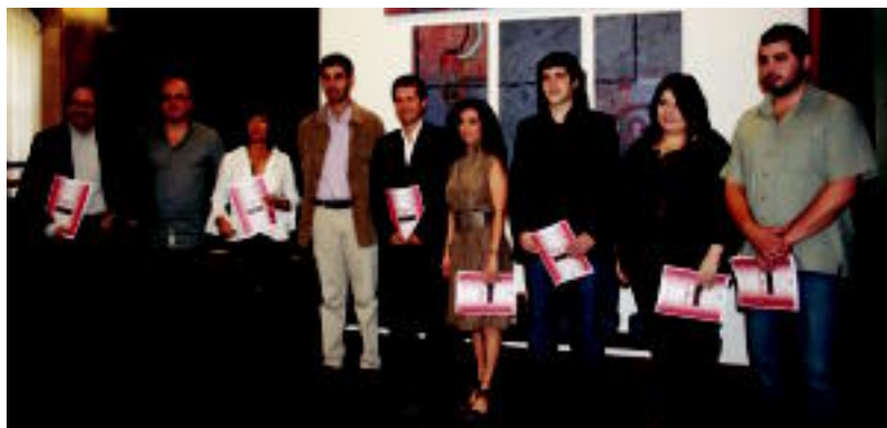
El caserio laneko protagonistak atzo Donostian egin zuten prentsaurrekoan.

ENTSEGU NAGUSIA Piztu den ikusmina dela-eta ostiralean egingo duten entsegura joateko aukera ere izango da