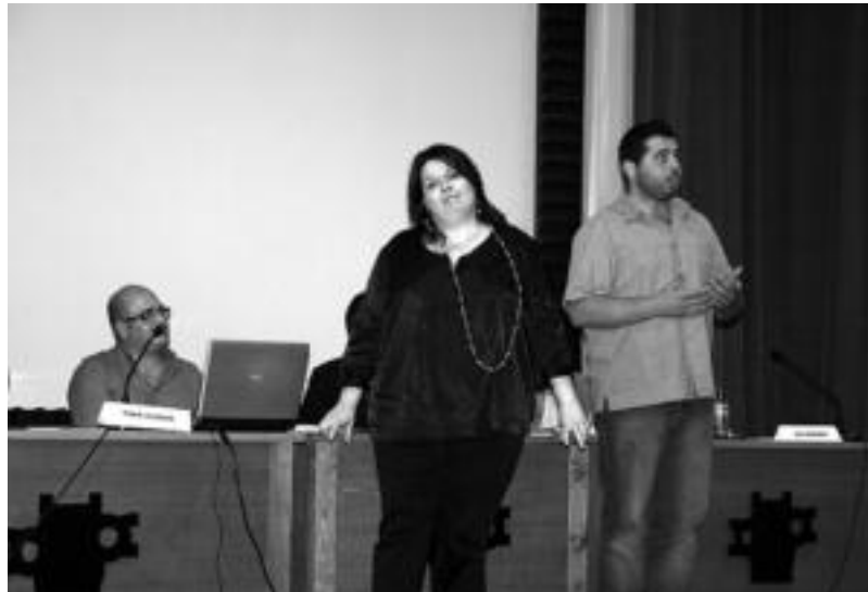
'El caserio' zartzuclaren aurkezpen ekitaldian, obrako zenbait une antzestu zituzten protagonistek. E. EZEIZA

Baserrin baten ondorengotzaren gainean XIX. mende hasieran zeuden ohiturak islatzen ditu. Ho-