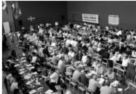
Jende ugari elkartu zen frontoian bazkari herrikoa egiteko. HITZA

Igandean ondo joan ziren antolatutako ekintzak. Azokari dagokionez, aurreikusita zeudenak baino lau postu gutxiago izan ziren. Goizetik izan zen haize bortitzak postura eramango zituzten pro-