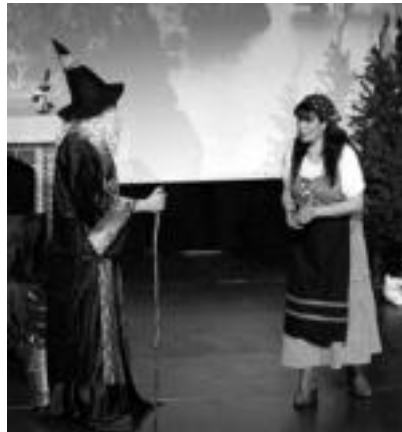
Bihar Leidorren ikusgai izango den Opera Divertimentoren Kolas mago harrigarria antzezlaneko bi une.