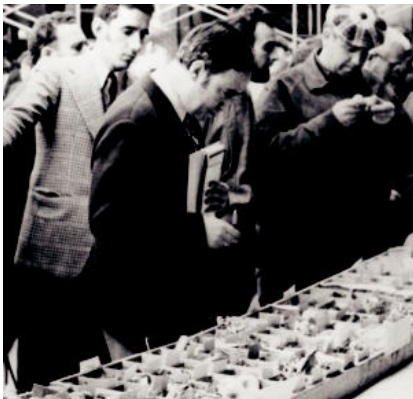
70. hamarkadan mikologia erakusketa eta lehiaketa ugari egiten ziren. Irudian horietako bat. HITZA