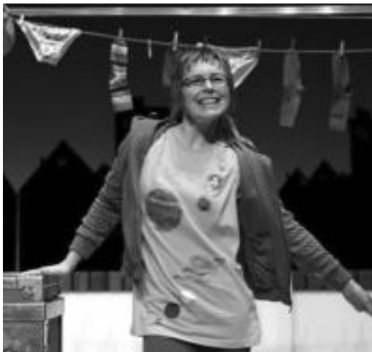
Bihar izango da ikuskizuna ikusgai, Altzon.