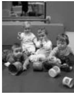
Haur eskola oso koloretsua da. n.u.

ALBIZTUR » Aurten lehen aldiz Albizturten haur eskolaren zerbitzua dago. Bertan herriko bost haur daude eta aurki berri bat hasiko da. Haur eskola udaletxearen azkeneko solairuan dago: Albizturko Udalak, haur eskolaren aretoa nola gelditu den ikusteko aukera eman nahi izan die herritarrei, eta egun bat zehaztu du horretarako. Etzi izango da, 12:00etatik 14:00etara. Beraz, nahi duen guztia dago gonbidatuta.