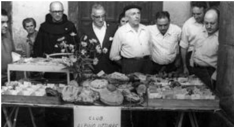
70. hamarkadan egiten zen ekimen bat berreskuratu nahi du biharkoarekin, Alpino Uzturre elkarteak. HITZA