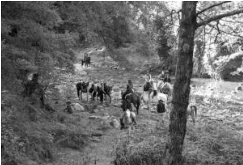
Mugaz-muga Leizatik Goizuetara joango dira bihar. Etzi Goizuetatik Leitzara itzuliko dira, beti ere zaldiekin. HITZA