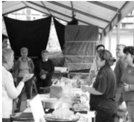
Pasa den urtean ere paella jan zuten auzotarrek. N. GARZIA

Eta berrikuntzei dagokionez, zahagi sagardoaz azpimarratu nahi izan dute antolatzaileek; «2 kupel jarriko ditugu, eta norberak afaria