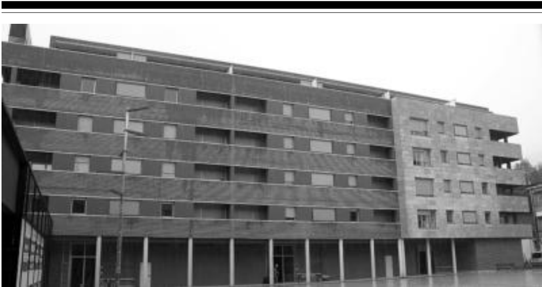
Flemingo etxebizitzak Gurea aretoaren ondoan daude eta bukatzeaz daude eraikitze lanak. I. GARCIA