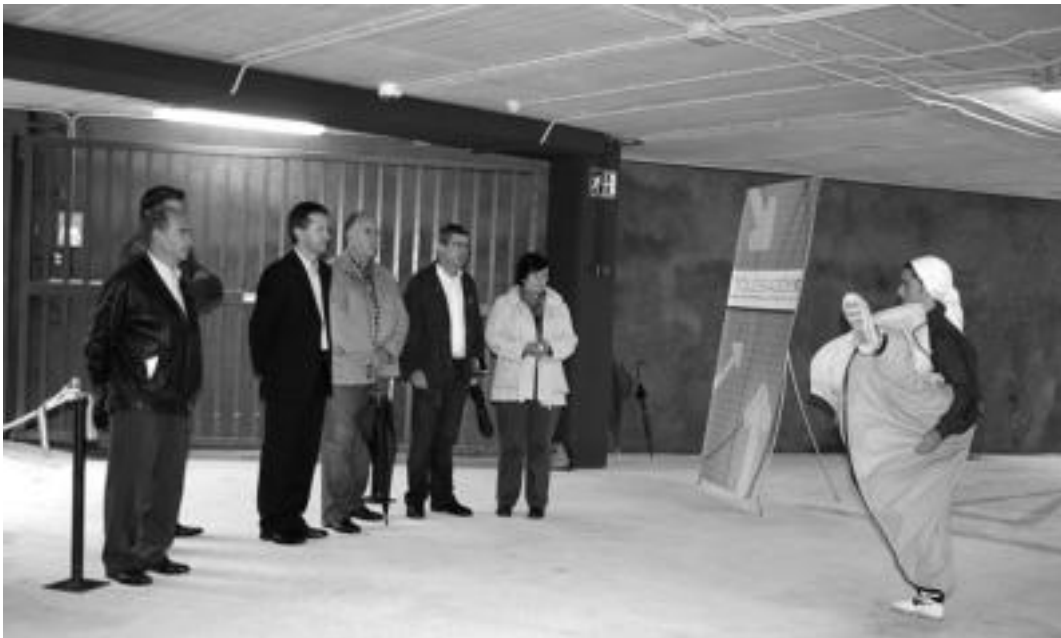
Atzo goizean inauguratu zuten Rondilla kaleko aparkalekua; 221 auto uzteko tokia dago bertan. ESTI EZEIZA