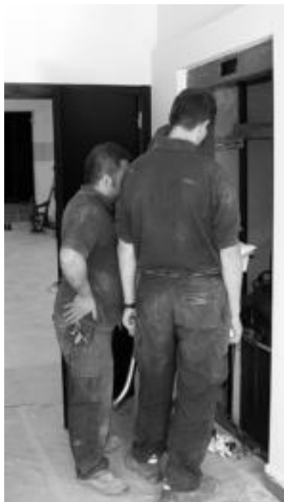
Igogailuak bost geldialdi izango ditu, bata frontoietako gradetan. Igogailua irailaren erdialdean jarri zuten. N. URBIZU