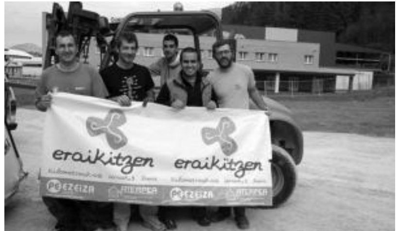
Muntaia batzordeko zenbait kide, aste honetan, Irurako Ikastolaren gunean. I. GARCIA

Eginkizun handiena, noski, bihar-ko festarako beharrezko guztia muntatzea izan da. Azken egunetan paperean zutena errealitatean nola gelditzen zen ikusten joan dira. «Guri komeni zitzaigun ahal zen azkaren jakitean joango zi-