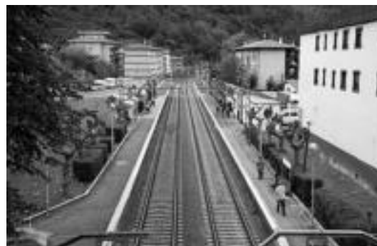
Anoetako geltokiko gasak lehen baino 60 metro gehiago ditu, I. GARCIA

Renfe Aldiriak zerbitzuko tren guztiak lau minutu geratuko dira