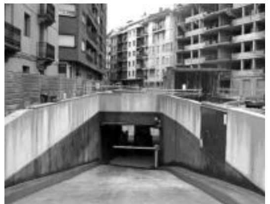
Belate auzotik du sarbidea lehendabiziko solairuak.