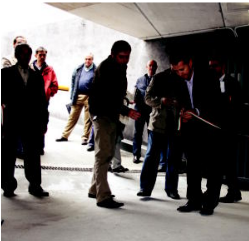
Atzo egin zuten Rondilla kaleko aparkalekuaren inaugurazio ekitaldia. ESTI EZEIZA