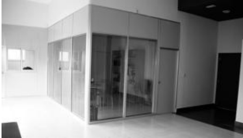
Hau da Kultur Etxeko harreraren itxura berria: erdiko gela bilera egiteko izango da. Ezkerrean bulegoa dago.