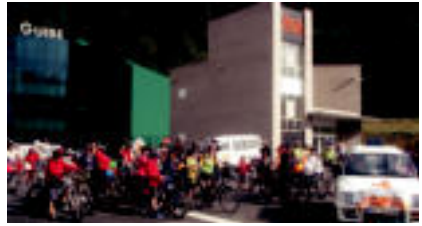
Kilometroara bizikletaz jateko dela luzatu zuten eskualdeko ikastolako ikidek bizikleta martxo eguzia.

Irura » Biharko jaialdi irurako jateko, hainbat aukera izango dituzte kilometroaleak autoa etxe ondoan utziz.