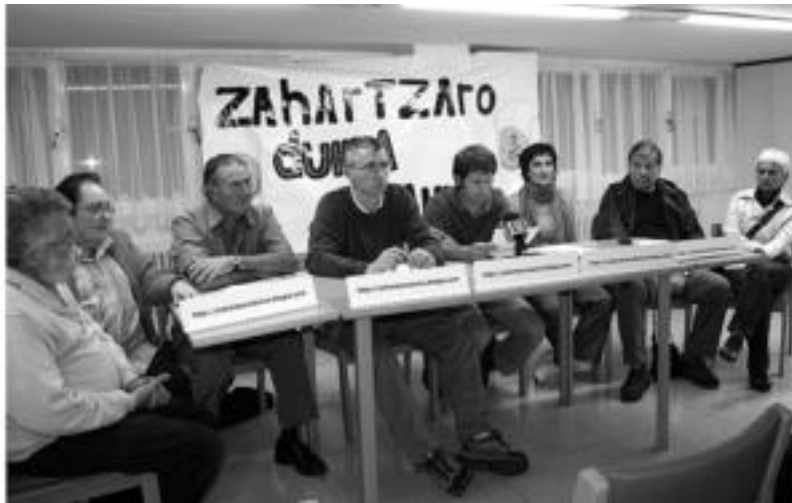
Zahartzaro duinaren aldeko plataformaren kideak, herenegun.

tea dago, eta guk ez dugu ikusten parte-hartzearena betetzen denik, bultzatu baino parte hartu nahi dugun herri taldeei trabak besterik ez dizkigute jartzen».