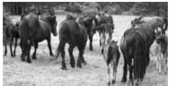
Jaka Navarra edo Nafarroako poniak desagertzeko arriskuan. HITZA

Interesa duenak, bihar 19:00etan hitzordua dauka liburutegian; gai honen gaineko jakinmina piztu edo hasetzeko.