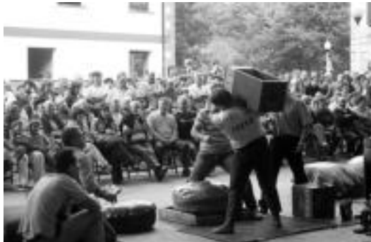
Harri-jasotzaile handiak hurbiltzen dira urtero Ugarteko festetan. A. OTEZABAL