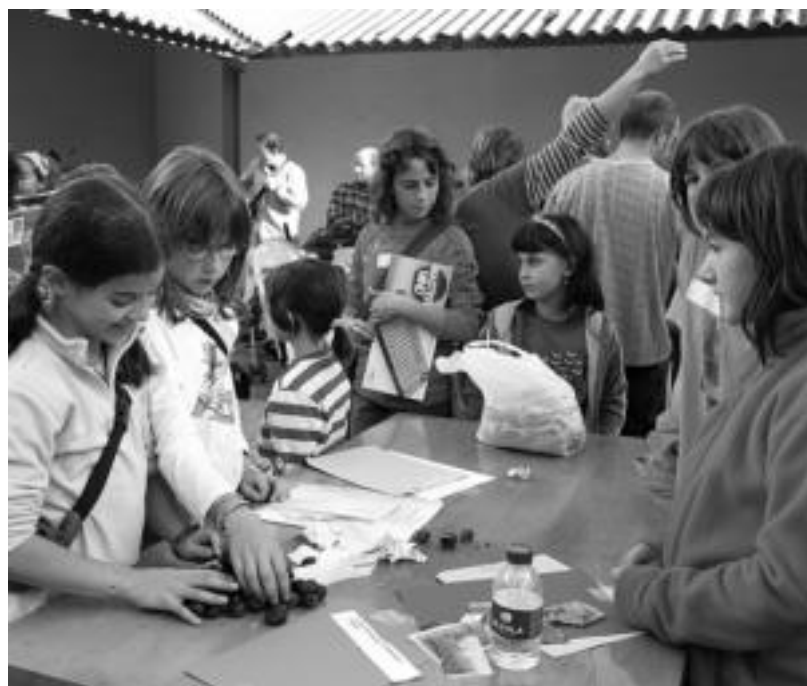
San Esteban auzoan iaz izan zen Kultur Astearen una bat. ESTI EZEIZA