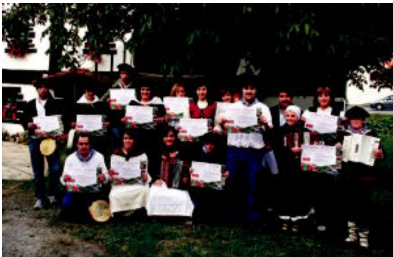
Euskal Jaiaren aurkezpena egin zuten Arotzenen baserriaren ondoan, herenegun. I. GARCIA