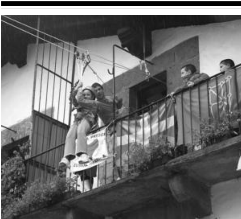
laz bezala, Aurrera KEren Egunean, etzi, tirolinan ibiltzeko aukera izango dute txikiak. NEREA URBIZU