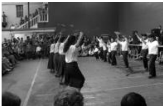
Ugarteko Ingurutxoak igandean dantzatzen ohi dute. A. OTEZABAL

ko asteartea izan zen azken eguna, eta norbait atzeratuta baldin badabil, Goikoetxearenaekoekin hitz egin beharko luke. Bestalde, Ugar-