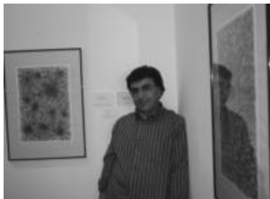
Aranburu jauregian ikusgai diren bi artelan aterako dira enkantean. I. T.

■ Kamarera. Anoetan esperien-tzia duen kamarera bat behar dugu. Igandeetan jai. Interesatu-ek deitu 650 04 31 39ra.