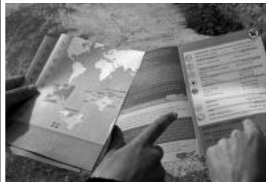
UEMAK etorkinak informatu nahi ditu, nora datozen esanez, esaterako. HITZA

teko aurtengo jaietako argazkiak eta bitxikeriak biltzen joango dira, eta ugartetik.blogspot.com -en ikusgai izango dira.