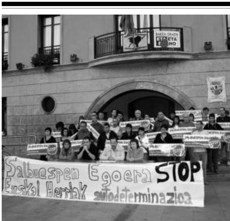
Itxialdien berri emateko Ibarren egin zuten prentsaurrekoa Tolosaldeko ezker abertzaleko hautetsi eta alkateek. R.CALVO