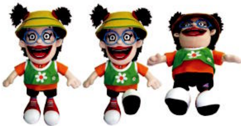
Gaurtik aurrera, HITZAren irakurleek Mari Mototsen panpina berria eskatu ahal izango dute. HITZA

Azken urtean Euskal Herriko hainbat herri eta bazterretan eman duten ikuskizun horretan, Pirritx eta Porrotxek aurreko ikuskizunean ezagututako Mari Motots maitagarria gaixo ageri da, erietxean, mototsik gabe. Gaixotasunari, ordea, aurre egingo die Pirritx eta Porrotxen babesarekin eta alaitasunarekin, eta Txan magoaren eta beste zenbait lagunena- rekin batera.