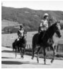
Larrañeta Berri baserriko lursailetan izan ziren proba eta prestaketak. Guztira 29 zaldi aritu ziren Zaldi Raid lasterketan HITZA