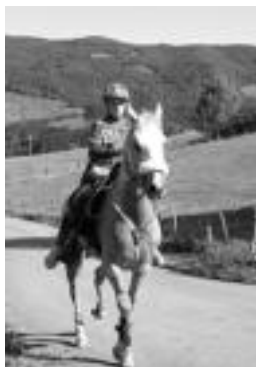
Zaldien kontroletatik parte-hartzaile guztiak pasatu behar ziren. HITZA

Bedaioko Larrañeta Berri baserriak dituen lursailetan antolatutako zaldi festa hau, 4x4 ibilgailuak eta erremolkeak, Vet gate kontrol-gunea, eta sarrera eta irteera kon-