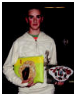
Opariak jaso zituen Lasak. P.R.

Bedaioko Zaldi Raid lasterketa «arrakastatsua», 29 zaldunen partaidetzarekin»