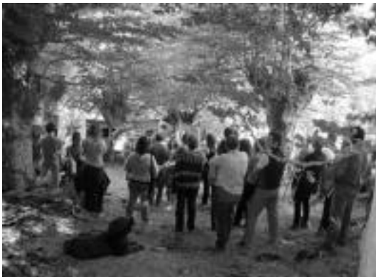
Amezketan mendi martxa egin zuten Gudari Egunaren baitan. HITZA

Tolosaldeko eta Leitzaldeko ezker abertzaleak azken hilabeteetako gertaeren inguruko hausnarketa egiteko baliatu zuten atzoko eguna eta egoera «gordinenetakoa» dela esan zuten.