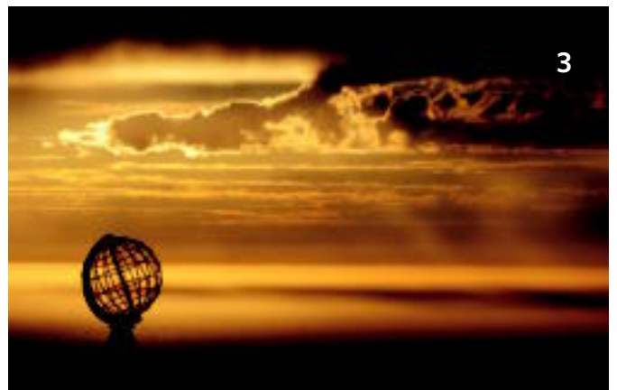
Ibon Azpilikuetak Norvegiako Nordkapp lurmuturrean atera zuen argazkia.