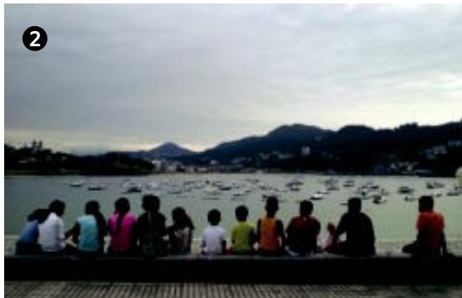
haur sahararrak itsasoari begira ari dira Donostian.