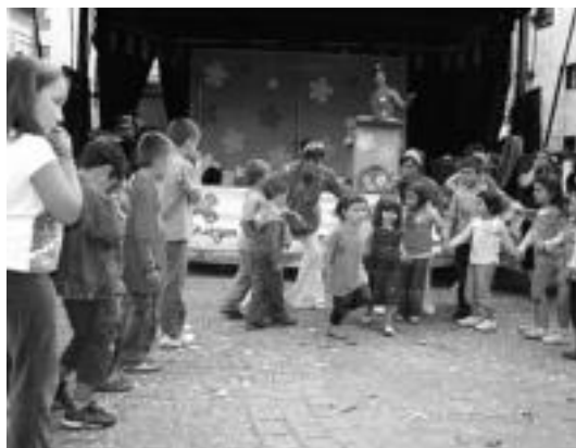
Herritarrak suziria jaurtitzeko zain egon ziren gogotsu Aldaban. Iruran, gaztetxoek ederki igaro zuten, haur parkean, eta Kanpanolue kale-antzerkiarekin. A.I.