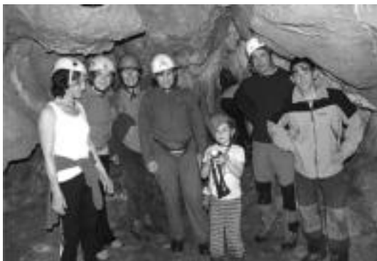
Elkarrean antolatutako lehen ekintza, Mendikuterako txangoa izan zen. HITZA