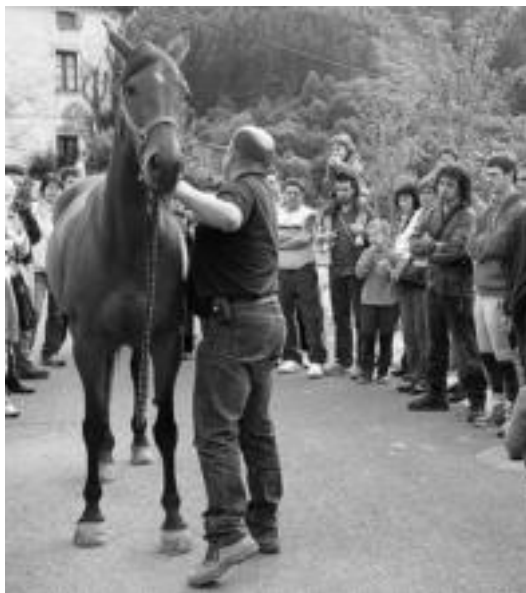
Pasa den ekainean Bedaion eskainitako ikastaroan hartutako irudia.

Zaletasun hori bultzatu asmoz antolatuta du Artubi Kultur Elkarteak, hain justu, I. Bedaioko Zaldi Raid Lasterketa biharko, non TOLOSALDEKO ETA LEITZALDEKO HITZA ere laguntzaile moduan hartzen duen parte. Goizeko hamarretan hasiko da lasterketa, nahiz eta zaldunek, 28k eman dute izena, 09:00etan egon behar dute bertan