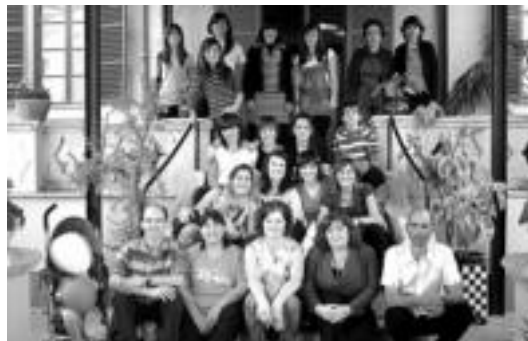
Hodei Truk abesbatzako kideak Mallorcan. HITZA

Abesbatzako arduradunek azaldu bezala, «Hodei Truk abesba-