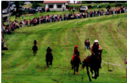
lazko lasterketaren momentu bat. J. AZKUE

Zizurkil » Guztira 18 parte-hartzaile izango dira, orain arteko kopuru handiena; tartean eskualdeko zaldunak izango dira.