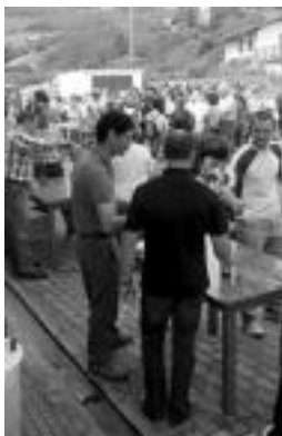
Iazko sagardo dastaketa. A. OTEZABAL