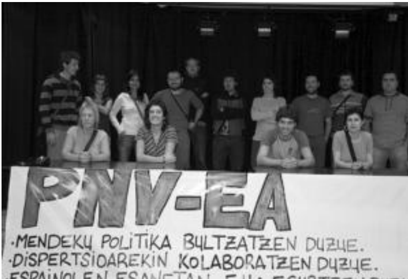
Goar Jimenezek argitu zuenez, «uztailaren 29an erabaki zuen Udalak preso senideen diru laguntzak etetea». R.CALVO