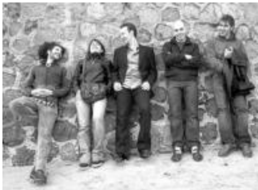
Karma Quintet taldea bihar izango da ikusgai Frontonen. HITZA

Musika » 23:00etatik aurrera izango da jazz taldearen zuzeneko kontzertua; sarrera doan izango da.