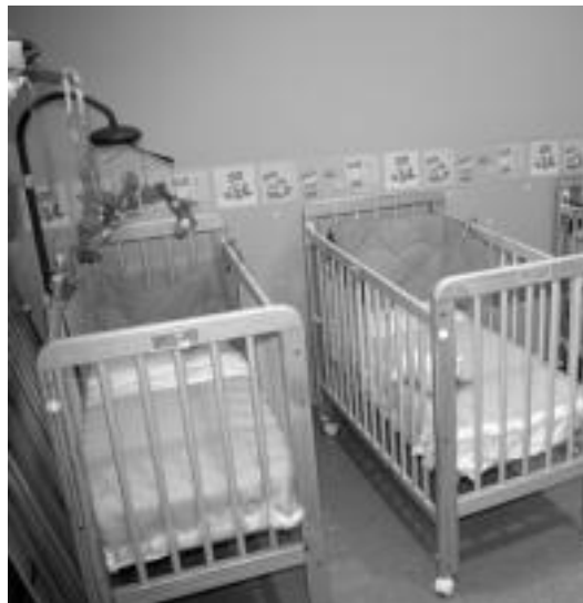
Logelan hiru sehaska daude oraingo, baina gutxinaka egokitzen ari dira. N. U.