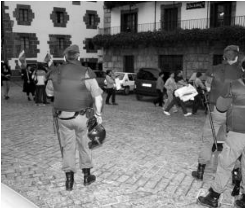
«Salbuespen egoera» salatuz urriaren 4ean Bilbon egingo den manifestazioarekin bat egin du Etxeratak. A. IMAZ