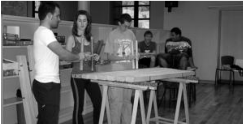
Txalaparta jotzen ikasteko aukera izango da besteak beste, Gaztedia sailak antolatutako ikastaroetan. E. EZEIZA