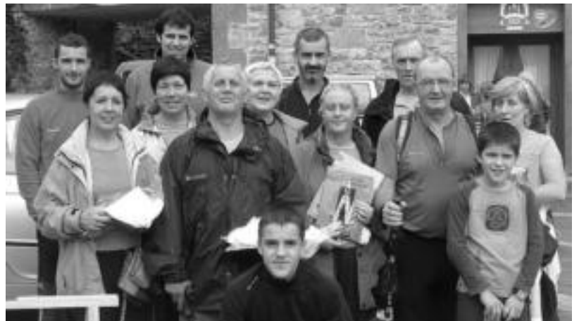
Goian, Leitzako geltokian korrikalariak zain. Beheran, Areson mendi martxa amaitu ondoren partaideak.