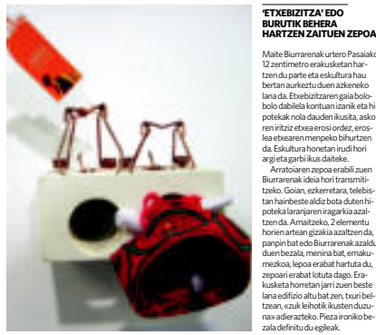
ETHEBIZITZA' EDO BURUTIK BEHERA HARTZEN ZAITZEN ZEPORA

Sormena zuretzako zer da? Pertsonalki nahik behar dudana gauza bat da, niri asko laguntzen dit naitzen modurako. Ez da droga bat bezala, baina on egiten dit, lasaitu egiten nait, zentratuago egiten nait, nahiz eta batzuetan ere estresatzen zaren. Ze transmittitu nahi izaten duzu? Hori azaltzen ez da erraza. Azkenean nik usie bakoitzaren bihepak nik ditek, buruan daukazuna ezarria. Ez ditue esan oso pertsonalak direla, nahiz eta gai sozialak landu? Bai, gai sozial bat landu arren ezin dit inpersonalki egiten. Jendek zure lana ikusita ze erantzükigia izatea gustatuko litzazükigia? Gukinoko itaioa zabaltzükigia gabe. Gero, zer bait egiten duzuenen buruan zer bait duralako da eta hori transmititu nahi duralako, baina gortetzen da transmisio hori baturan ez dela egiteko. Batzuetan gauza gehiegi jartzen dituzu pieza baten, jendek uletu ahal izateko. Azken finean zer bait komunikatu nahi duzu, eta behar bada ez dute ulertzen nik eman nahi dudana, baina behintan behin sententzia batekin joatea gustatzen zait, ez bakarrik estetika adertik, -burukitu egiten nait usie esateko -hota tradizio zaila. Horretako zer bait. Asko egiteko duralako sentitzen duzu oraindik? Asko ikusita, asko duralako... nire amesa hau ez baztertzea izango litzateke, nire aukeren barruan jarraitzea. Diseinua egin nucean pentsatzen nuen gero ez niela ezere egiten, eta horrek behar du ematen dit, eta ez nuke guzti hau usie nahi, mesekegaria zaidalako.