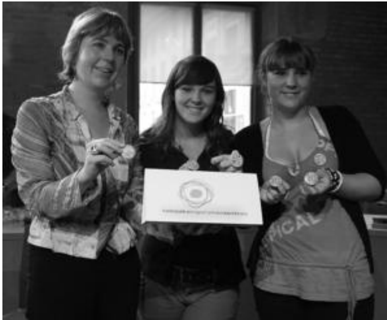
Tolosako Udaleko ordezkariak ikastetxeetakoekin batera aurkeztu zuten atzo Mugikortasunaren Astea. E. EZEIZA

Duela hiru egun inauguratu zuten Zizurkil eta Asteasu arteko bidegorria. Orain, Mugikortasun Astearen baitan, ibilaldi bat egingo dute bizikletaz, hortik. Denara, sei kilometro inguru zeharkatuko dituzte txirindulariek, eta tartean, hamaiketako egiteko aukera izango dute Asteasun, indarrak hartu eta itzultzeko.