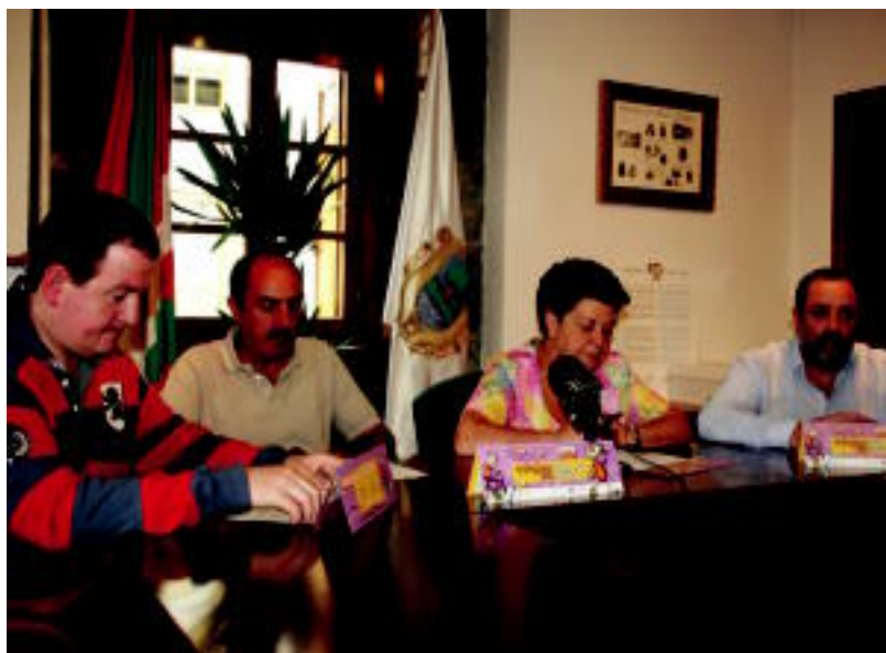
Ernioaldea 21eko Udaletako zenbait ordezkari bildu ziren Iruran atzo, Mugikortasun Astea aurkezteko asmoz.