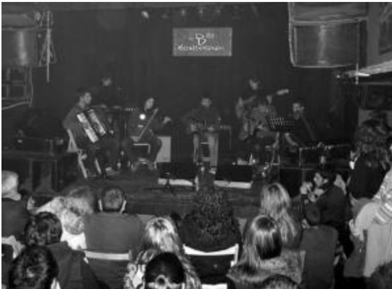
Bihotz Bakartien Klubak Tolosan, Bonberenean, Katamalo aurkezteko eskainitako emanaldiaren irudia. I. TERRADILLOS