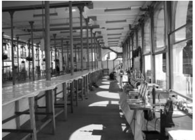
Guztia prest utzi ondoren, atzo itxura hau zuen Zerkausiak. Gaurtik aurrera jendez beteko da... I. TERRADILLOS