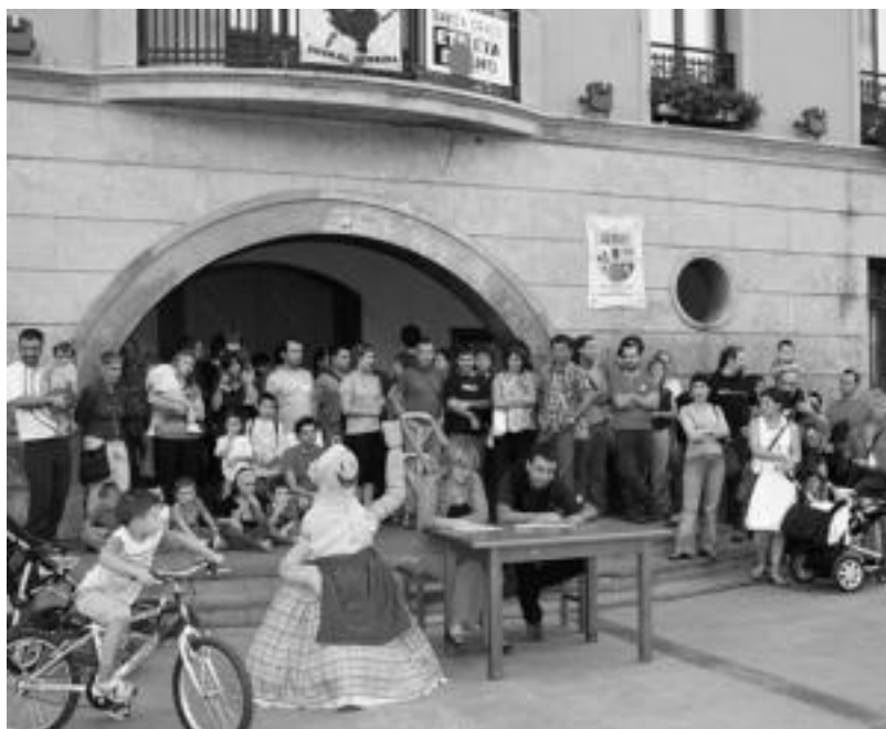
Prentsaurrekoa egin zuten atzo, Ibarra plazaan Bartola jaien inguruko balorazioa egiteko. R. CALVO