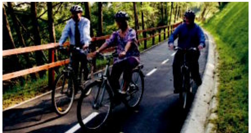
Ormazabal Garapen Iraunkorreko diputatua, Lazkano eta Amenabar Zizurkilgo eta Asteasuko alkateak, atzo. HITZA