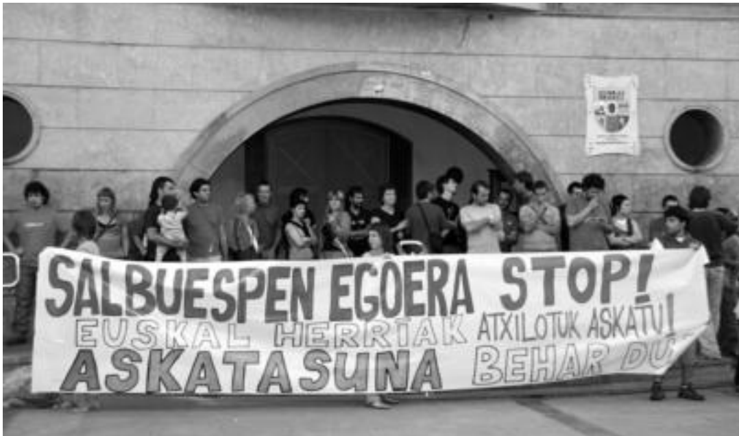
barran elkarretaratzea egin zuten herriko plazan, udaletxearen aurrean. R. CALVO