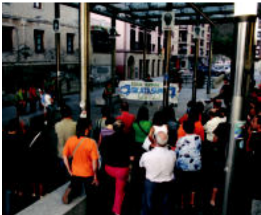
Villabonan batzar informatiboa egin zuten, eta 100 lagun inguru izan ziren. Ondoren manifestazioa egin zuten herriko kaleetatik. I. GARCIA

MOBILIZAZIOAK Eskualdeko hainbat herritan egin ziren atzo elkarretaratzeak; bihar, eskualdekoa Villabonan »