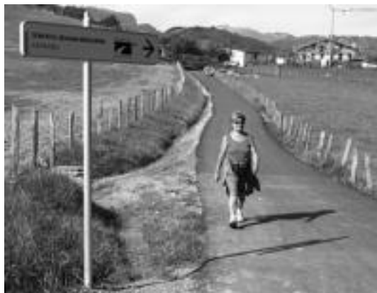
Oinez ibiltzeko sarri erabiltzen du jendeak bidegorria.