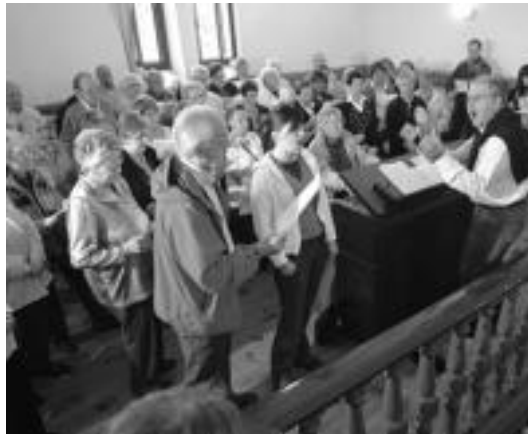
Santa Maria Kapera Izaskungo ermitan.