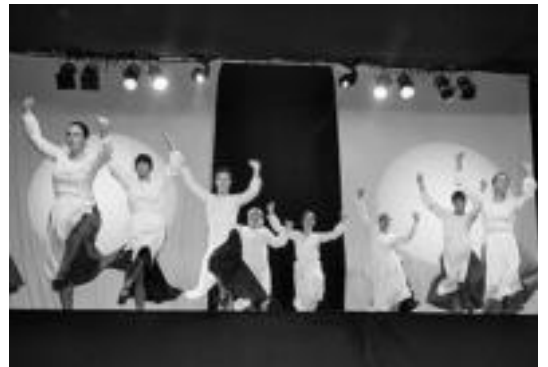
Alurrek pasa berri diren Ibarra festetan eskainitako ikuskizuna. HITZA

Egun garrantzitsua dute, hortaz, Ibarra taldeak denboraldi hasierarekin. Partida, esan bezala, 19:30ean izango da Lizarrerian kiroldegian. Betiko moduan Euskadiko Kutxaren bulegoaren parean geratu dira, 16:15ean, Nafarroa aldera joateko.