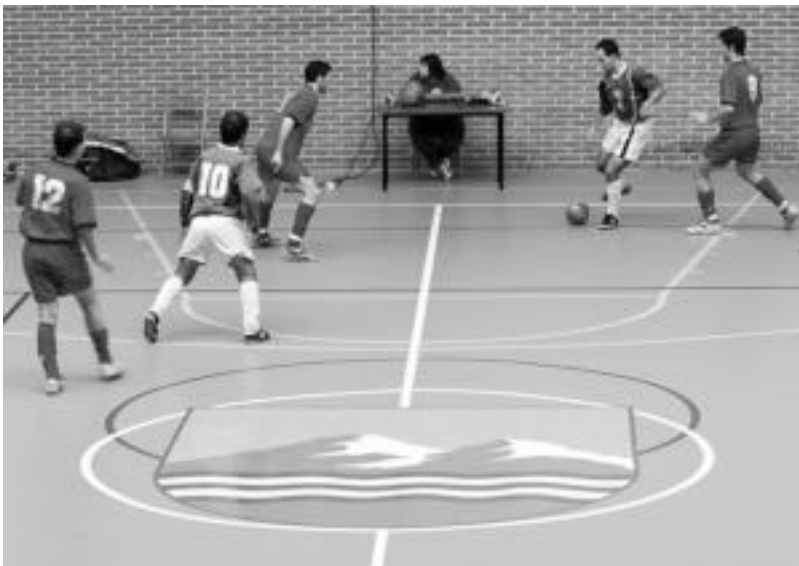
Ibarra ia jokalaririk berdinak izango ditu denboraldi honetan. HITZA

Dantza taldeak egin ohi duen moduan talde zein orduetegi desberdinak antolatu ditu ikastaroak emateko. Haurren kasuan eskolak lokal zaharrean emango dituzte eta asteazkenean 4-5 urtetakoen txanda izango da, astelehenean 5-6, 6-7, 7-8 eta 8-9koena, 9-10 urte-