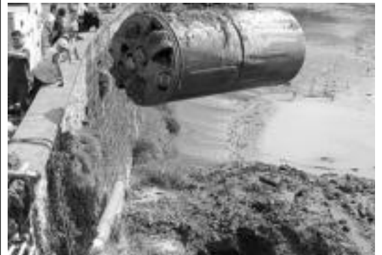
Makina mikrotuneladora urretatik atera zeneko unea. HITZA

Lumagorri elkarteak Euskal Autonomia Erkidegoko 50 ekoizlekin osatzen dute.