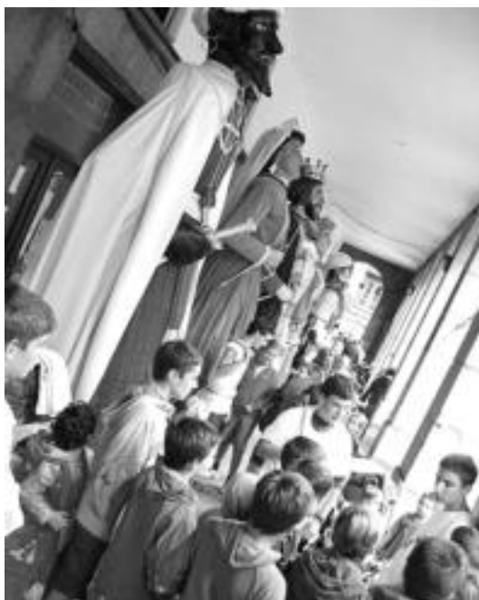
2006an, Tolosako 750. urteurrenaren ospakizunen baitan, Lizarra, Lakuntza, Iruñea, Tafalla eta Tolosako erraldoien egin zuten. J. ASTIBIA

Etzi eguerdi aldera ekingo diote lau konpartsek kalejirari. Alde Zaharreko kaleetan erakustaldia egin ostean, bazkaltzeko txanda izango da, eta arratsaldean berriro ere hartuko dute erraldoiek herria. Kalejira egingo dute Santa Maria Plazatik abiatuta, eta hainbat kaleetatik igaro ondoren, Plaza Berrian bilduko dira denak jendaurrean emanaldia egiteko. Azkenik, iluntze aldera, Gorriti plazan emango diote amaiera ikuskizunari.