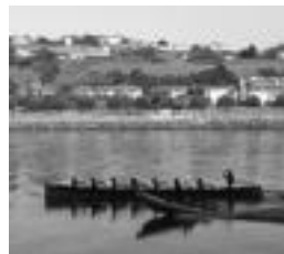
TAKekoak entrenatzen Orion.

TAKekoez gainera, Hondarribia, Zumaia-Getaria, Bizkaiaiko Arkote, Kantabriako Astillero, Galiziaiko selekzioa eta Kataluniako bi traineru ariko dira. Azken Gipuzkoako Txapelketan tolosarrak hirugarren geratu ziren 30. segundorako, eta Euskadiko Txapelketan ere postu horretan amaitu zuten.