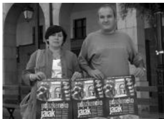
Irudian, Alde Zaharra Dendak eta Ezpeleta elkarteetako lehendakariak. HITZA

Tolosan eraikitzen ari den kolektoreak hirigune osoa zeharkatuko du bizkarrezur baten modura eta aldi berean, kolektoreari iritsiko diren adarrak ere eraikitzen ari dira, etorkizunean, hiriguneko hondakin-urez gain, industriaguneetako nahiz Ibarra urak ere jaso ditzen. Bestalde, zenbait puntu estrategikotan gainezkabideak eraikitzen ari dira, eurrite handiak izatekotan uholde-arriskua murrizteko. Esate baterako, Berazubi inguruan eraikitzen ari direna.