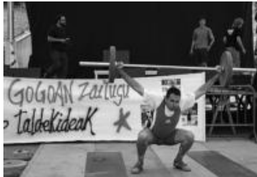
Pasa den larunbateko saioaren une bat.