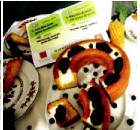
Txoko Tabernak, Gaztañaga Tabernak, Sagasti Jatetxeak, Musunzar Jatetxeak, Beatrizenea Tabernak eta Peritza Tabernak taloarekin egindako plateren erakusketan parte hartu zuten.