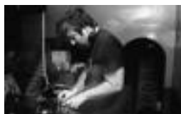
Ezker-eskuin eta goitik behera, etzi Bonberenean ariko direnak: Borrokan, Kerobia, Zea Mays, Sorkun eta Vicepresidentes, Anestesia eta Makala DJ. HITZA