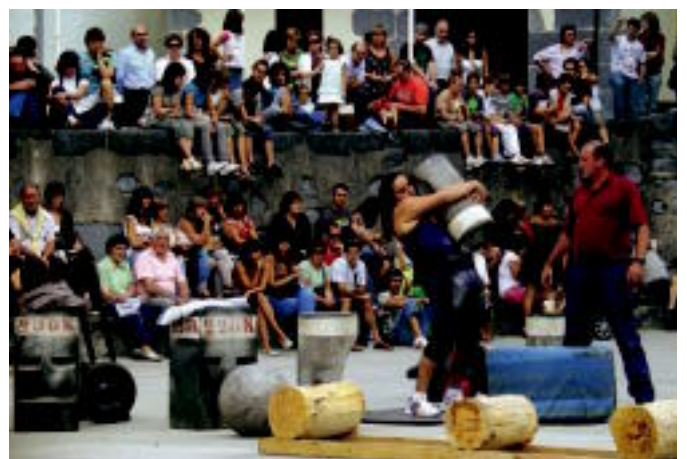
Haurrak esku lanetan eta abereekin gozatzeko aukera izan zuten Taloaren Egunean. Aurrerako dantzarien emanaldia eta herri kirol erakustaldiak eman zioten amaiera jaiari. HITZA