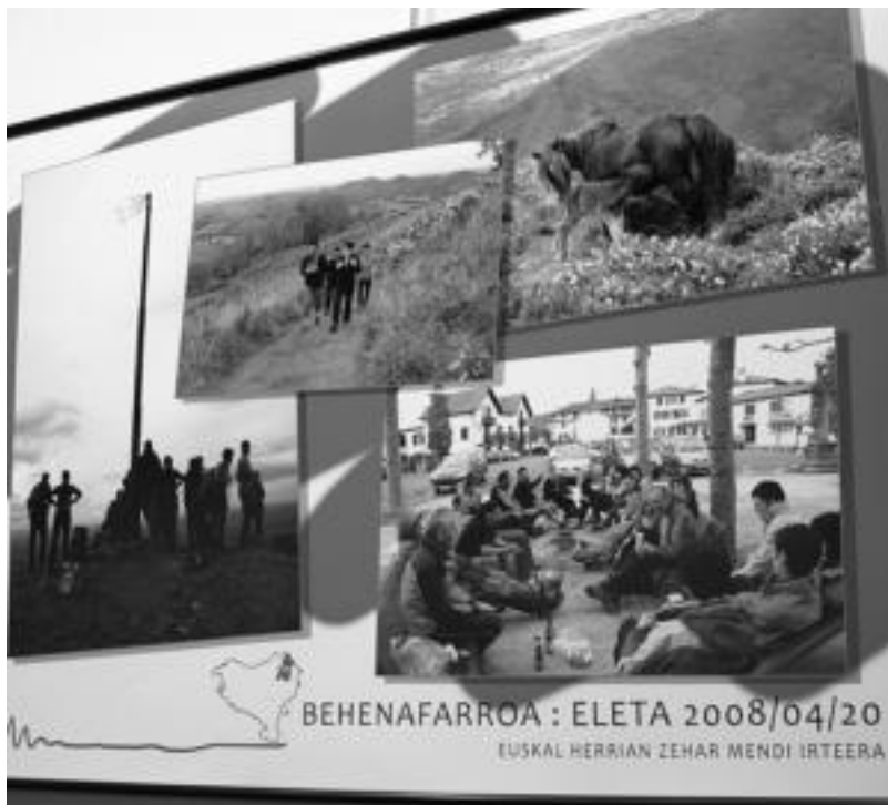
BEHENAFARROA : ELETA 2008/04/20 EUSKAL HERRIAN ZEHAR MENDI IRTEERA