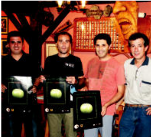
Irrintziko zenbait bazkide Elikagaien Azoka Berezia antolatzen. I. GARCIA

Azokako hiru postu onenek sariak eskuratuko dituzte, 180 euro, 120 euro eta 90 euro, hain zuzen, eta oroigarria ere, gutzia Udaleren eskutik. Azokaren ondoren postua jarriko duten guztiak bazkaltzera