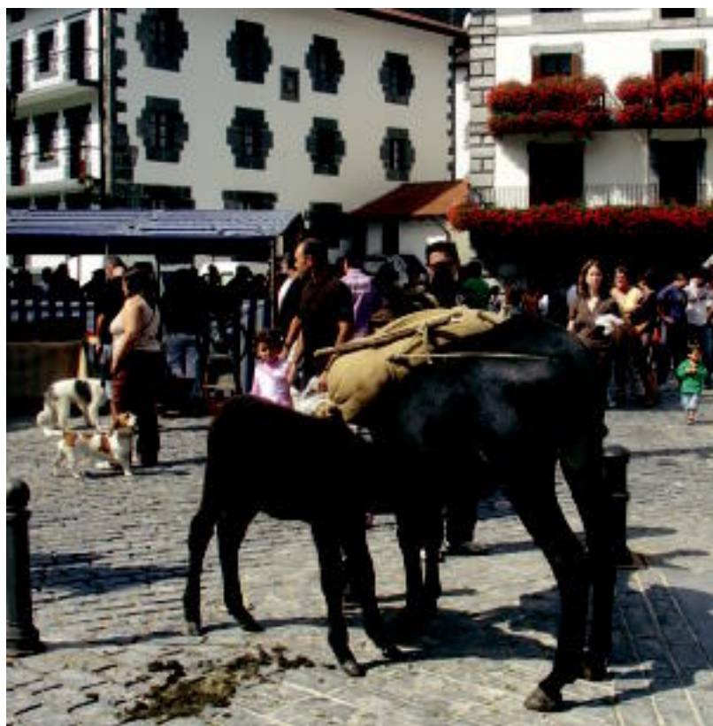
Jende ugari hurbildu zen pasa den igandean Leitzara; Partzuergotik «gustura» azaldu dira. HITZA

HELBURUA Tolosan emakumezkoen eraginari buruzko datu berriak kaleratzea eta daudenak sakontzea da z