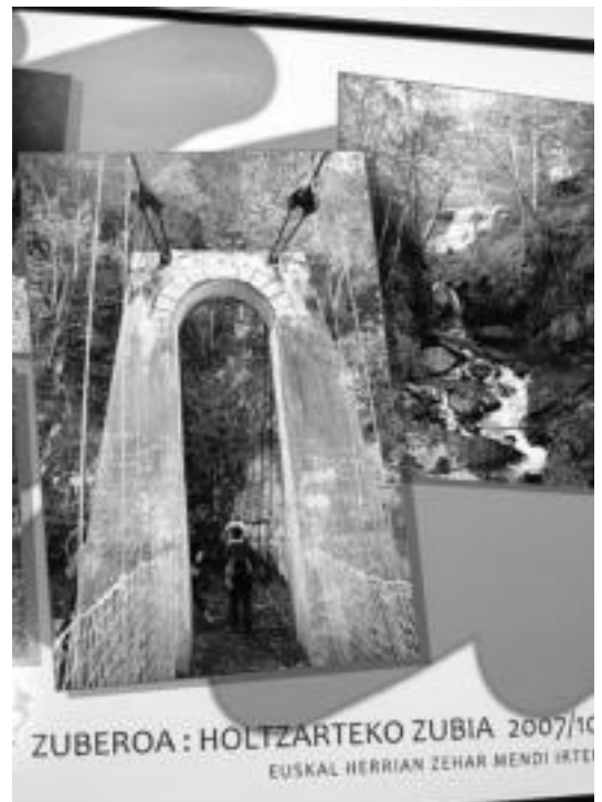
ZUBEROA : HOLTZARTEKO ZUBIA 2007/10 EUSKAL HERRIAN ZEHAR MENDI IRTEERA

Pasa den ikasturtean egindako zazpi mendi irteeretako argazkiak biltzen dituzten 26 panel jarri dituzte ikusgai Ibarra Kultur Etxean. R. CALVO