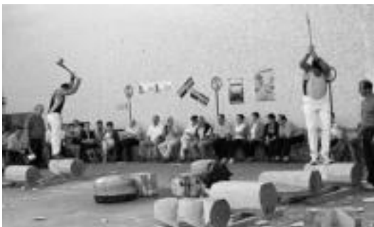
Bedaio. Herri kirolak izan ziren herenegun: aizkolariak eta Irigoien. HITZA

Jaiak » Eskualdeko hainbat herritan izan dira azken asteburu luzean jaiak: Bedaion, Elduainen, Tolosako Izaskun auzoan, Lizartzan, Alkizan eta Zizurkilen; azken herri honetan ere gaur egongo da ekitaldirik eta asteburuan jarraipena izango dute.