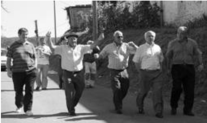
Bedaio. Atzo, meza entzuetik Artubi elkarterako bidea trikitixa doinuekin egin zuten. N. URBIZU