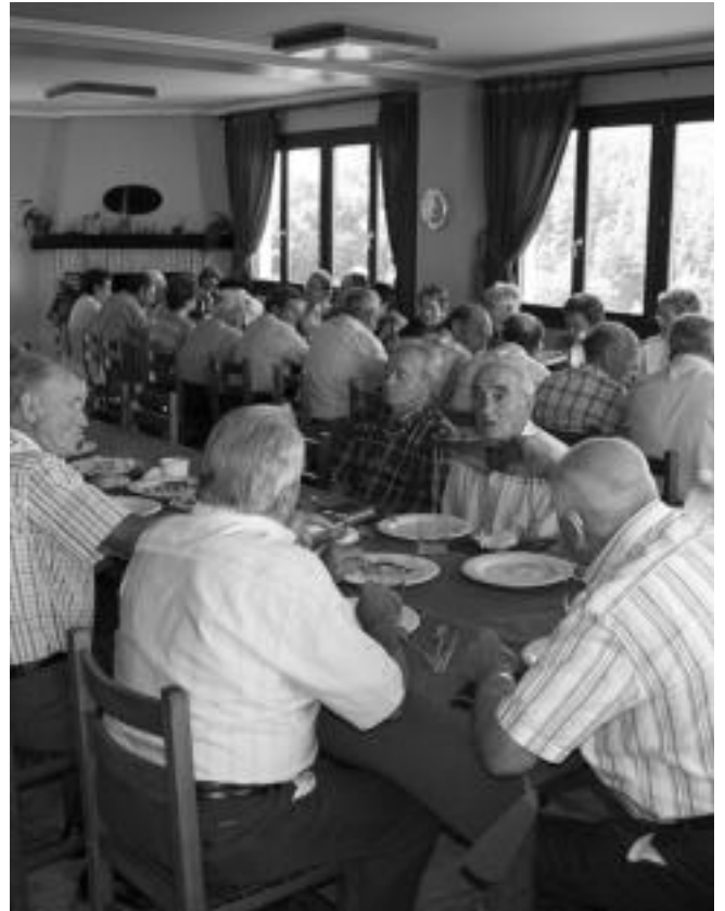
Alkiza. Jubilatuei urteroko bazkaria eskaini zien Udalak atzo, jaien baitan. I. GARCIA