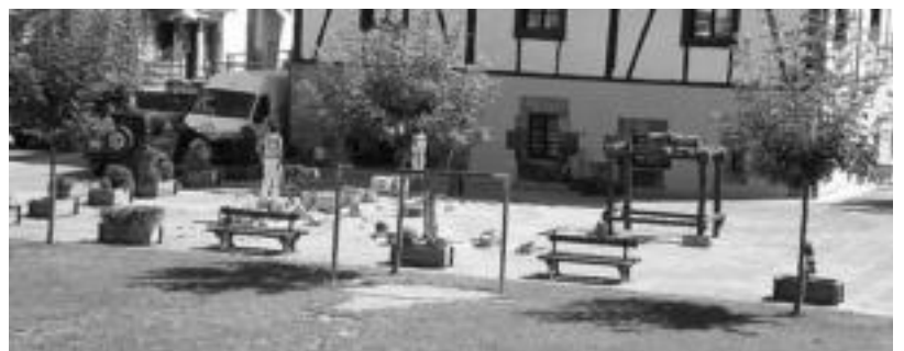
Lizartza. Udalak antolatutako herri kirola ez zen herritarrik agertu. HITZA