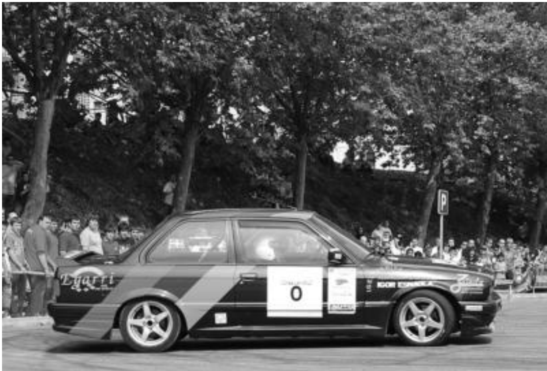
Iaz egin zen lehenengoz Autoen Zizurkilgo I. Slaloma. Irudian, probaren une bat. HITZA