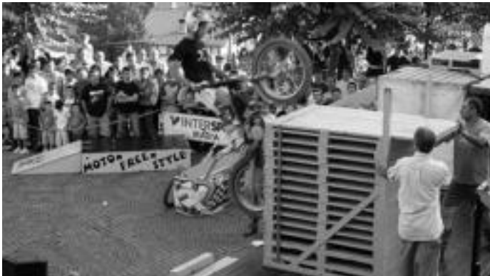
Elduain. Trial erakustaldia ikusteko aukera izan zuten herenegun. HITZA