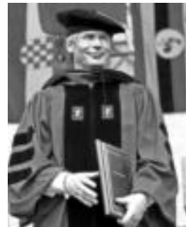
Baltasar Garzon epailea.

EA eta Aralar alderdien inguruan, «EAJ-PNVk idatzitako gidoia puntuz puntu jarraitzea eta EAJri hauteskunde kanpaina erraztea» leporatu diete.