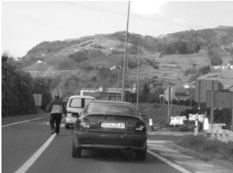
Banatu den lehen liburuxka garraioaren ingurukoa izango da. HITZA

Programa honen bitartez, ingurumena hobetzeko aholku praktikoak biltzen dituzten lau eskuliburu jasoko dituzte eskatzaileak. Hilean bat. Lehendabizikoa datorren astelehenean bertan izango dute,