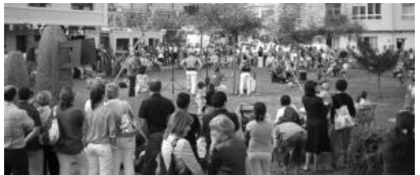
Lizartza. Herritarrek antolatutako herri kirolean jende ugari izan zen. HITZA