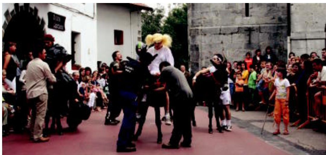
Alkizan asto lasterketa herrikoia egin zuten herenegun; partaide guztiak moztarotuta jarri ziren astoen gainean. Barreak izan ziren nagusi ekitaldi honetan. A.O.

ATSEDENALDIA Urriari atsedena hartuko du elduaindarrak; «partida asko jokatu ditut, eta lasaitzeko unea iritsi zait»