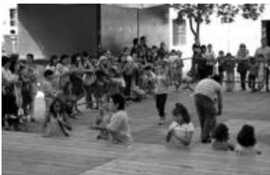
Zizurkil. Haurrek jolasak egiteko aukera izan zuten herenegun. ANDER OTEZABAL