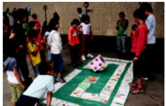
Bedaio. Jende ugari bildu zen atzo, eta giro paregabea izan zen Bedaion. Bertan malabareekin lotutako jokuetan parte hartzeko aukera izan zuten auzotarrek. Izan ere, Amalur taldekoek hainbat tresna eraman zituzten jendearen abileziak erakusteko. N. URBIZU