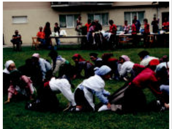
Lizartzan Otsolar dantza taldekoek egin zuten emanaldia.