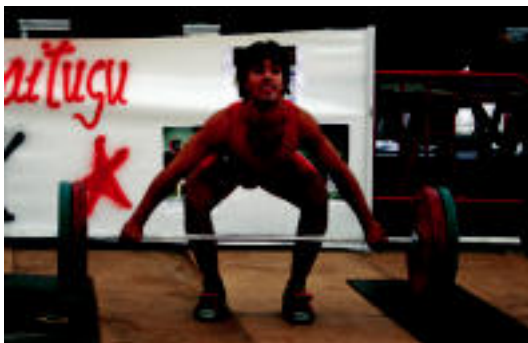
Zizurkil. Eguneko ekitaldien baitan, atzo arratsaldean, Halterofiliako Elbarrena Trofeoa jokatu zen. Bertan Zizurkilgo Danena Olaederra taldekoek hartu zuten parte. Jende ugari bildu zen bertan, herritarrek animatzeko asmoz. E. EZEIZA