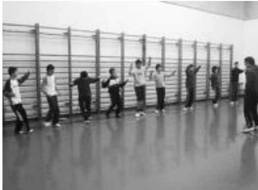
Uztailen hasi ziren entseatzeko eta hau izan zen lehen eguna. N. GARCIA

Bai, aspalditik dantzatzeko delako San Tiburtzio egunean, 1900. urteko aurrera. Festari hasiera ematen dion ekitaldia da, eta Leitzako jatorria izan ez arren, orain hemen gaur egun guk dantzatzeko dugun bezala, nik uste dut Euskal Herrian ez dela inon ez dantzatzeko.