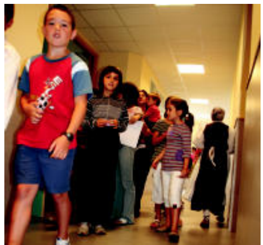
Herritarrek eraikina ezagutzeko aukera izan zuten inaugurazioan. N. URBIZU