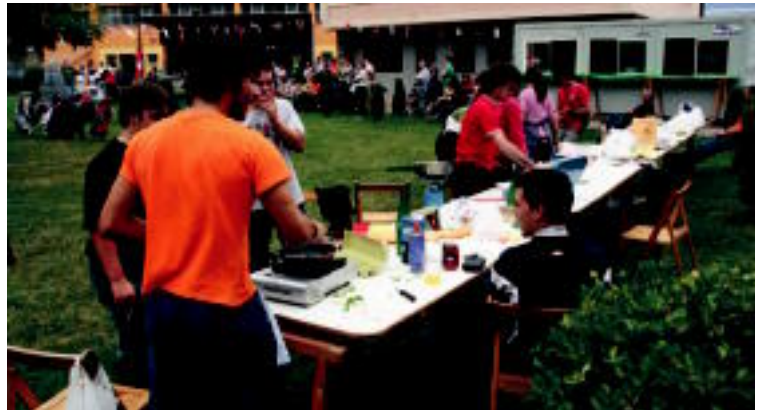
Lizartza. Ikasturtean zehar prestatutako dantzak jendaurrean erakutsi zituzten atzo Lizartzan, herritarrek prestatutako egitarauaren baitan. Bitartean, beste zenbait lagun zartagia eskuan hartu eta patata tortilla sukaldatzen aritu ziren, zein baino zein, gogo handiagoz. E. EZEIZA