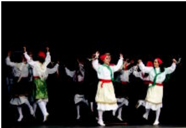
Izaskun auzoa. Heldu nahiz gaztetxoentzako egitaraua prestatu dute aurtengo jaietarako Tolosako auzoan. Atzo goizean, toka txapelketa jokatu zen alde batetik, eta bestetik, Udaberri dantza taldekoen emanaldia izan zen. E. EZEIZA