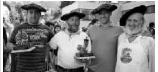
Pasa den urteko lehiaketaren irabazleen irudia.

Izena emateko epea irekita dago dagoeneko, eta irailaren 16an amaituko da. Izena emateko zein informazioa jaso ahal izateko telefono zenbaki bat (943 67 03 99) eta helbide elektronikoa ( ibarrikult@euskalnet.net ) jarri dituzte antolatzaileek.