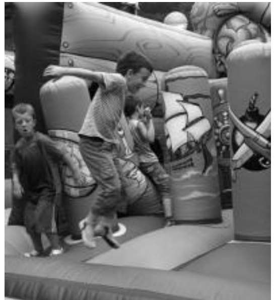
Elduain. Festen hasiera iragartzen zuen suzuria jaurti ondoren, haurrak gaztelu puzgarrietan eta eskulan tailerretan aritu ziren jostatzen. E.EZEIZA