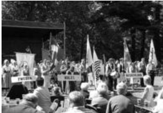
Udaberri Dantza Taldekoek Belgikako jaialdian eskaintako emanaldia. HITZA

Belgikako Sint-Niklaas hirian bi urtez behin antolatzen da Volkskunstweek deritzon folklore jaialdia. Europa osoko talde ezberdinek parte hartzen dute bertan, eta aurtengoa, Udaberrikoekin batera, Belgika, Suedia, Gales eta Alemanian aldeko taldeak ere aritu ziren.