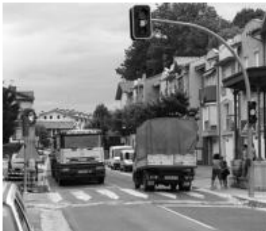
Semaforoak jarrita daude eta laster jarriko dituzte martxan.