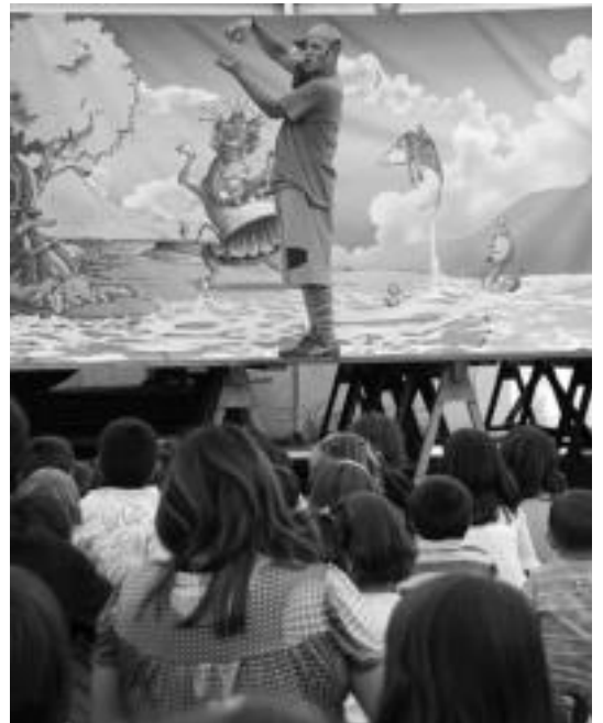
Zizurkil. Inaxito bere zenbakiekin jolasean ibili zen plazan bildutako haurrekin. Gaztekoek ederki igaro zuten jaietako lehen ekitaldiarekin. L.GARCIA