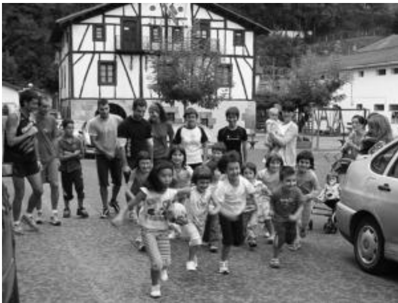
Lizartza. Gaztekoek nahiz helduek hartu zuten parte familiarterko giroan atzo arratsaldean eginiko krosean. Gau aldean, besteak beste, kalejira egin zuten herritarrek, buruhandiek lagundu zieten. L.GARCIA