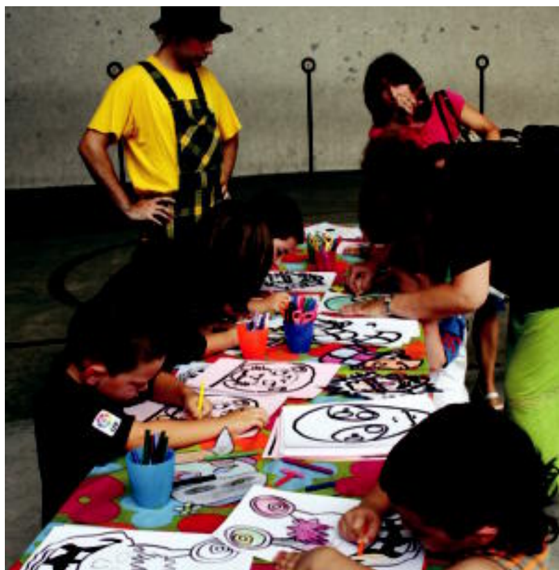
Elduainen atzo arratsaldean, suziria bota ostean, gaztetxoek pintura eta pinak egiteko tailerra izan zuten.

BERRIKUNTZA Bi eskualdeen arteko elkarlana izango da funtsa; lau kanpaina izango dira urte osoan banaturik 4