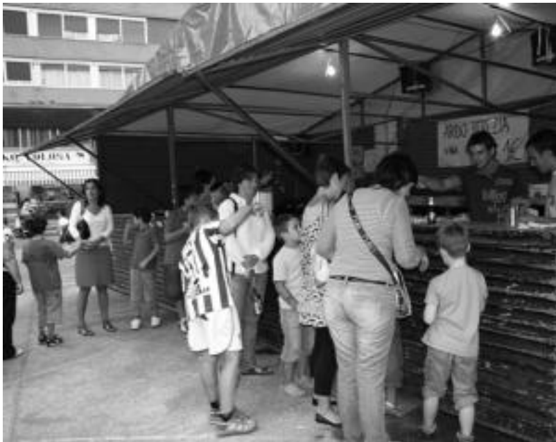
Izaskun auzoa. Arratsaldean hasi zen festa giroa Tolosako auzoan. Bertan, haur nahiz helduentzako txokolatea eta bizkotxoak banatu zituzten. Ondoren, buruhandiak aritu ziren maskuriak astintzen haurrei korri eginaraziz. E.EZEIZA