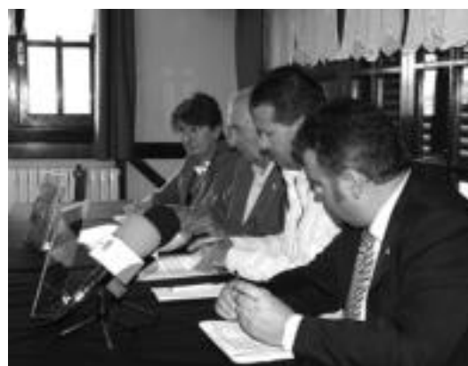
Tolosaldearen eta Goierriren arteko hitzarmena sinatzeko unea. N. U.