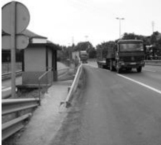
Egingo autobus geltokia N-1 errepidearen ondo-ondoan dago. I. GARCIA

Laskibarrekoa ez da moldatuko Irurako Udalak, behin proiektua martxan jarrita, Laskibarreko geltokiaren kokapena hobetzea nahi