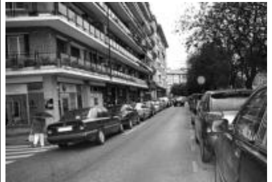
Zumalakarregi kalea trafikoarentzako itxita egongo laster. E. EZEIZA

«Zalantzarik gabe motibazio iturri bikaina izan da bidaia hau» Udaberriko partaideentzat, eta «horrelako beste bidaia bat antolatzeko irrikaz» daude. Momentuz, gaur, 12:30ean, Izaskun auzoko festetan ikusi ahal izango dituzte tolosarrek. Bestetik, hilaren 28an Uharte-Arakilen ariko dira eta urriaren 5ean, Irurako Kilometro-ak festan. Egun honetan hiru emanaldi eskainiko dituzte. Orain horietan prestatzen dihartute.