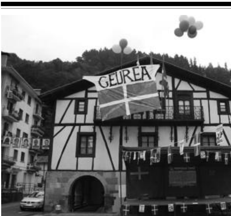
Pasa den urteko irailan Lizartzako udaletxean hartutako irudia. AIMAZ