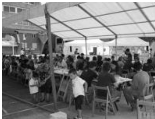
Izaskun auzoko jaiak lehengo urtean ere arrakasta izan zuten. HITZA