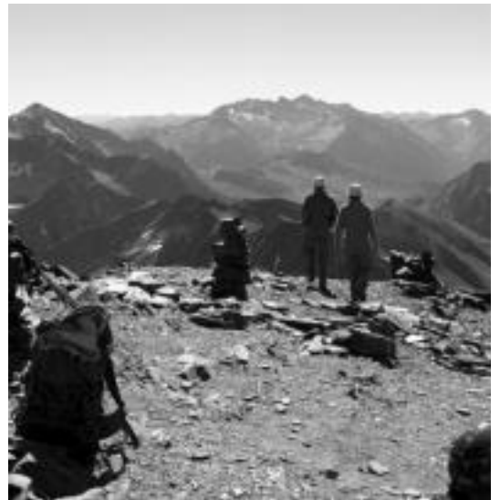
Bachimala mendiko gailurraren irudia. HITZA

Irteera honetarako izena emateko azken eguna etzi da. Horretarako 649 71 71 82 zenbakira deitu behar da 20:00etatik 22:00etara. Prezioa 55 euro da bazkideentzat eta 60 euro bazkide ez direnentzat. 21 urte azpikoek %20ko deskontua izango dute.