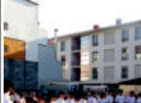
Villabonako Oinkari dantza taldeak sokadantza dantza zuten.

Tolosa » Irailaren 6ra arte bisitatu ahal izango dira konfiteerok eta Linazasorok ateratako argazkiekin erakusketak. Bisita gidatuak Aranburu Jauregiko erakusketen bisita gidatuak. Gorrotxategi Museoa bitan batera egin ahal izango dira ondorengari dagokionez: atelehenetik larunbatera eta 10:00etan edota 16:00etan. Iganbideetan bertiz 10:00etan egungo dute bisita gidatua bertara joan nahi duenaren gazteentzako. Irteerak biten ere 7 eurokoak. Tour turismo bulegok egungo dira, hau da, Santa Maria Plaza, 1 helbiletik. Bisita gidatuen prezioa 1,5 euroko izango da.