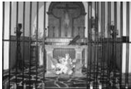
Erromerirako aldea apaindu zuten loreekin. N. GARZIA