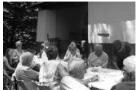
Hagitz gustura bazkaldu zuten ermitaren itzalean. N. GARZIA