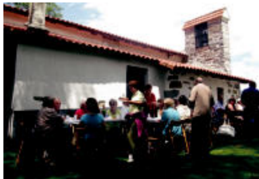
Jubilatu elkarteko kideak bazkaltzen, atzo, ermitaren ondoan.

AIZKORA Zizurkildarrak eta ibartarrak II. Mailako Gipuzkoako Txapelketa dute jokoan 6