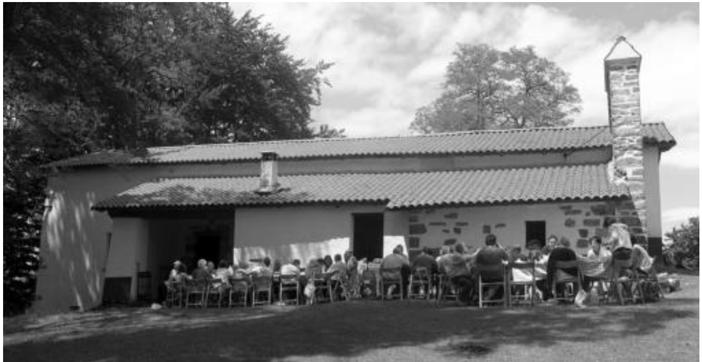
40 lagun inguru elkartu ziren atzo Santa Krutzen eta bazkaldu ondoren bertan igaro zuten arratsaldea, herrira 18:00ak aldera jaitsi zirelarik. N. GARZIA