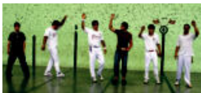
170 korrikariak irten ziren Herri Krosan. Amasako pilotalekuan jokatu zituzten, palaz eta eskuz...