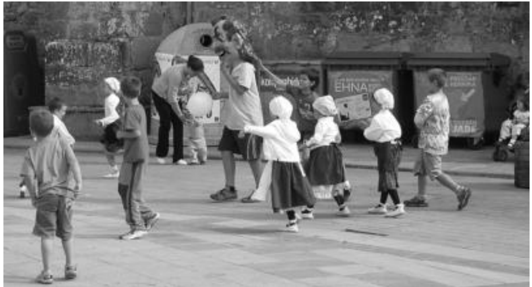
Herriko jaietan oso ohikoak izaten dira buru handiak. Baita dantzari txikiak ere. N. URBIZU