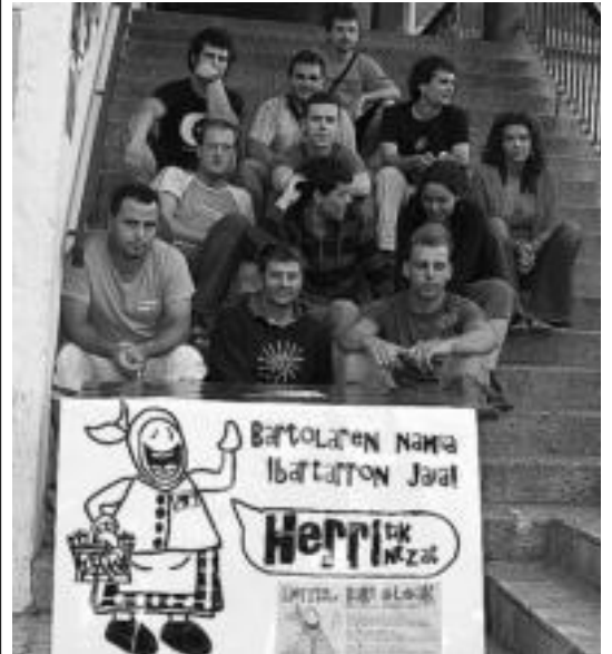
Ibartarrak leitzarren zain Ibarako Gaztetxearen aintzinean. A. IMAZ