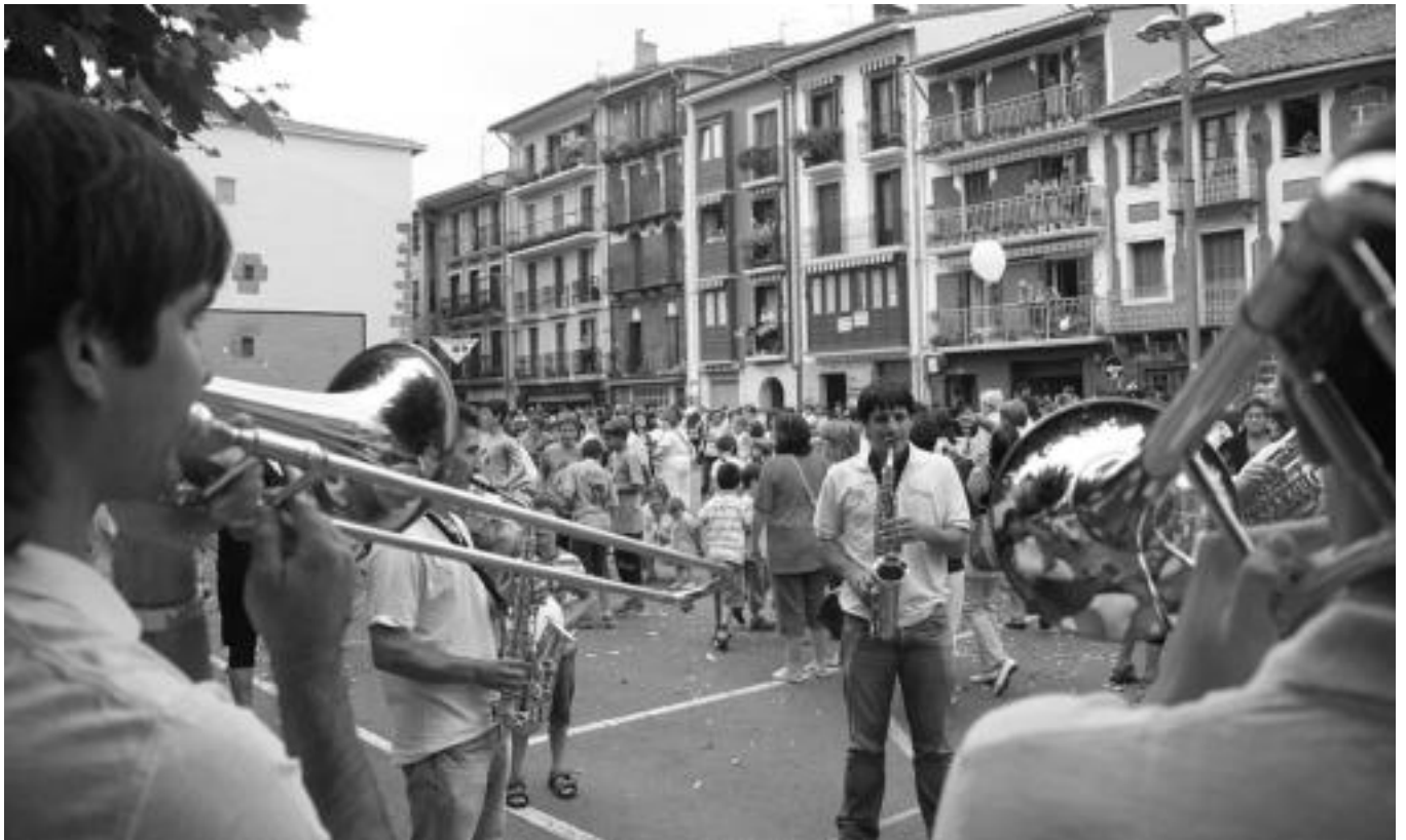
Txarangaren musikak alaitu zuen txupinazoaren ueña. Ondoren, kalejiran abiatu ziren herrian zehar. I. GARCIA