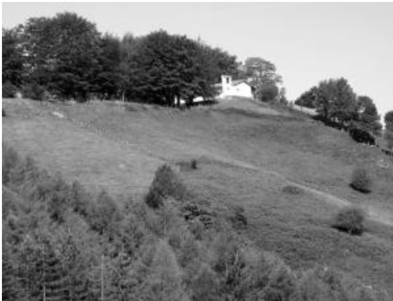
Erromeria honetaz gain urtean bitan igotzen dira erromesak Santa Krutzera, maiatzean eta irailean. J. ASTIBIA