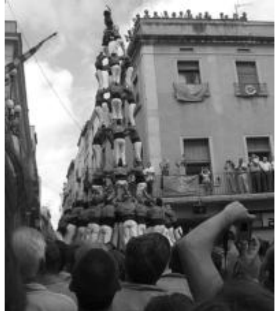
Colla Vella castells taldekoak emanaldi batean. HITZA

Plaza erdian, sagardo eta pintxo dastaketa dagoen bitarten hasiko dira gazteluak eraikitzen. «Jendearen tartean sartzen dira, eta bat batean egiten dituzte, oso ikusgarria izaten da; pentsa, agian udal-txearen gainetik ere jarriko dira gaztelu osoa eraikitzean; gainera, ikusita azken solairura 6-7 urteko haurrak igotzen direla, benetan ikusgarria izaten da». Antolatzaile festez zerbaitekin oroitu bada Colla Vella castells taldekoen emana-