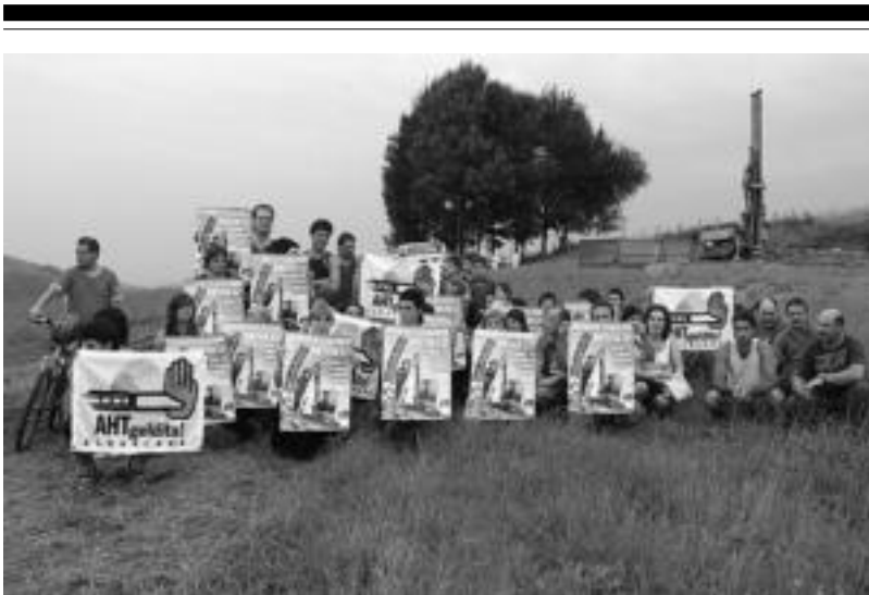
Tolosaldeko AHT Gelditu! Elkarlanako kideak Zizurkil proiektuaren zundaketa lanen eremuan. IMANOL GARCIA