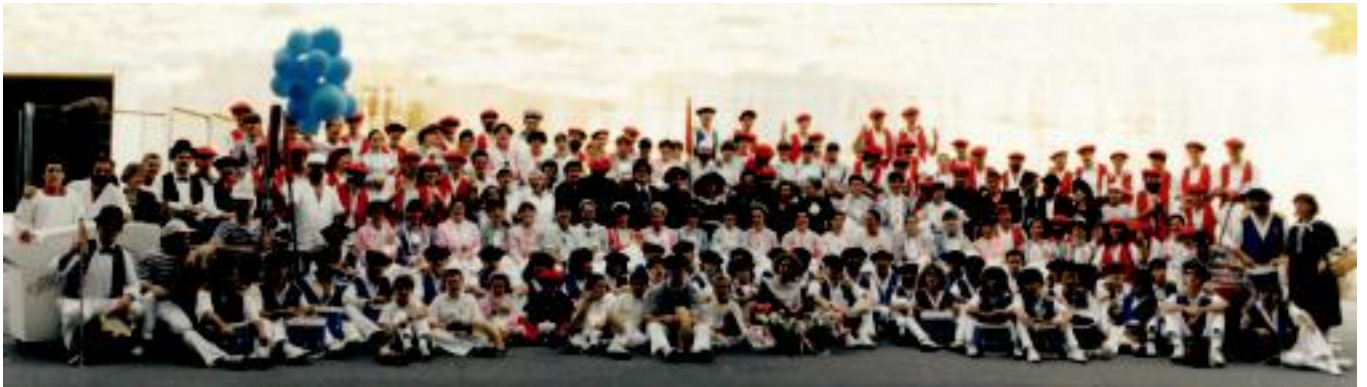
Villabonan egin zen lehendabiziko konpartsan, duela 16 urte, atera ziren herritarrak. HITZA

Inude eta artzaien konpartsa » 5 urte eta gero, ekitaldi berezi hau berreskuratu dute, Oinkari dantza taldeak bultzatuta.