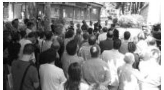
Aurreko urte batean egindako omenaldiaren une bat.