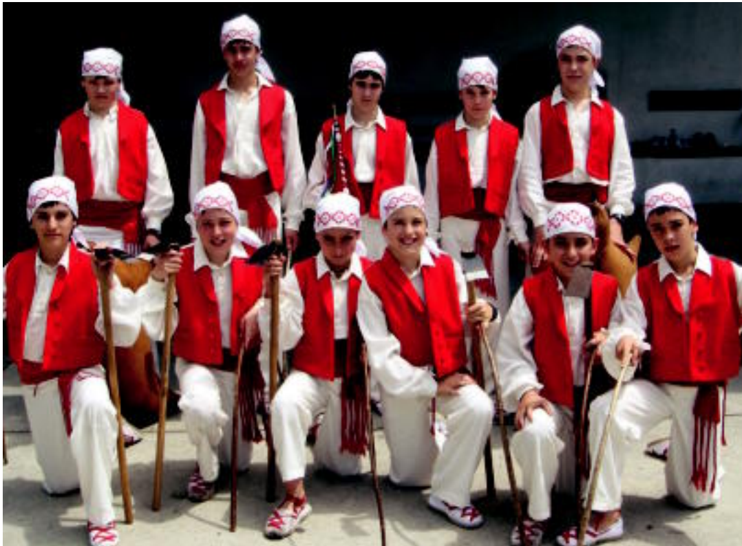
144 dantzari, 40 lagun danborradan, 3 txistulari, txaranga eta pertsonaiak aterako dira kalera. HITZA

Honi guztiari lotuta hiru txistulari eta txaranga ere ariko dira.