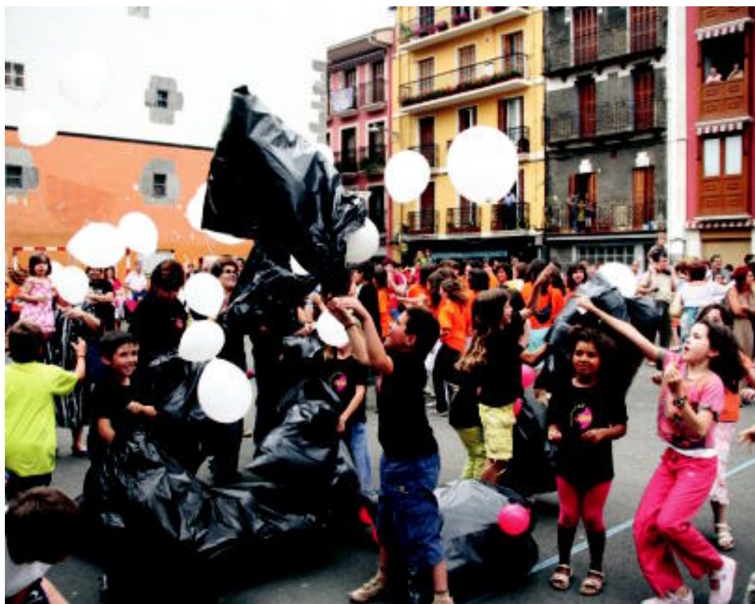
Txupinazoarekin batera, Hutsunea Betez taldeko kideek globo txuri eta gorriak askatu zituzten. I. GARCIA

EGITARAU Zortzi egunez festak ez du etenik izango; Gazte Eguna eta preso eta errefuxiatuen gaua, gaur 2-3