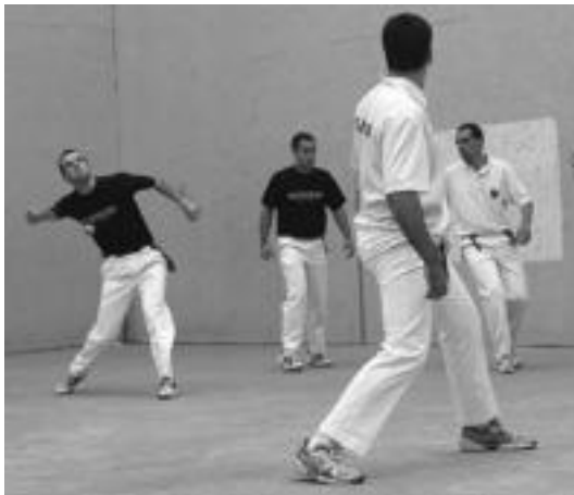
Eskuz binakako txapelketa herrikoaren finalaren une bat. I. GARCIA