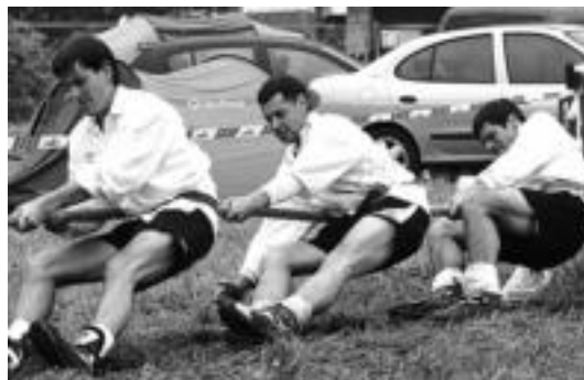
Aresoko taldea, Lesakan jokaturako 600 kilotako jardunaldian.

Joan den asteburuko norgehiagoka eta gero, Goiherri lehenengo doa 4 punturekin, Gaztedi biga-