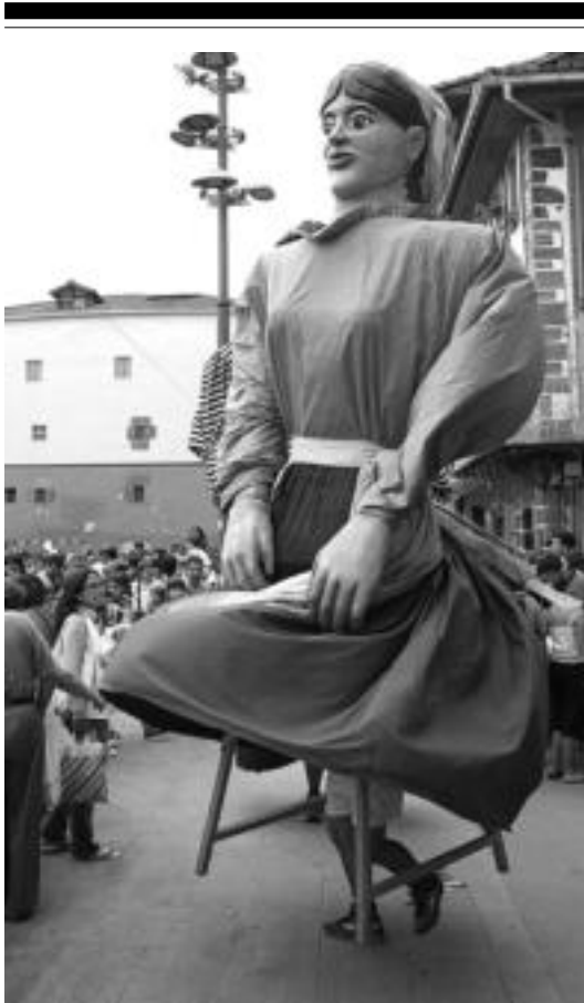
Erraldoiek eta buruhandiek plazatik abiatu zuten kalejira.