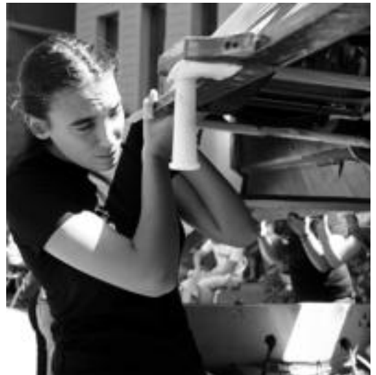
Trainerua denen artean hartu eta buelta eman zioten, jendeari erakusteko. I.T.

Bestalde, lehendabiziko aldiz, Zaragozako Expo 2008a aitzakiatzat hartuz, ACTk (traineruen klubien elkartera) estropadak antolatu