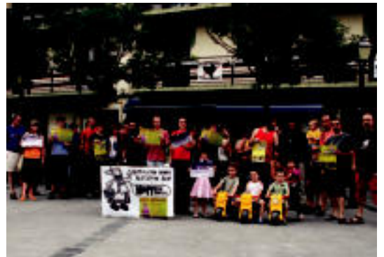
Bartoloen edo Aldarrikapen Ekitaldien aurkezpena atzo Ibarra plaza. A.I.