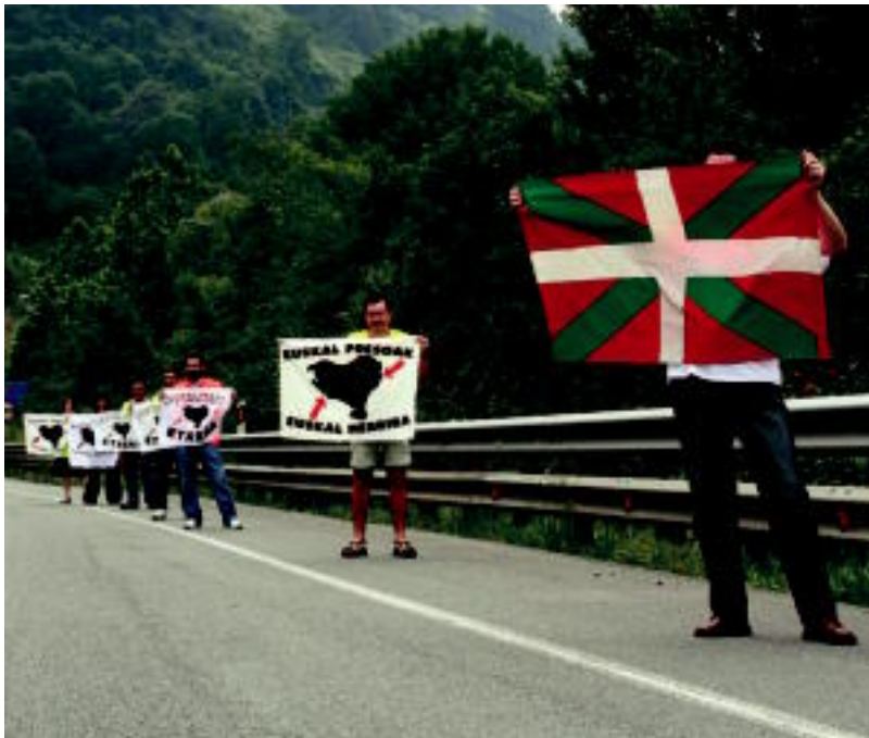
Abuztuaren 2an errepideetan ekimenak egingo dira preso eta iheslariaren eskubideen alde Etxerategi deituta. N. URBIZU