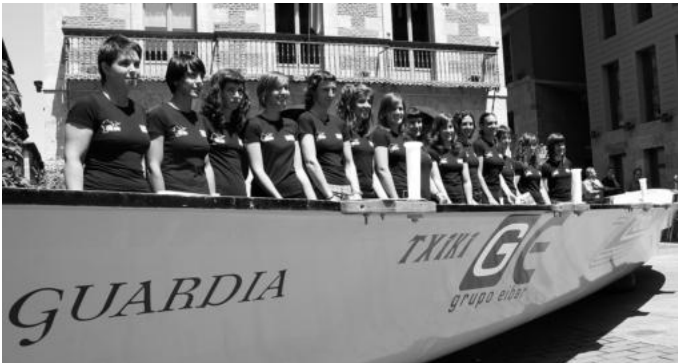
Tolosako udaletxearen aurrealdean egin zuten atzo goizean aurkezpen ekitaldia; bertan izan ziren arraunlariak, TAKeko ordezkariak eta Udalekoak. INIGO TERRADILLOS

Arrauna » Atzo aurkeztu zuen TAKek nesken lehendabiziko trainerua; Kontxako uretan, Gipuzkoako Txapelketan hirugarren geratu ziren.