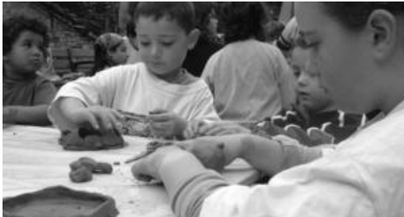
Eskulanak egingo dituzte larunbatean, material ezberdinarekin. Aurretik banatuko dute materiala. HITZA

16:30ean «ipuin kontalari baten bisita jasoko dugu». Ipuin kontala-