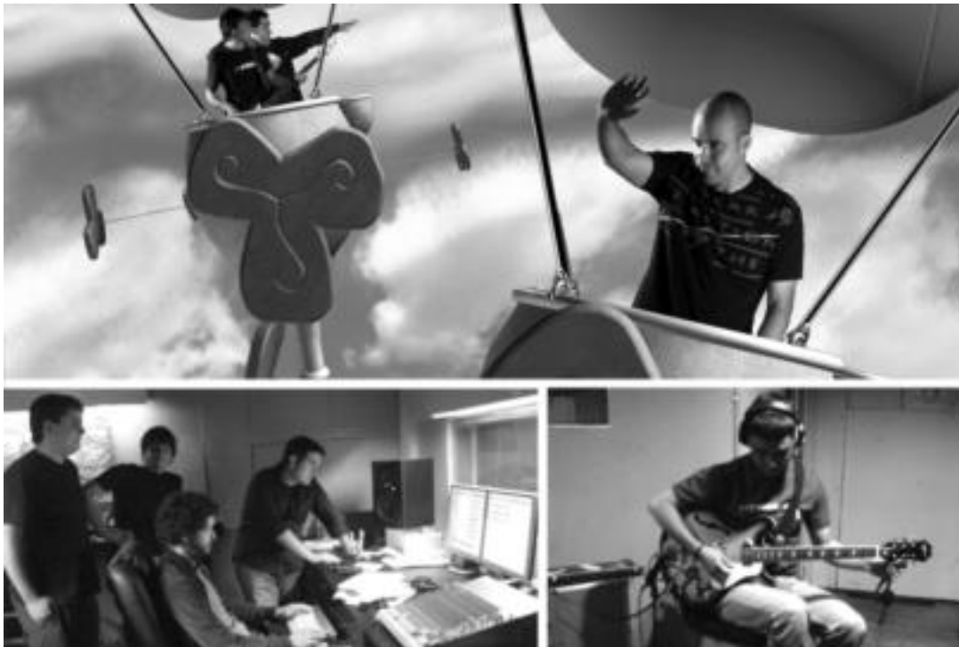
Oinarria eraikitzen abestiaren grabaketako zenbait irudi ikusi daitezke bertan, baita bideo kliparenak ere. HITZA