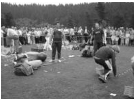
Albizturko gazteak aritu ziren herri kiroletan ere, kixkiak biltzen, adibidez. E.E.

Sardon eta Izeta III.a aritu ziren erakustaldian, eta ondoren aizkolarien txanda iritsi zen. Jarraian, herritarak aritu ziren, korrika batzuk, kixkiekin eta txingekin beste