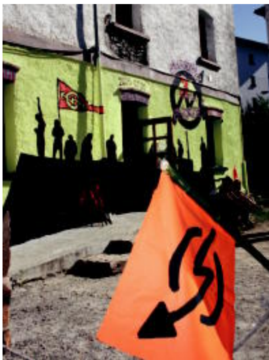
Atekbeltz kolore eta irudi zehatzekin margotzez bukatu dute. N. URBIZU

AHTri buruzko hitzaldi bat ere izan zuten, hasiera batean goizean izan behar zuen baina beranduago izan zen azkenean. Bitartean, txalaparta jotzen, musika entzuten eta dantzatzen jardun ziren leitzarrrak bazkariaren ordura arte.