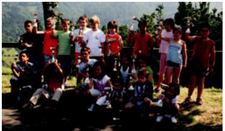
Alegiako Karmen jaietan, besteak beste, sardinak jan zituzten plazan; Asteasuko Santamaña auzoan umeek euren sariekin jolasen ondoren.