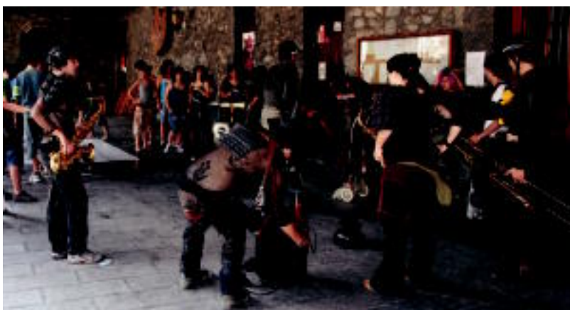
Elektrotuna taldeak arratsalde partean heldu zen Leitza eta giro ederra piztu zuen. N. URBIZU

LEITZA Egun osoan zehar ekitaldi ugari egin zituzten gazteek; herriko jendea izan zen nagusi ospakizunetan baina kanpotarrak ere animatu ziren s