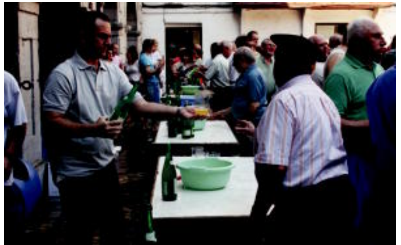
Alegiako Karmen jaietan, edaria ez zen faltatu, sagardo dastaketa egin baitzuten plazan. N. URBIZU