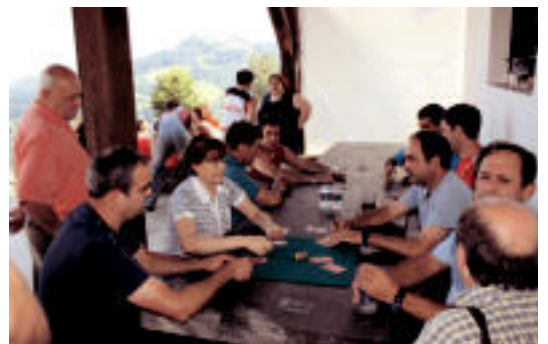
Mahaiairen inguruan eseri ziren musean aritzeko. EZEIZA

Crossing time izeneko emanaldia eskainiko du gaur eguerdian irundar honek. 12:30ean hasiko da kon-