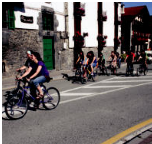
Bizikleta martxa Gaztetxetik hasi eta herri gunerantz joan ziren aurrena. N.U.

Bazkari osteko tertulia ederki luzatu ostean, 18:00ak aldera plaza jokuak egin zituzten, eta 18:30erako Elektrotuna azaldu zen Karrapen, jolasak egiten ari ziren lekuan. Hortaz, jolasteari utzi, eta han aritu ziren gero dantzan Elektrotunaren laguntzaz.