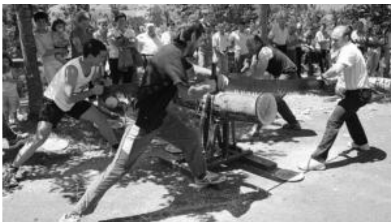
Goian, santamañetako herri kirolen lehia bi taldeetako aizkolariak; behean, trontzalariak lehia bizian. I. GARCIA