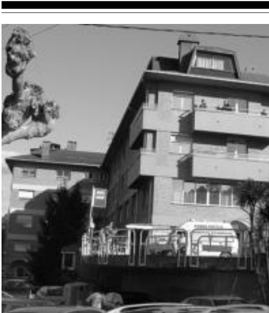
Alde Zaharra igaro gabe joan ahal izango da Asuncionera. E. EZEIZA