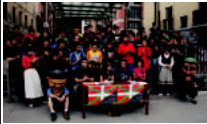
Talde eta norbanako ugari parte hartu zuten prentsaurrekoan. I. GARCIA

Villabona « Ikurrinak Euskal Herri osoa eta euskal gizartearen gehiengo «batzen» duela azaldu dute.