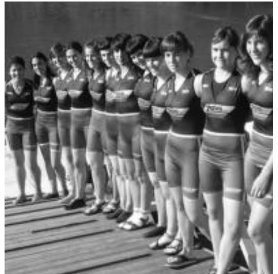
Tolosako Arraun Klubekoek osatutako trainerua.