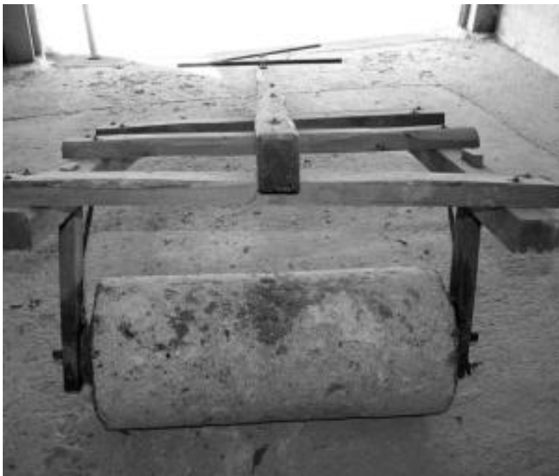
Apusturako alperra Baliarriainen eskatzeko asmoa dute Bartoloen antolatzaileek. ASIER IMAZ