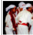
Oinkari Dantza Taldeko gaztetxoak. I. GARCIA

Villabonako Oinkari Dantza Taldeko gaztetxoak Katalunian Totsu herriari inguruko dute asteburua. Bertan ekainean estreinatuko zuten iraganaren gogo emandakia