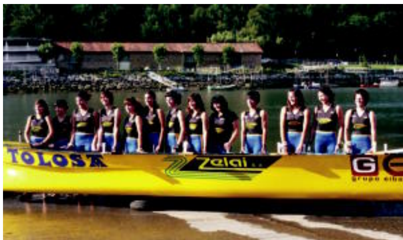
Tolosako Arraun Klubekoek osatu duten trainerua. HITZA