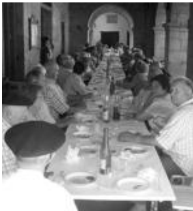
Jubilatuek hamaiketakoan izan zuten eta Gazte Asanbladakoek herri bazkaria egin zuten.