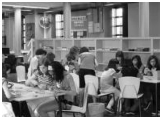
Gauzatu dituzten ekintzen artean, bitxi eta txalaparta tailerra izan dituzte; Arkatxonera ere joan ziren. HITZA