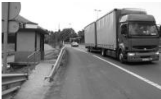
Goitik hasita, Irura eta Anoeta arteko zubia, kale nagusia eta N-1 errepeidean dagoen autobus geltokia. I. GARCIA