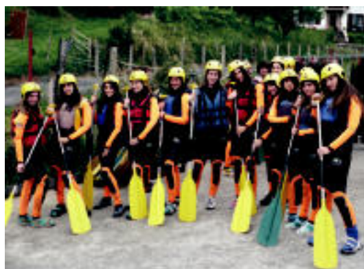
Uda Gazteko ekitaldien baitan urezko parkera ere joan ziren, Frantzian. HITZA

IRURA Tolosako Trianguloan mahaia jarriko dute bihar izena eman ahal izateko 7