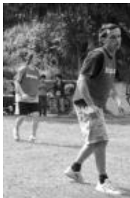
lako txapelketako une bat. A. IMAZ

Hasteko, multzo bakoitzeko taldeen artean ligaxka bat jokatu da, denera 12 partida jokatu di-