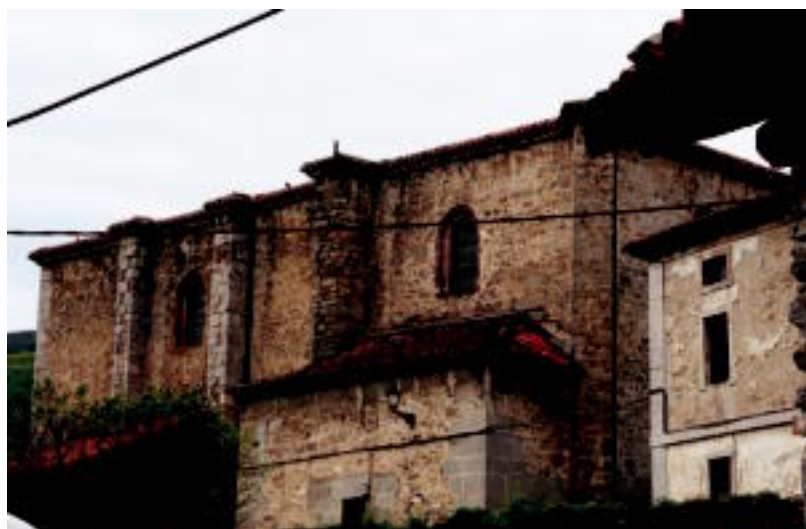
Altzoazpiko Salbatore elizaren ikuspegia. N. URBIZU

PROIEKTUA Foru Aldundiak eta La Caixak aurkeztu dute; finantza erakundeak 211.000 euro xedatuko ditu 6