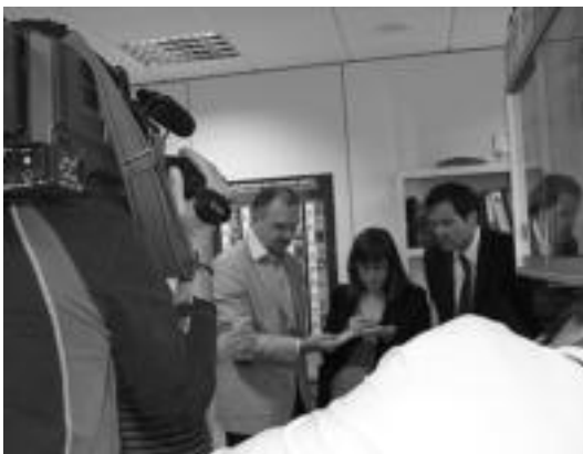
Komunikabideen ikusmina piztu zuen atzoko aurkezpenak. A. IMAZ

La Caixa Gizarte Ekintzaren «karpene ekonomikoari esker» egingo dira instalazio hauek; «datozten urteetan 400.000 euro jarriko ditu fundazio horrek urteko».