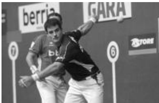
Barriolari ezinhobeto joan zaio San Fermin Torneoan.

Partidak 75 minutuko iraupena izan zuen eta parekatu xamar joan zen arren, Aspeko bikoteak lortu zuen azkenean garaipena, 22-19ko emaitzarekin.