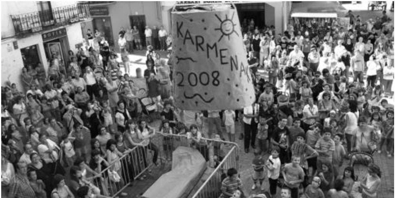
Txintxarriaren udaletxerainoko bidea herritar guztiak begiekin egiten dute urtero. Igandera arte egongo da zintzilik, ikurriñarekin batera. N. URBIZU