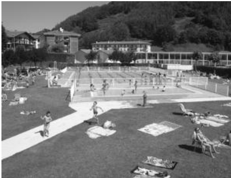
Leitzako igerilekuan ospatuko dituzte bi festak, 'Gozamenez' delakoa ostiralean eta puzgarriena, larunbatean. N. GARZIA

bat ordaindu beharko dute eta edari baterosteko txartela emanen zaie trukean.