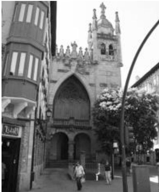
Korazonisten elizak egun duen itxura. N. LATABURU

Adostu bezala, sustatzaileak lokal horiek egokitzearen gastua hartuko du bere gain, beti ere, 300