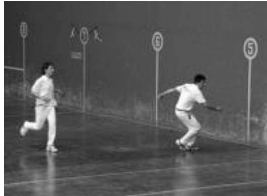
Amezketakoan kontra zaldibiarrek aritu ziren 1950ean, eta egun hartako euli eta arkakusoen arteko bromak ezagunak egin ziren. A. IMAZ

Halako batean, euli bat jarri omen zen alkatearen buruan eta Pernandok ez zuen aukerarik galdu: eman egin zion, eta geroztik al-