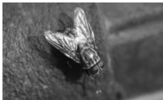
Amezketarrei euli esaten zaie, dirudienek XVIII. mendeaz geroztik. HITZA

Interesatuak deitu 661 67 88 17 telefono zenbakira