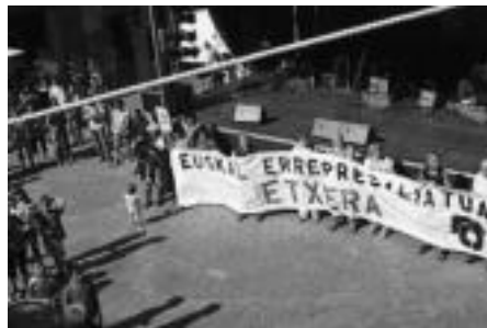
Euskal presoaren aldeko elkarretaratzea egin zuten. N.U.