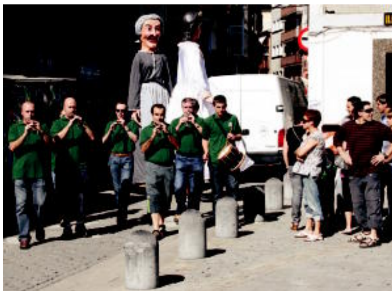
Dultzaineroak doinuak zabalduz eta atzean buruhandiak eta erraldoiak, atzo, Alegiako plazan. N. URBIZU