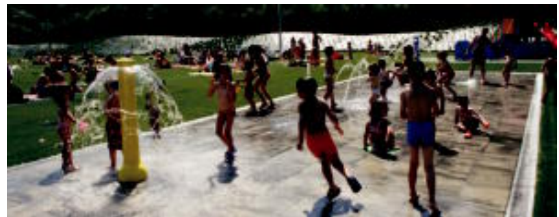
Jendeak gustura hartu du gune berria; atzo beteta zegoen, eguraldi ona zela eta. N. LATABURU