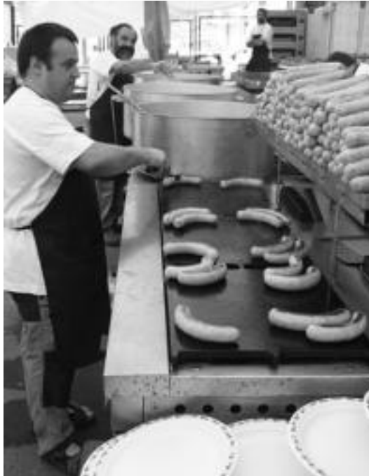
Iazko Garagardo Azokan, Irrintziokoen saltxitxak prestatzen. I. GARCIA

Garagardo azokak asko egiten dira eskualdean garai honetan. Laskurainek ustez, horrelako ekitaldiek arrakasta izateko arrazoia normalean edaten ez diren garagardo mota edaten direla da eta baita zerbitzatzen diren modua ere: «Kañeroak ondo prestatu izaten ditugu eta bere puntuatzen ater-