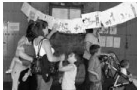
Haurrek eskolan jaiet buruzko marrazkiak egin zituzten. N.U.