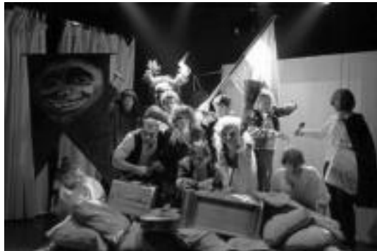
Murtziako Unibertsitateko La Barraca izeneko antzerki taldeak eskainitako emanaldietako baten irudiak dira goian ikusi daitezkeenak. Noche de guerra en el Museo del Prado izena du etzi Leidorren eskainiko duten Rafael Albertiren lanak.