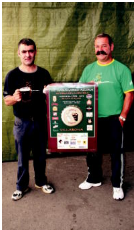
Irrintzi elkarteko kideak egon dira Garagardo Azoka prestatzen. I. GARCIA

ESKAINITZA 22 garagardo mota desberdin dastatzeko aukera izango da, 18:00etatik 01:00etara bitarte 4