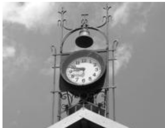
Udaletxeko erloju berria, herenegun jarri ostean.

Udaletxeko ganbaran dagoen makinariak bere erritmoa darma eta orduak behar bezala markatzen ditu, orain transmisioa egitea besterik ez da falta. Orduan, hori