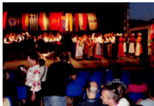
Alurr Dantza Taldeko dantzariak Eslobeniako jaialdian.