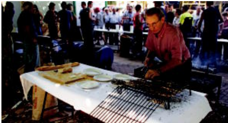
Sagardo dastaketa sardina eta txorizo erreekin ere izango da aurtan, hilaren 19an. Irudian, iazko une batean.