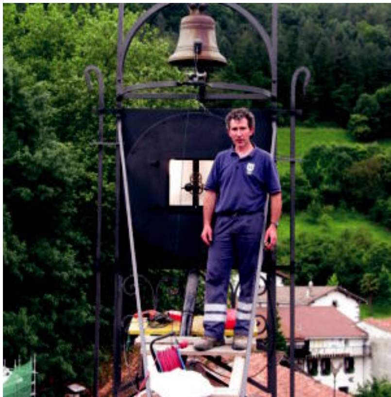
Lazaro Zabala Leitzako udaletxearen teilatuan, herenegun. N. GARZIA