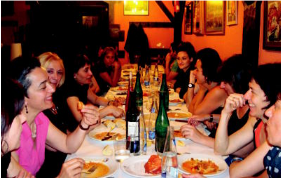
Mintzalaguna egitasmoan eta euskara ikastaroetan parte hartu zutenei bi udalek afaria eskani zieten. HITZA

Villabonako eta Zizurkilgo udalek Mintzalaguna proiektua jarri zuten martxan iragan berri den ikasturtean eta balorazio «ona» egin dute. Guztira 17 ikasleak eta zortzi laguntzaileak parte hartu dute.