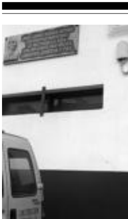
Mujika erail zuten lekua. N. GARZIA