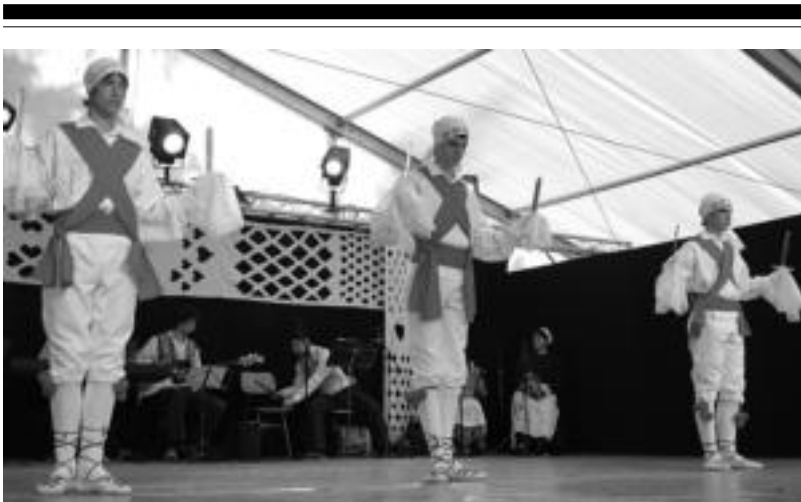
Maribor hirian egin den Lent Festibalean Alurr Dantza Taldeko dantzariak ezpata dantzarako prest. HITZA