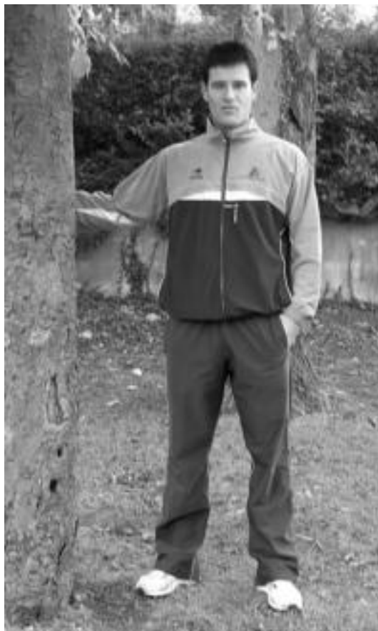
Lau t'erdiko torneoaren ondoren, binakakoan ariko da Barriola. N. GARZIA

Sanferminetako Lau t'erdiko Txapelketak bederatzita urte daromatza pilota munduan, eta guztira 8 txapeldu ezberdin izan ditu,