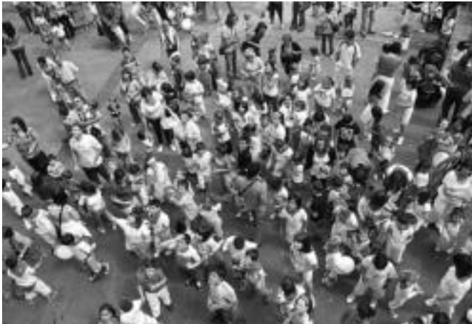
Jende ugari gerturatu zen Tolosako Plaza Berrira, eta gogotsu egon ziren suziariaren zain. I.T.