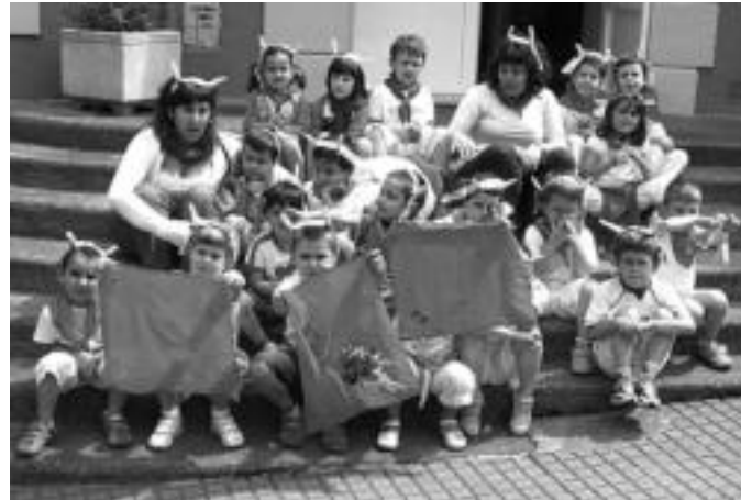
Irurako herritarra San Fermin jaietako osagai guztiekin. I.G.