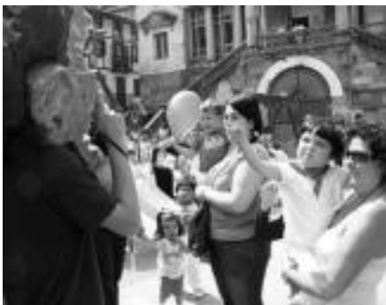
Buruhandiek jolasean aritu ziren gaztetxoek Tolosako Plaza Berrian, batzuk ausart, eta izuturik besteak. I.T.