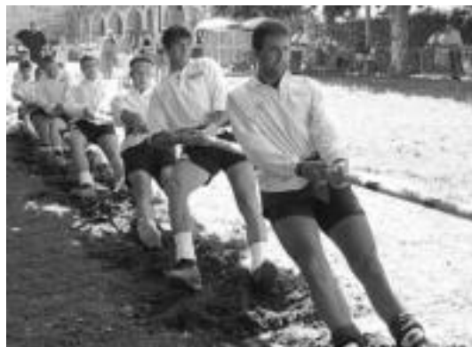
Laugarren gelditu ziren Aresokoak larunbatean, Lesakan. I. ASTIBIA

Goiherrikoek zeukaten soka beren aldera, baina bi faltarekin ziharduten. Azkenean hori izan zen erabakigarria, epaileak hirugarren falta adierazi baitzuen Erandiokei (9 minutu eta 27 segundo). Bigarren tiraldian ere, Goiherriko joku zuten lehen kolpea, eta berak eraman zuen soka (3 minutu eta 21 segundo).