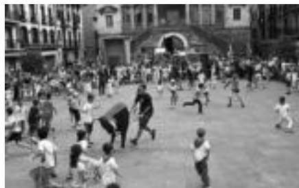
Moyua ganadutegiko zezenekin, entzierro txikia Tolosan. I.T.