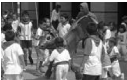
Zezenekin jolasean aritu ziren Laskoraingo ludotekakoak. HITZA