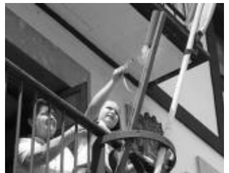
Iruran alkateak eta haurrek bota zuten suziria. I.G.