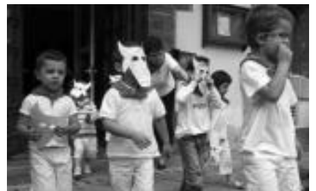
Zezenek mozorrotu ziren Irurako haurrak. I.G.