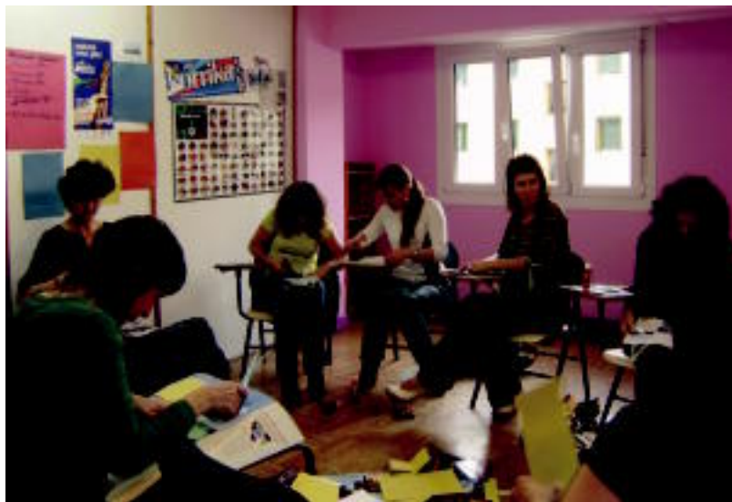
Antzezlanak, dantzak, eskulanak,.... egin dituzte urtean zehar; euskaltegitiko ikasgelan ere euskara landu dute. HITZA