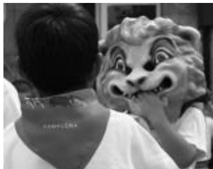
Moyua ganadutegiko zezenekin, entzierro txikia Tolosan. I.T.