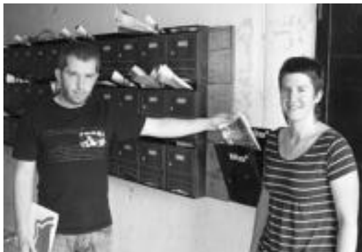
Bost buzoi jarri ditu Udalak HITZAREN aleak uzteko.