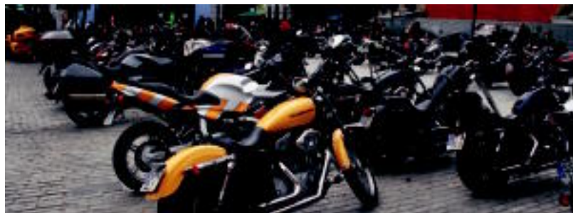
Langostino Moto Festaren lehen eguneko irudiak: gasolinarik behar ez duen motorra, dirurik behar ez duen motogidariarekin. Akanpada gunea eta jolasak. A. IMAZ