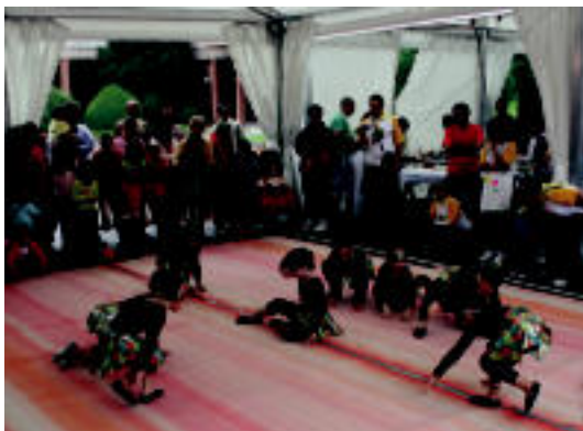
Goian, lurreamendi auzoak; behean, Amaratzen. HITZA/N.URBIZU

Tolosako auzoek ere «gogotik eta ilusioz» ospatu dituzte euren jaiak