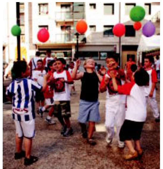
Iurreamendin jai giroko eguna ospatu zuten ostiralean, jadanik 3. urtez. HITZA