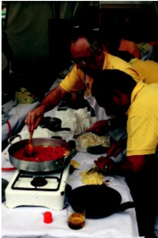
Bakailaoa ajoarriero eraran prestatzen 16 kazola aurkeztu zituzten. N. URBIZU

mendin auzokoen arteko festa bat ospatzen eta ohiturari jarraituz herenegun ekin zioten aurtengoari. Eguraldiak ere lagundu zien eta horrela 18:00etan txupinazoa boiratz piztu zuten jai giroa. Ondoren, Tolosako erraldoi eta buruhandien konpartasako arduradunak egindako zezenekin, entzierroa korritu zuten eta umeek «izugarri» gozatu zuten. Zezen eramaileak nekatutakoan (umeak ez bezala), zezenak gorde eta umeentzako prestatutako jokoein jarraitu zuten festa.