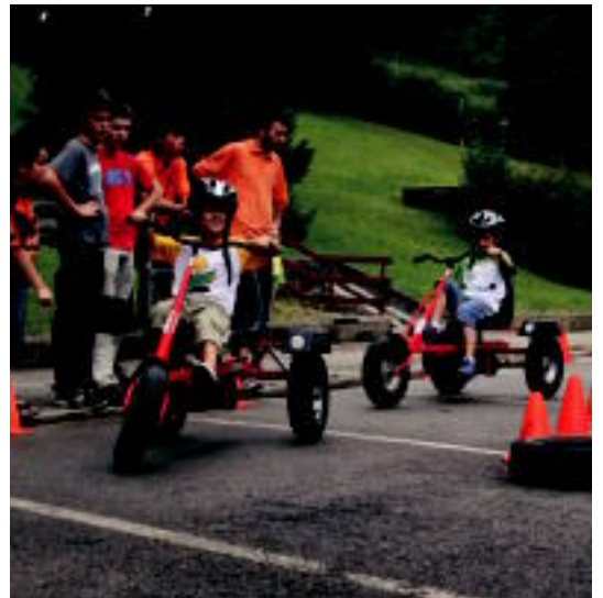
Triziklo erraldoiak izan ziren haur eta gazteentzat Amaratzen. N. URBIZU