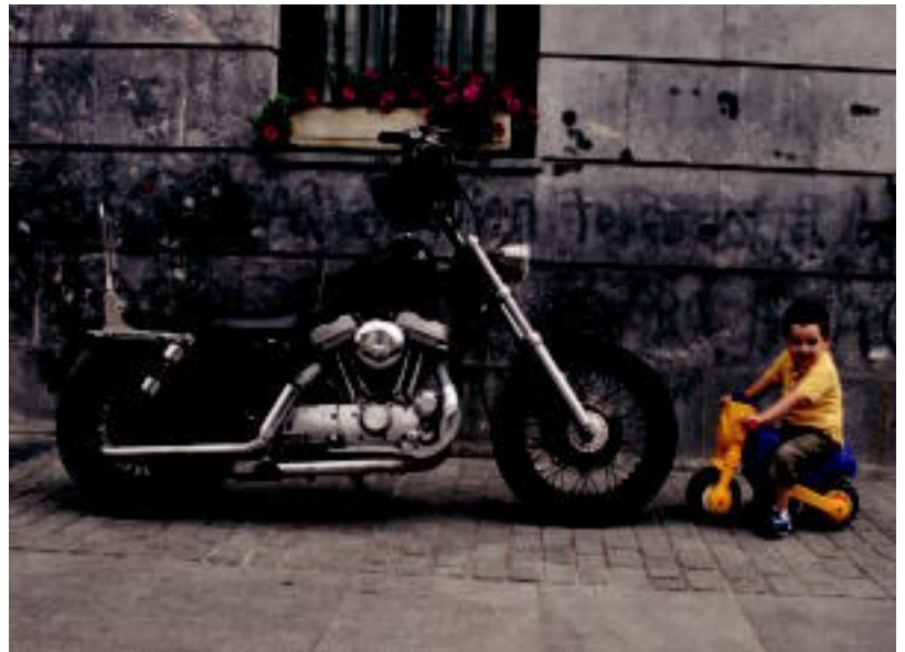
Festan, gasolinarik behar ez duen motorra, dirurik behar ez duen gidariarekin; aurrez aurre moto ikusgarria. AIMAZ

TOLOSA lurreamendin egun bateko jaiak egin zuten; Amaratzen gaur ere izango dute festa 4