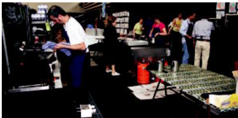
Ikastolako haurren eskulanak saltzeko jarritako postua eta Garagardo Azokaren bigarren eguneko prestaketak. A.I./N.U.