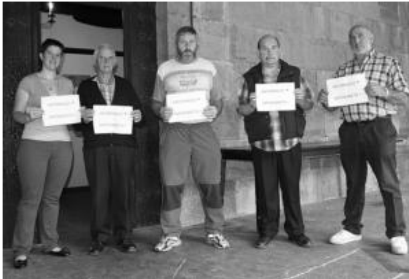
Bileraren ondoren lurjabeek protesta egin zuten informazio ez dutelako jaso. I. GARCIA

Eusko Jaurilaritzatik harremanetan jarri ziren Hernialdeko Udalarekin zundaketekin hasteko asmoa zutelako azalduz eta zundaketa horiek egin behar zituzten lurjabeekin harremanetan jartzeko. Udala lurjabeekin harremanetan jarri zen eta hauek bilerara