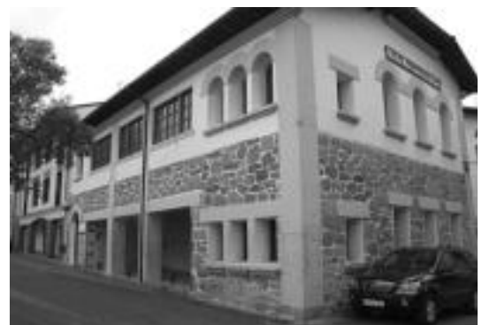
Eskolan aldaketak izango dira datorren ikasturterako. I. GARCIA

gana Anoetara joaten baziren, as-telehenetik aurrera Irurara joan beharko dute.