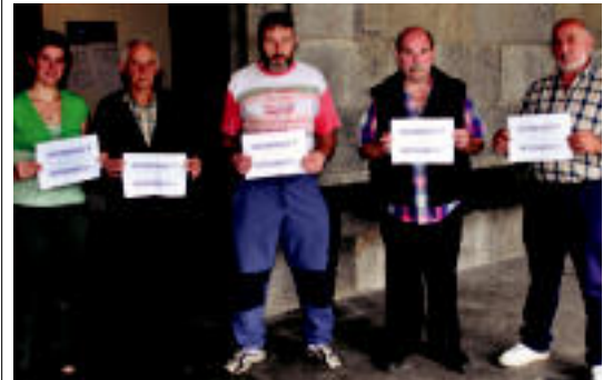
Atzoko bileraren ostean protesta egin zuten lurjabeek. I. GARCIA

TOLOSA Udalak eta herriko bederatzitaubernek egin dute bat aurtengo Gau Giro ekimenarekin 6