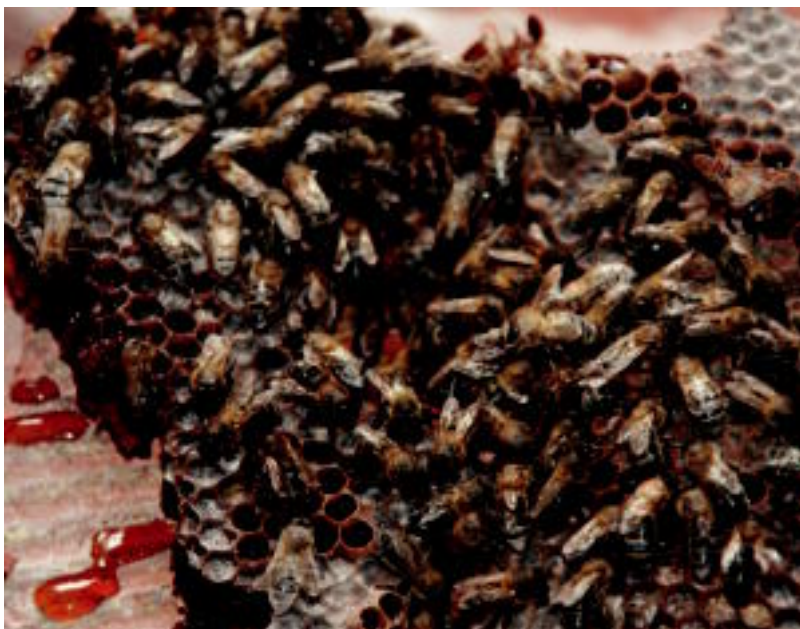
Goian, erlezainak erlauntza ateratzeko prest, atzo, Bidebieta auzoko etxebizitzan. Behean, erleak, erlauntzan. I.T.