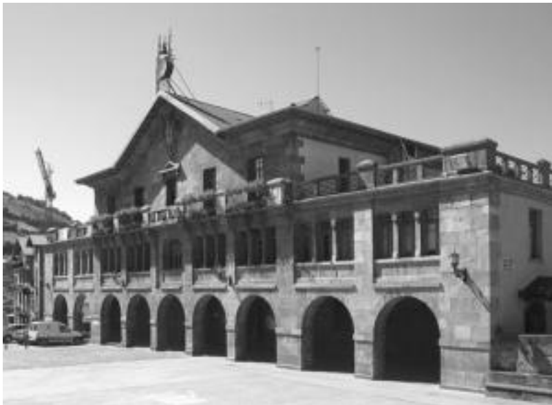
Gai ugari jorratu zituzten Leitzan joan den ostiralean egin zuten osoko bilkuran. N. GARZIA