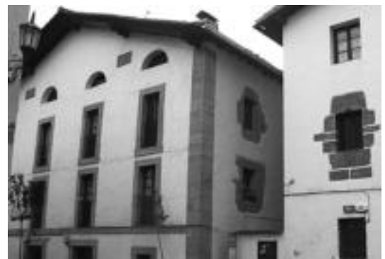
Udaletxearen ondoko maisuaren etxean egingo da zentro soziala. I. GARCIA

Goiko solairuan bi etxebizitza egingo lirateke, herriaren sortzen diren beharretarako erabiltzeko. Lehenengo solairuan gizarte laguntzailearen bulegoa eta gela baliogintza bat sukalde txiki batekin aurreikusten da. Gela hori batez ere adinekoren bilgune izango da. Behe solairuan, gimnasioa eta Osakidetzak onartzeko gero, medikua-erentzako gela bat. Hain justu, Udala ahalaginetan ari da mediku kontsulta herrian izateko. Gainera, orain arte alkizarrak medikua-