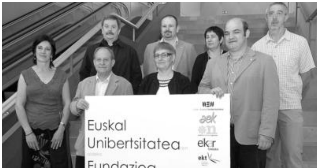
Joan den larunbatean aurkeztu zuten Euskalgintzako hainbat eragile osatutako Euskal Unibertsitatearen aldeko Fundazioa.