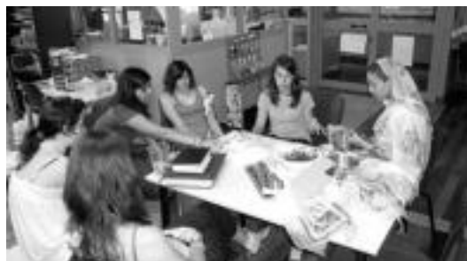
Pasa den urteko udan, Gazte Topagunean eginiko ekintzetako bat. HITZA

Topagunea uztailean zehar asteartetik ostiralera bitartean egongo da zabalik 16:30etik 20:30era, eta ekintza bereziak egongo diren egunetan itxita egongo da. Pixxien