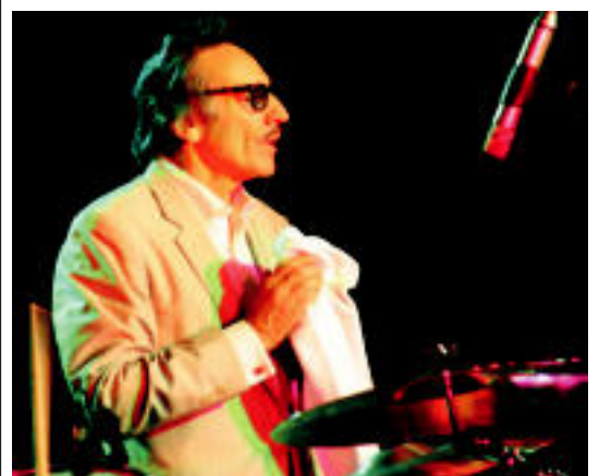
Little Charlie and The Nightcats taldeko abeslaria, Plaza Berrian larunbatean. H.

SEGA Bere buruarengan konfidantza zuela eta entrenatzen ere ondo aritu dela azaldu du 6