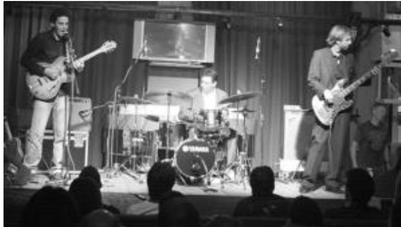
The lazy jumpers taldea Fronton kafetegian, ostiralean.