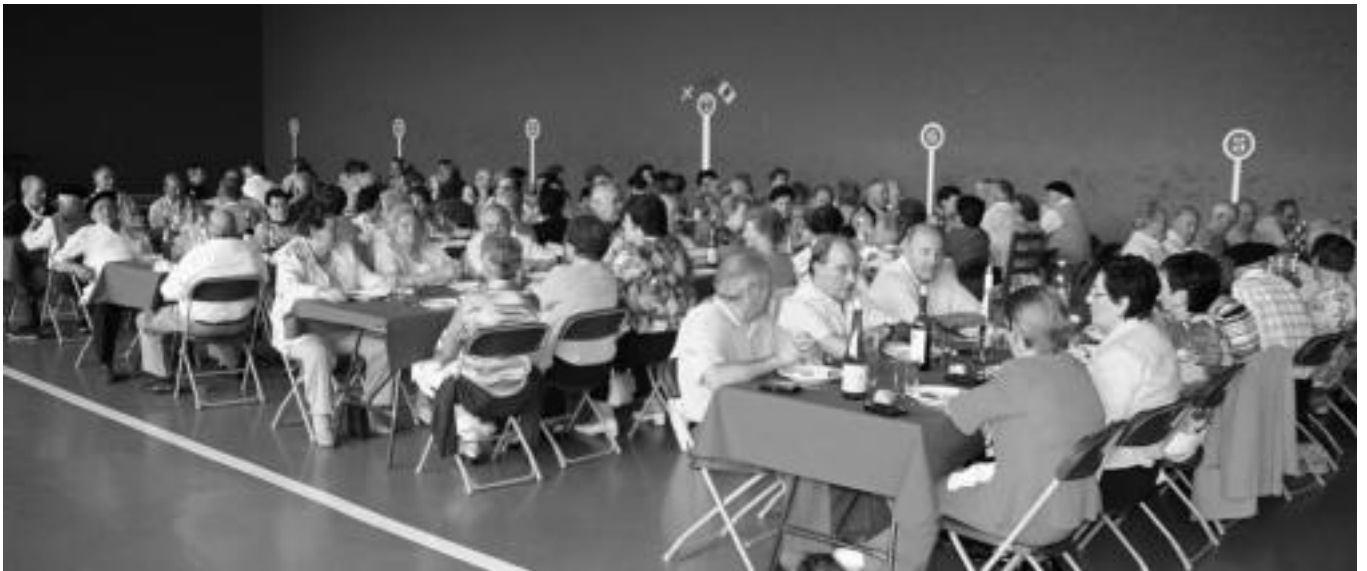
Asteasun atzo Jubilatueguna izan zuten atzokoan eta ehun bat lagun elkartu ziren frontoian egindako bazkarian. I. GARCIA