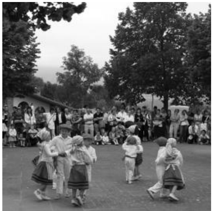
Leaburuko dantzari txikiak erakustaldia egin zuten herritarren aurrean. ANDER OTEZABAL