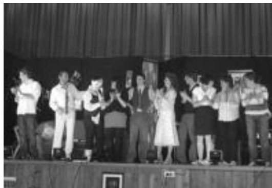
Ostiralean egin zuten emanaldia amaitu ondoren, aktore guztiak. N. GARZIA

Bitartean, txintxurri txapelketa egin zuten 20:00etatik aurrera. «Parte-hartzaile gutxi izan ziren, baina hauei begira, jende asko». 20:30ean zozketaren txanda iritsi zen. 8 sari zozketatzen zituzten eta sari guztiak atera ziren. Festa guerdian amaitu zen.