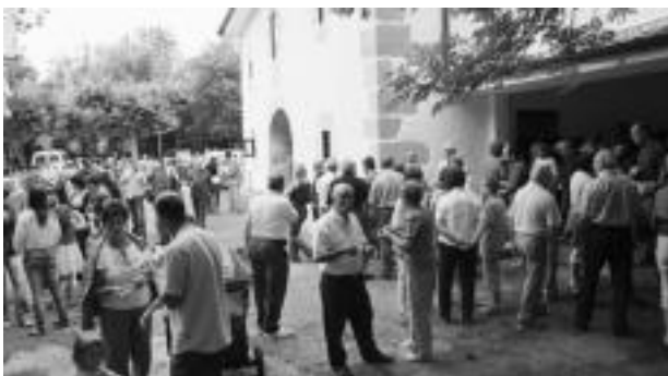
Hamaiketako hartu zuten meza nagusiaren ondoren. ANDER OTEZABAL