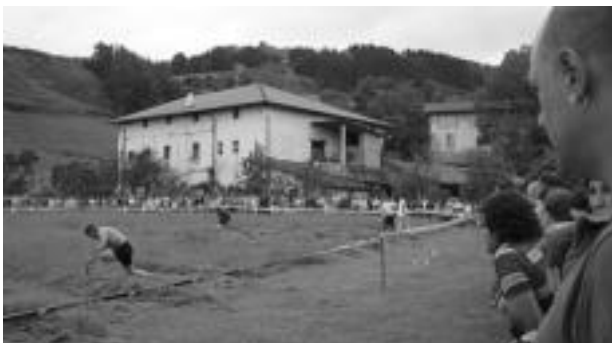
Asteasun herritarren arteko lehia jende ugari izan zen ikusle moduan. ANDER OTEZABAL