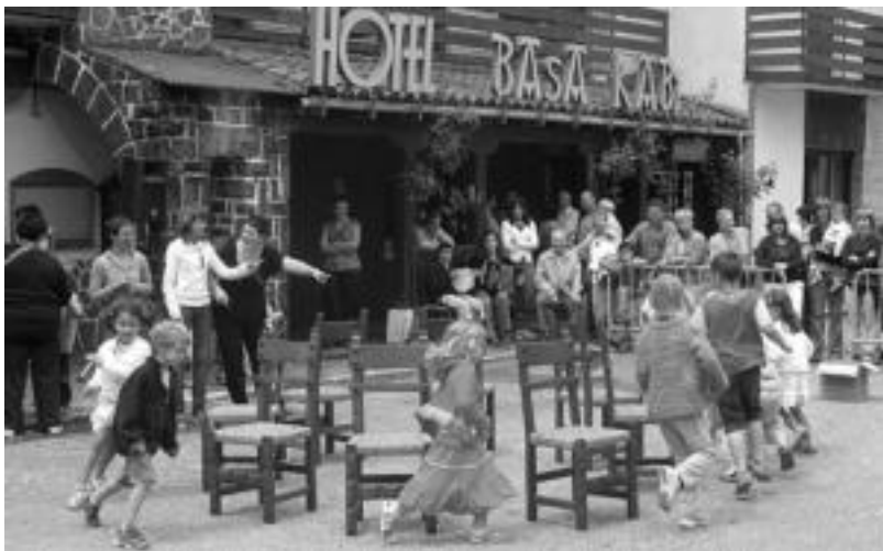
Goizean aizkolariak eta sokatira izan ziren eta ondoren umeak aulki-dantzan aritu ziren. N. GARZIA