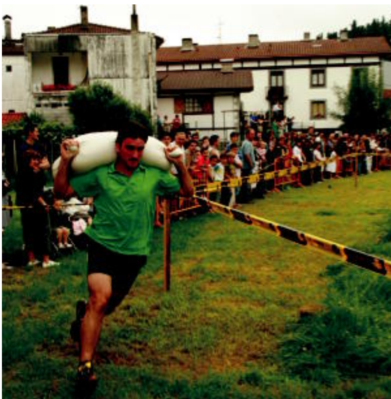
Herritarren arteko herri kirol lehia egin zuten Asteasun, San Pedro Egunean. ANDER OTEZABAL

KOKAPENA Tolosan izango du egoitza nagusia; Nafarroan ere izango luke kanpua; zehazteke daude titulazioak 3