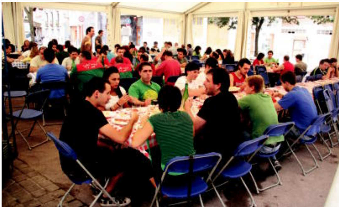
Asteasuko herriko plazan dagoen karpa erraldoian elkartu ziren koadrilak bazkaria egiteko. I. GARCIA

HITZAK ez du bere gain hartzen egunkariaren adierazitako esanen eta iritzien erantzunkizunik.