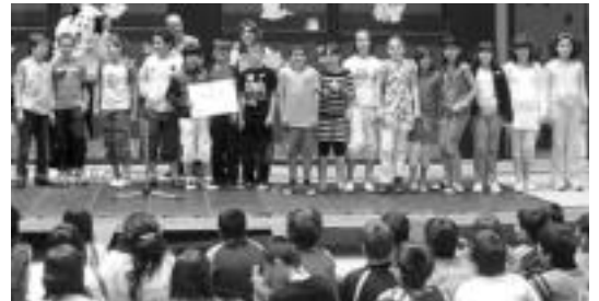
Lazkaoko Ikastolan jaso zuen Jesusen Bihotzakoek saria.

Osasunkume drogamenpekoen prebentziorako programa bat