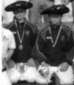
Erasun eta Labaka, txapelekin. HITZA

Villabona » Behar-Zanako alebin mailakoen urtea borobila izan da, hainbat txapelketa garrantzitsu irabazi baitituzte.