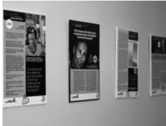
Pertsanaia ezagun askoren esanak biltzen dira Leidorreko erakusketan. E.E.