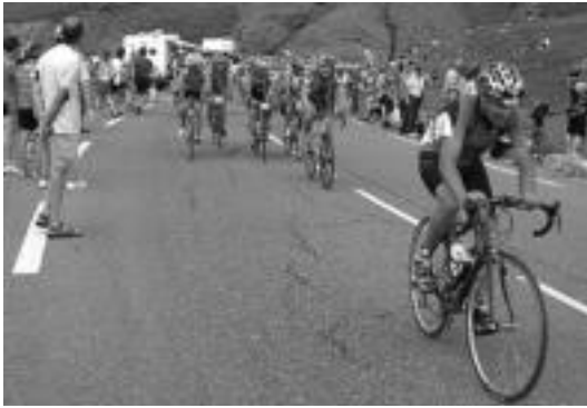
Pasa den larunbatean jokaturako probaren une bat. HITZA