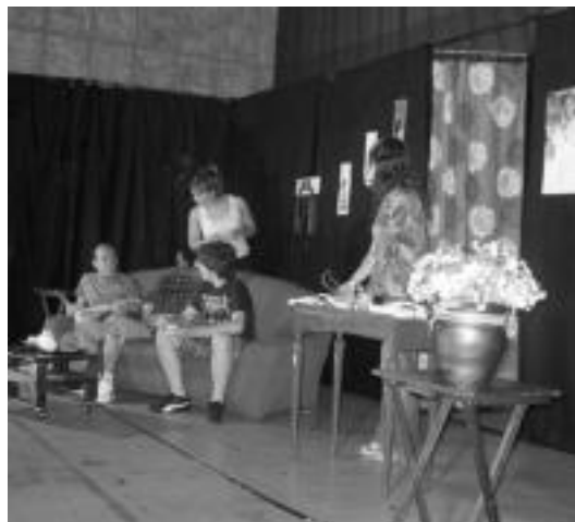
Txinparta taldekoak, azkeneko entsegua egiten. N. GARZIA

«Antzezlanarekin pixkanaka-pixkanaka gozatzen hasi ginen,