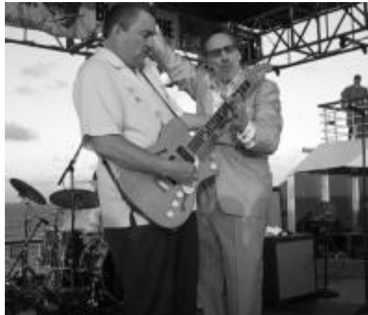
Little Charlie and the nightcats taldea izango da gaur Plaza Berrian. HITZA

Estatubatuarren emanaldia da jaialdi honetako emanaldi bere-