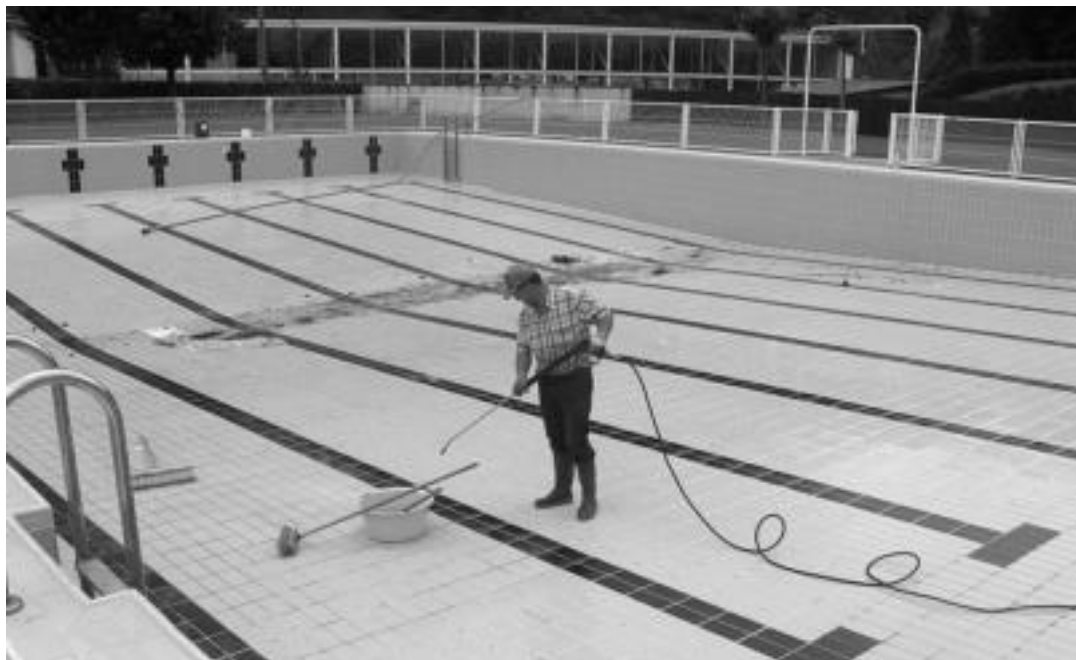
Langile bat igerilekuari azkeneko ukituak ematen, bihar ireki ahal izateko. N. GARZIA