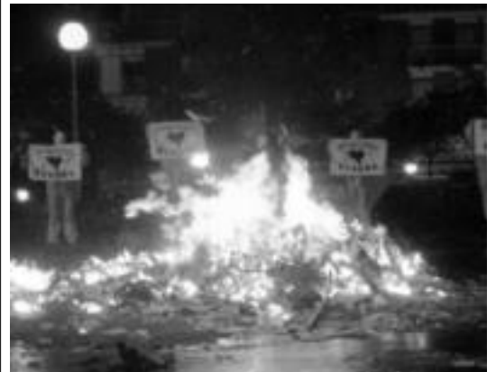
Solidarioek euskal preso eta iheslarien egoera salatu zuten Anoetan.