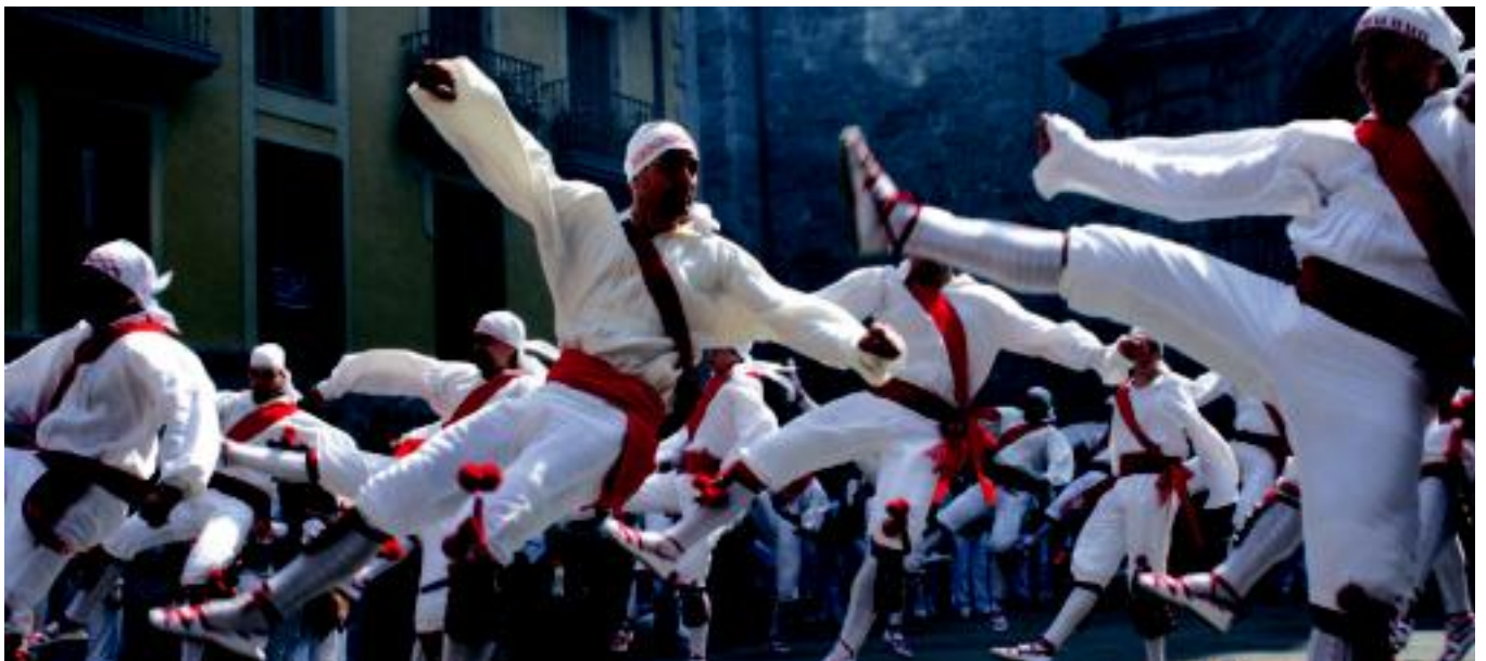
Eskopetariak tiro egin zuten; batelen finalean Izaskun AKE 66 tabernakoek irabazi zuten, nesketan; ohiturari jarraituz, bordon dantzariak Andre Mari plazan dantzatu zuten.