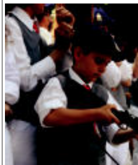
Adin gutrietako eskopetariak bildu ziren Triánguloan. N. LATABARU