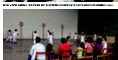
Belautntzan ere atzo izan zuten San Joan jaien azken eguna. L. CIZUA