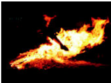
Santa Maria elizaren kanpoaldean San Joan Sua piztu zuten, Tolosan; herritar asko ausartu ziren salto egitera.