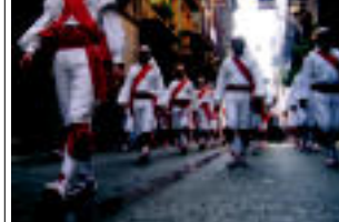
Dantzariak ere prozesioan joan ziren Aize Zaharretik. L. CIZUA