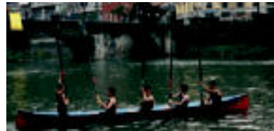
Mutletan, Bogak irabazi zuen batelaren finala, Oriá ibaian. N. LATABARU