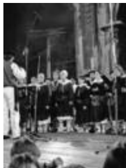
Leidor Opera, duela 10 urte. KUSK

Hamar urte bete dira Leidor opera lehen aldiz eman zenetik Tolosan. Emanaldia Leidor Abesbatzak bultzatu eta antolatu zuen.