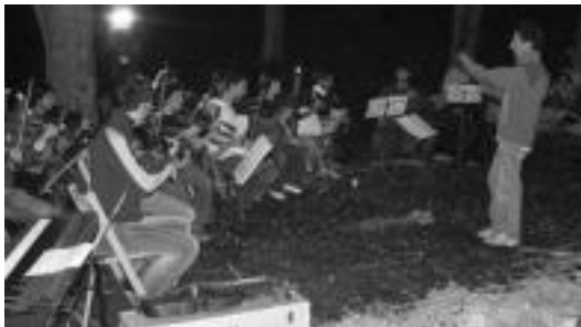
Et Incarnatus orkestra Urkizun kontzertua eskaintzen. J. SAIZAR

Et Incarnatus orkestrak udako solstizioa dela-eta bihar Urkizun, Mendikuteran magaleko belazean, Iraolako zuloa izeneko lekuan (telekomunikazio antenaren pean) IX. Solstizio Kontzertua eskainiko du, 12:30etik aurrera. Eguraldi txarra eginez gero, Urkizuko ermitan izango da saioa. Ohikoa den bezala emanaldiaren amaieran jatekoa eta edatekoa banatuko