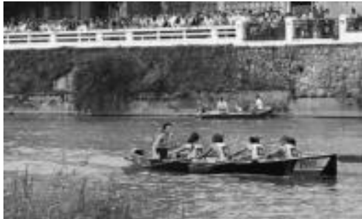
Batel estropaden une bat, pasa den urtean. I. AZPIKUIETA

Biharko saioari dagokionez, 12:00etan ekingo diote arraunlariak. Promozioko batelak lehiatuko dira lehendabizi, hau da, TAK (mutilak) eta Emendek AKE (mutilak) eta Emendek AKE (neskak). Bigarren txandan mutilak ariko dira: Ibarra, Zelai, Izaskun AKE eta Izaskun AKE (mistoa), hain zuzen. Hirugarrenean ere mutilak ariko dira nor baino nor: Anoetako