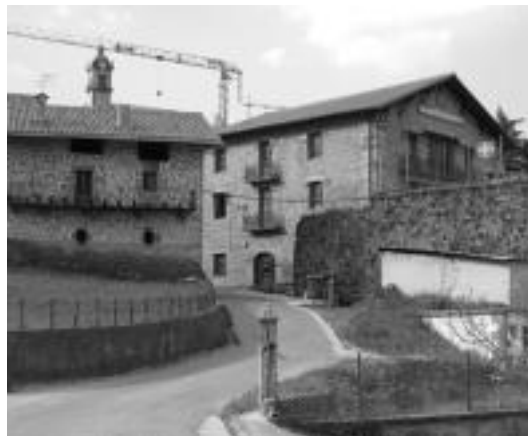
Udaletxean egindako osoko bilkura batean erabaki zuten eskaera egitea...A.

Bilera Azpeitian egin zen, Uema eguna ospatzen zen egun berean. «Bilera horretan Uemako ordezkariak zeuden, eta Uemako kide diren herrietako ordezkariak ere gonbidatuak zeuden, denak joan ez ziren arren. Uemaren funtzio-