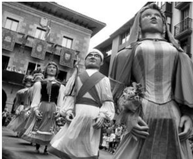
Hainbat denbora geldirik egon ostean, berriro ere Tolosako kaleak hartuko dituzte erraldoiek.