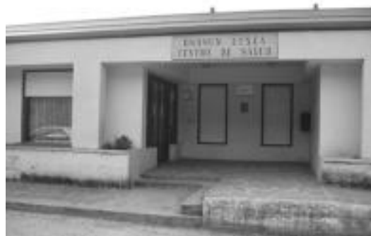
Leitza osasun etxeko sarrera. J. ASTIBIA

Ezkurdiak herrian pasatako 12 urteen balantzea egin du. «Gustura egondu naiz hemen urte hauetan, leku ezberdinetan ibili naiz eta aldatzeko aukerak ere izan ditut. Arazo serioerik ez dut izan. Gainera herri batean azkenean familia guztia ezagutzen duzu eta jendearekin harreman estuagoa sortzen da».