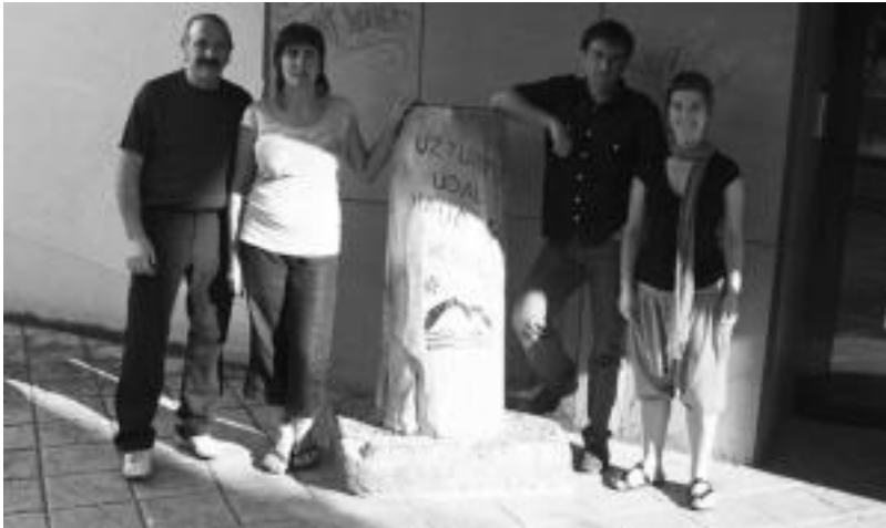
Ibarrako ezker abertzaleak prentsaurrekoa eskaini zuen atzo Haur Eskolaren aurrean. ASIER IMAZ