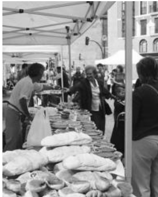
Zerkasian, San Frantziskon eta Trianguloan egongo dira postuak. N. LATABURU

Biharko azoka berezian elkartasunarentzat tartea ere izango da. Bertan, Hego Ameriketako bi herrialderi laguntzeko ekimenak