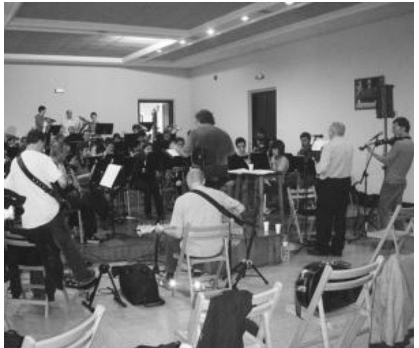
Tolosako Musika Banda eta Oskorri astearte honetako entseguan, Udala Musika Eskolan.

Gaur gauean Tolosako Euskal Herria plazara joaten direnek kontzertu aparta dastatzeko aukera izango dute, bi taldeen arteko uztarketa orijinal honen emaitza zuzen-zuzenean, eta behin bakarrik, entzuteko aukera.