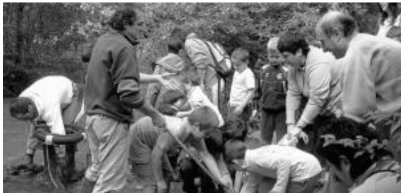
Araxes ibaian bertako ekosistemaz aritu ziren eta amuarrainak askatu zituzten bertan. HITZA