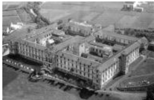
lurreamendi egoitza da liburuan agertzen den irudietako bat. HITZA

XIII. mendetik XX. mendera arteko irudiak bildu dituzten liburua honetan Recondok, eta irudi horien bidez, tuberkulosia Tolosan XIX. mende amaieratik XX.aren hasierara, XII. mendetik XVII. mende-