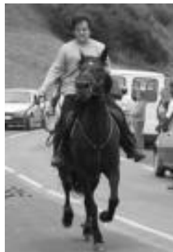
Zaldi karrerak 9 urte bete ditu. M.J.

Ondoren, zaldian ibiltzeko aukera izango da Abaltzisketa inguruan. Aurten, zaldiak izango dira eta nahi duenak igo eta paseo laburrak egin ahal izango ditu, beti ere baten baten gidaritzapean.