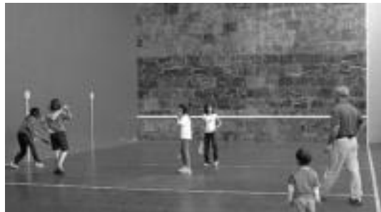
Frontoian pilota partidak izan ziren. HITZA

urte bitartekora bildu ziren eta eguerdira arte aritu ziren, bai neskek eta bai mutilak ere. Batzuk palaraz aritu ziren, eta besteak, eskuz.