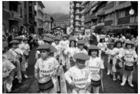
San Bartolome jaietan haur danborrada egiteko deialdia egin dute. HITZA

Iskanbilak duela bi aste lehertu ziren, nahiz eta urtetako eskaerak izan Sidi Ifniko hiritarrenak. Duela bi aste 80 bat lagunek arraina gerraizatzen zuten kamioiei portutik ez zien irteren utzi, protesta moduan. Gobernuak erantzun bezala 12.000 polizia bidali zituen.