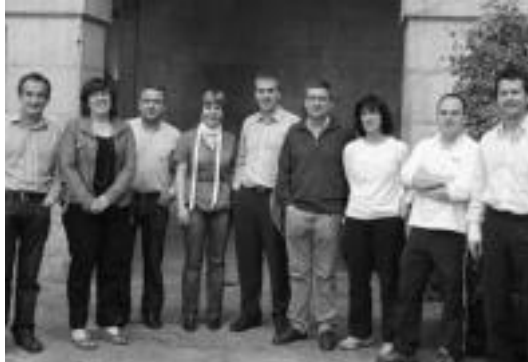
EAJren Udal ordezkariak azken urtearen balantzea egin dute.

Tolosa » Urtebete igaro da legealdia hasi zenetik, eta EAJ alderdiko Udal ordezkariak beraien proiektuetan mintzatu dira.