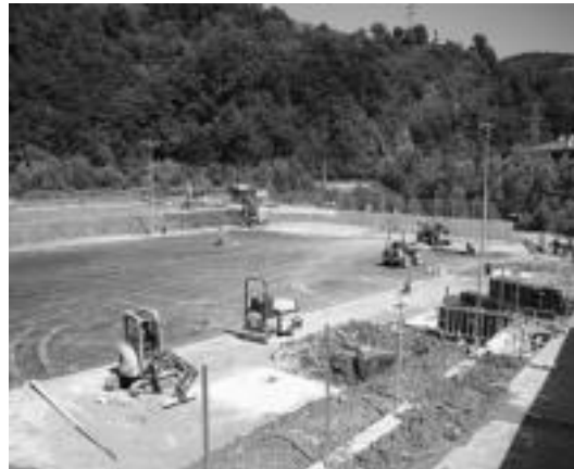
Solarium berria bi aste barru egongo da erabigarri. I.T.

Solarium berriarekin batera, Usabalera sartzeko beste sarrera ere erantsiko dute. Hala, zuzenean