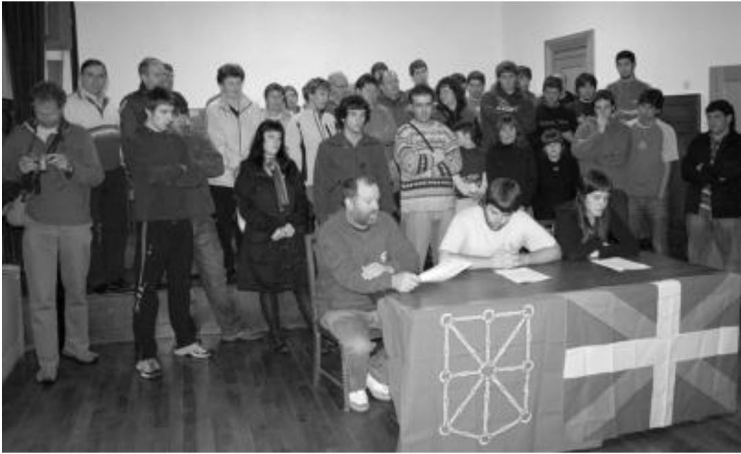
Joan den astean egin zuten prentsaurrekoa, «Guardia Zibilaren jokaera salatzeako asmoz». HITZA