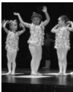
Dantza tailerrekoen saio bat. I.T.

Parte-hartzaileei dagokionez, kultur tailerretako baleta eta dantza garaikideko 150 ikasle taula gainean ikusteko aukera izango da.