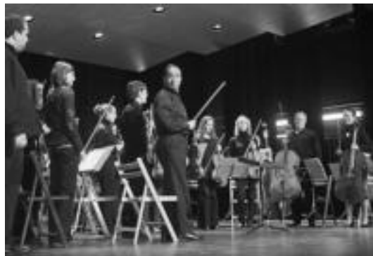
Arimaz Orkestrakoak Leidorren, Santa Zeziliako kontzertuan. A. OTEZABAL

Musika » Irungo Musika Eskolako Soka Orkestrarekin batera ariko da; emanaldia 20:30ean hasiko da.