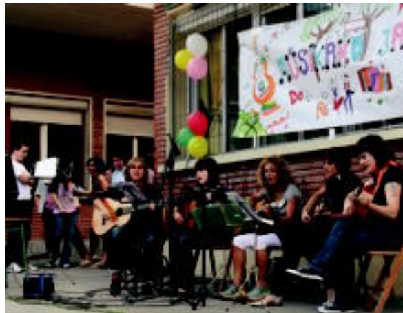
Gitarrekin batera abestu ere egin zuten ikasleek. Jende asko hurbildu zen eskolako jolastokira, musika entzutera. N. URBIZU

HITZAK ez du bere gain hartzen egunkariaren adierazitako esanen eta iritzien erantzunik.