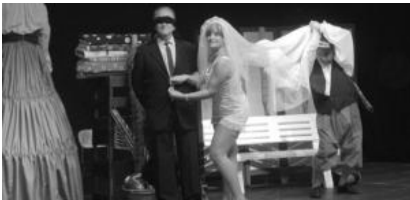
Gezurra gezurraren gainean obraren une bat. HITZA