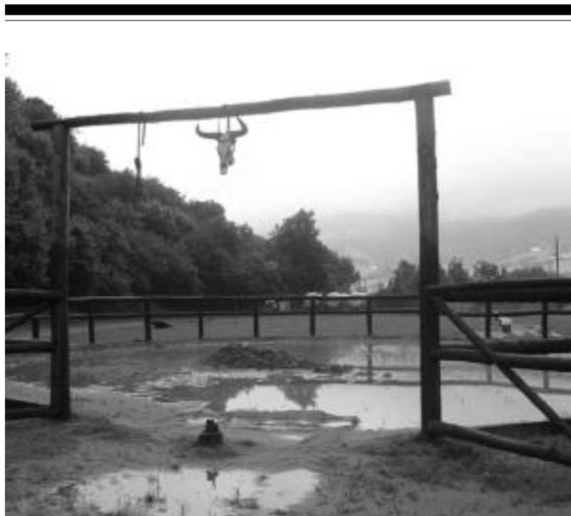
Asteazkeneko euri jasak eta gero, Inguruarte erabat lokaztuta gelditu da eta pikaderoa, urak hartuta.