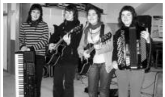
Euskal Herriko kantu txapelketaren finalean egongo diren ordezkariak. HITZA

baina hauekin batera, Ibarriko Udala, Ibarriko Kutxa, Ibarriko Euskadiko Kutxa, Insalus, Tolosako Eroski, Viña La Guardia eta Opil Okindegia ere aipatu dituzte, «nor bait aipatzea ahaztu bazaigu, barkamenak» eskatuz.