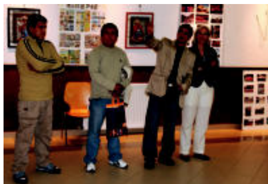
'Erakusketan Andinoa'-ren inaugurazioa, atzo, Atxulondo kultur etxean.

LEITZA Larunbat gauean jokatu zen finalen, 2 minutu eta 14 segundo atera zizkion Mugertzari 7