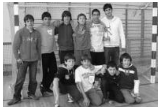
Erniobearen Institutuko infantil mailako taldea.