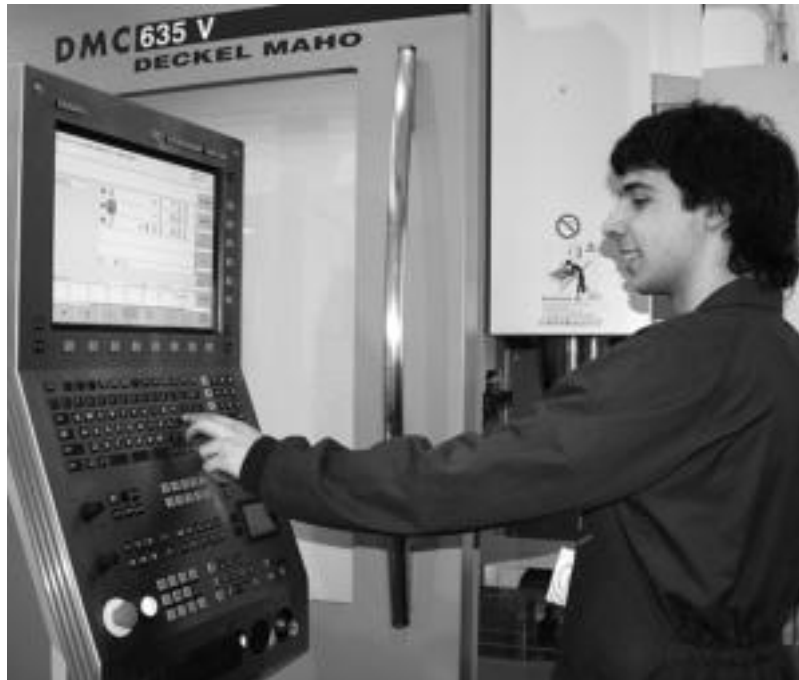
Goi mailako mekanikako zikloa egin ahal izango dute Ikasi eta lan programan parte hartzen dutenek. ESTI EZEIZA

goko titulua daukan edonork egin dezake. Hala, Arregiren ustetan, egokia izango litzateke, «goi mailako zenbait ikasketak duela urte batzuk egin, eta lanik aurkitu ez duten horientzab».