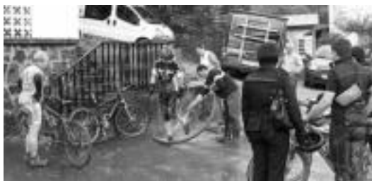
35 txirrindulariek bizikleta garbitu ahal izan zuten han bertan. ARTUBI ELKARTEA

Ehun mendizaletik gora abiatu ziren, ondo ekipaturik, «aterki eta guzti, nahiz eta ondoren erabili ez». Ibilbidea «gogorra» izan zen hasiera, aurreko egun eta asteetako curiak sorturiko lokatz pila baitzegoen, «baina gogotsu egin zuten» Artubiko elkarteok markaturiko bidea. Lehenengoak 12:15ak aldera iritsi ziren Artubira, baina gehienak, espero bezala, 14:30ean hasi ziren iristen. Azkenak 15:30a kaldera iritsi ziren.