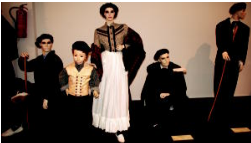
Baserritar jantzien erakusketan dago ikusgai Gurea aretoaren erakusgelan. I. GARCIA