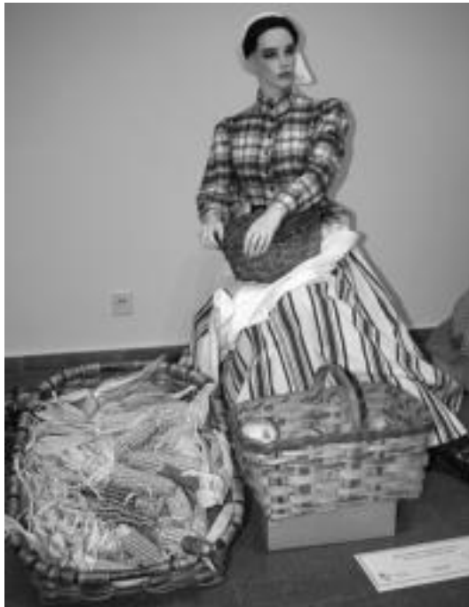
Baserritar jantzien erakusketan ikusgai dagoen adibideetako bat. I. GARCIA

Etzi hitzaldia antolatu dute, Gurea aretoan eta 20:00etan. Ramon Garcia baserritar jantziei buruz