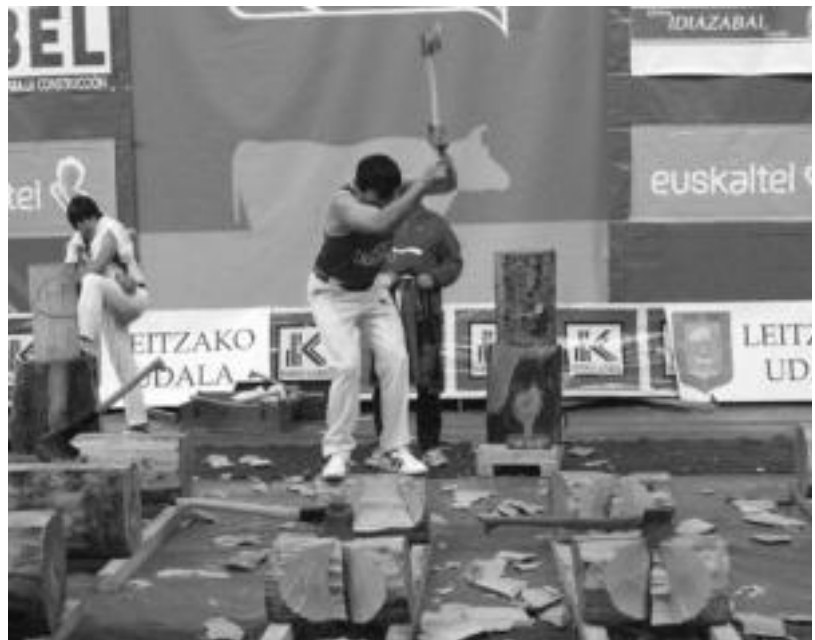
Jon Rekondo Leitzaoko Amazabal Pilotalekuan egindako kanporaketan. N. GARZIA