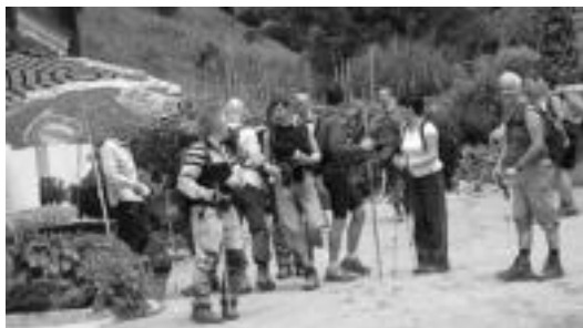
Oinezkoak, azken anoagunean atsedean pixka bat hartzen. ARTUBI ELKARTEA