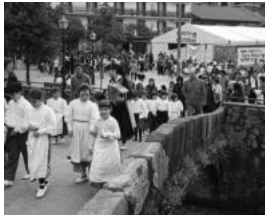
Dantza eta Mutxikoaren Eguna antolatu zuen Alurr-ek. ASIER IMAZ

Ibarra » Alurr dantza taldeak Dantza eta Mutxikoaren Egunaren inguruko balorazio «oso positiboa» egin du.