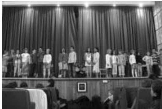
Haur hezkuntzakoak Lehoi baten bila noa abesten. N. GARZIA