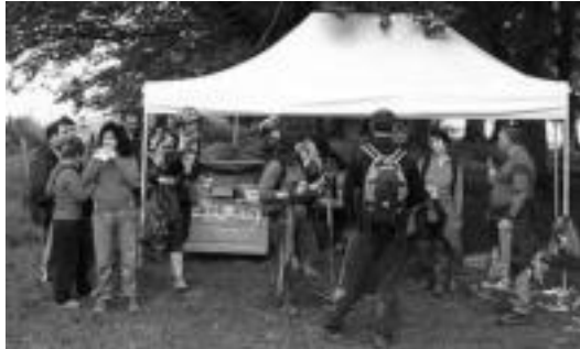
Oinezkoak indarrak hartzen Zarateen. ARTUBI ELKARTEA

07:00etan biltzen hasi ziren mendizaleak Bedaio pilotalekuan: antolatzaileek «eguraldia ez zela lagun izan» adierazi dute, «baina animatu egin zen jendea». Zaparrada bortitzek eta lainoak egun zatarra izango zenaren itxura ematen zuten, baina ez zen horrela gertatu. «Mendizaleek hasierako pausoak eman ahala, zerua lainoz garbitzen hasi zen eta curia egiteari utzi zion».