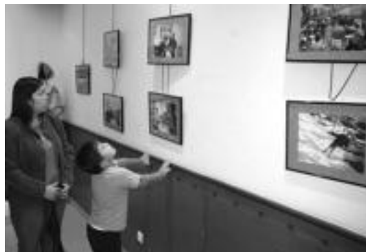
Erakusketaren inaugurazioaren une bat, atzo Atxulondon. I. GARCIA

Bilera honetan, alkateak bi herralde arteko kultur trukaketa egitearen eskaintza adierazi zien, batetik ekuadortarrek herriko eki-