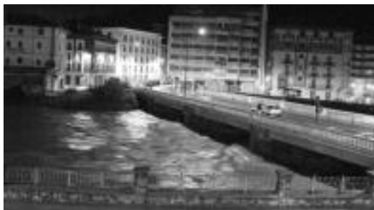
Larramendiko zubia Tolosan, irakurle batek larunbata eta igandea bitarteko gauean, 04:00etan ateratako argazkia.