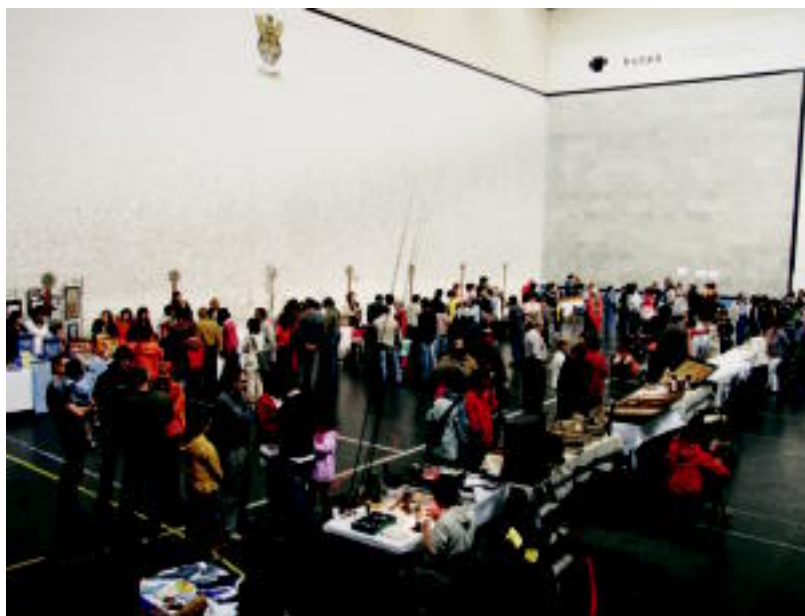
Eguraldi txarra zela-eta herriko frontoian atondu zuten azoka; jende mordoak hurbildu zen postuak ikustera. P. RENOBALES