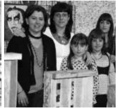
Alegiako ez zen bakarra zintzarrigilea zen, Amezketakoa. Eskulanetako ikasleek ere postua jarri zuten. P. RENOBALÉS