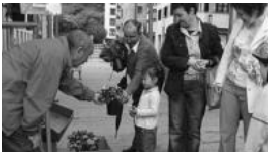
Loreak banatu zituzten jendearen artean balkoiak apaintzeko. ESTI EZEIZA