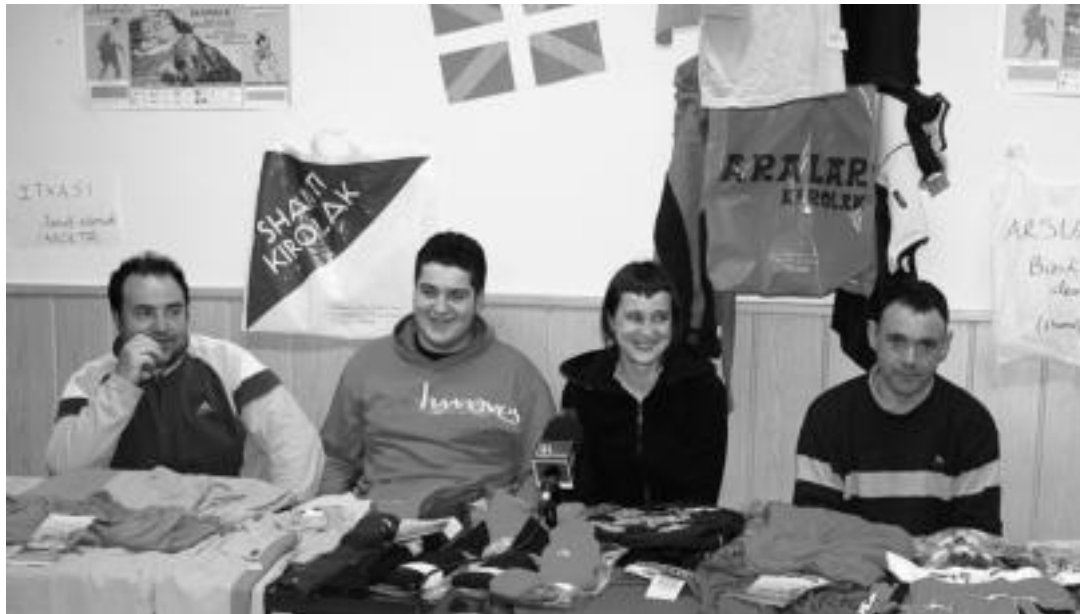
Larunbatean eskaini zuten prentsurrekoa Artubi elkarteak: Kultur Asteburuko ekitaldi garrantzitsuenak zaldi raidari buruzkoa eta igandeko martxa dira. A.I.