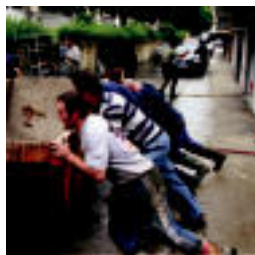
Villabonako bizilagunak lanean. I.G.

TOLOSALDEA Villabonan izan dira kalte gehienak; Iruran ere autoak garajeetatik atera zituzten 3