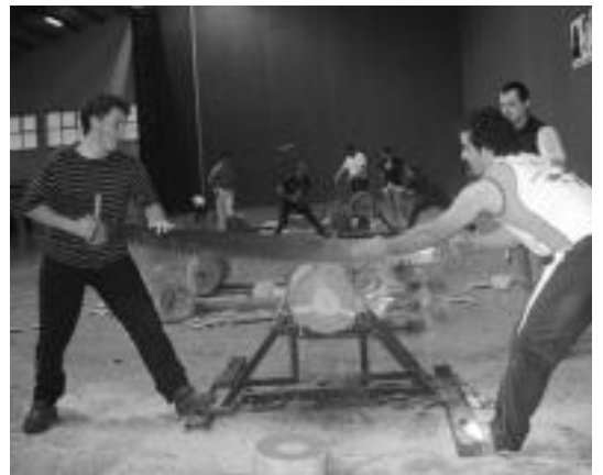
Herri kiroletan lizartzarrak nagusitu zitzaizkien gazteluarrei. HITZA