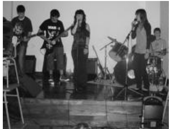
Villabonako Lain musika taldearen emanaldia. HITZA