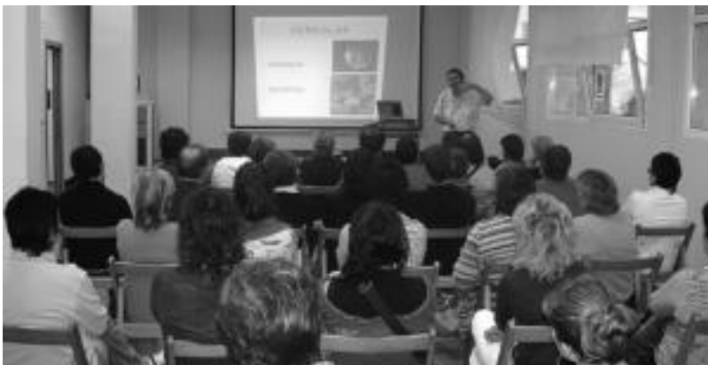
Nutrizioaren inguruan egindako hitzaldia Gunea Aretoan. HITZA