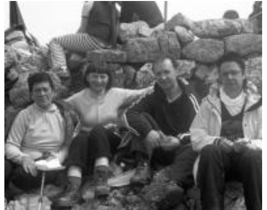
Eguraldia lagun ez izan arren, mendi irteera egin zuten. HITZA