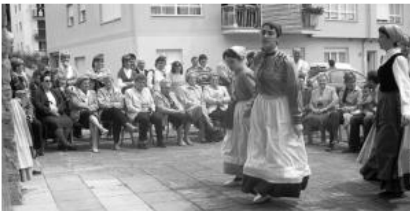
Herriko jubilatua Otsolar dantza taldearen emanalida ikusten Helduen Egunean. HITZA