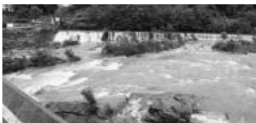
Anoeta eta Irura arteko zubian Oria ibaia atzo arratsaldean.

sua eman zuten autoak ateratzeko, baina azkenean ibaiak ez zuen gainezka egin. Ibaiondo industrialdean, behe batean auto bat zegoen eta urak guztiz estali zuen. Bestalde,