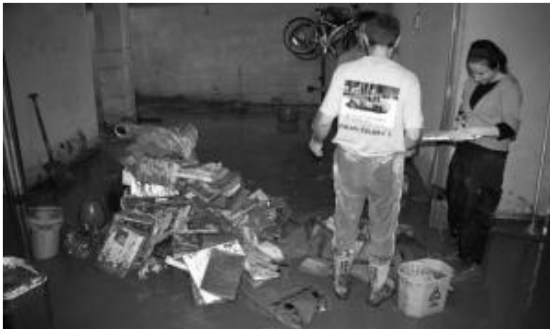
Villabonako Kale Berriko 5. zenbakiko garajeetan garbiketa lanak egiten atzo arratsaldean.