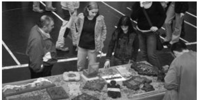
Egur taila, eta jendea bertan ikusten. Frontoian 20 postutik gora elkartu ziren eta gehienak alegiarrak ziren. P. RENOBALÉS