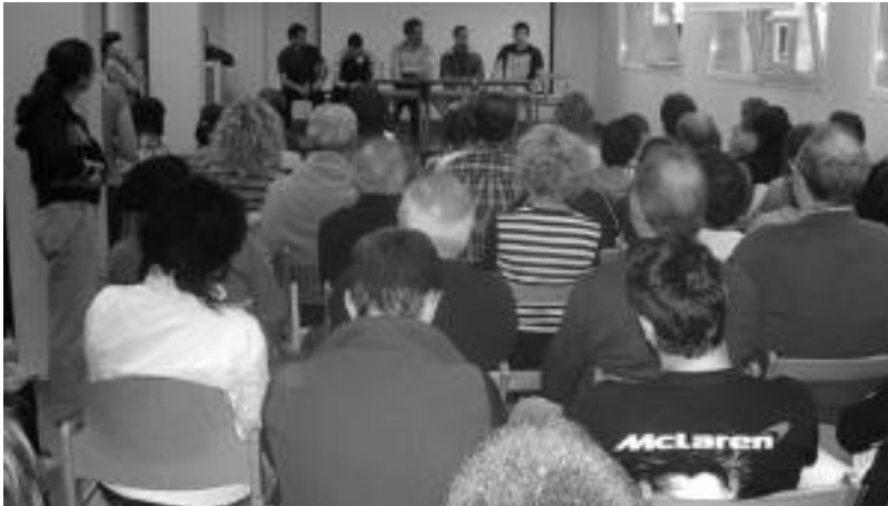
Lazkano, Olaetxea, Barriola, Bengoetxea eta Elorzak emandako pilotaren inguruko hitzaldi jendetsua. HITZA