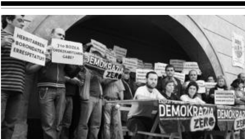
Ibarrako ezker abertzaleak prentsurrekoak eskaini zuen atzo «urtebetez... demokrazia zero!» salatzeo. ASIER IMAZ