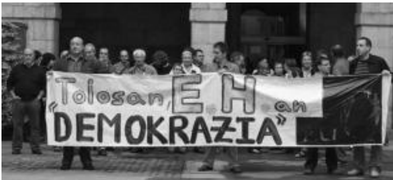
Lizartza eta Tolosan ere elkarretaratzeak egin ziren «Demokrazia zero!» salatzeo. Irudian Tolosakoa. A. IMAZ

«Demokrazia zero egunero eta gai txikienean» ere nabaritzen dela argitu nahi izan zuten prentsurrean; «Udal langileekin izandako gatazka, Txontxo eta ondoko etxe babestuak botatzeko erabakia eta modua, haur eskolaz hartutako erabakia, ...». Ezker abertzaleak bere aldetik «Ibarra egunegun ezkerretik egiteko ahalginearainaraituko» duela esan zuen.