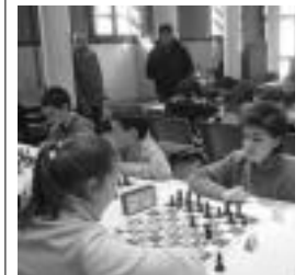
Eskualdeko xake jokalariek. HITZA

Bestalde, datorren larunbatean, hilaren 31ean, Tolosako xake azkarreko txapelketa jokatuko da Berdura Plazan. Banaka izango da, bost minutuko partidetak. Txapelketa arratsaldeko laurretan hasiko da eta eskualdeko edonork parte har dezake. Jokatu nahi duenak nahikoa du bertara hurbiltzea hasiera ordua baino minutu batzuk lehenago.