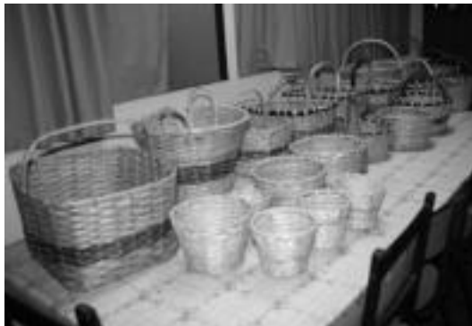
Saskigilea ez da faltako herriko plazan igandean.