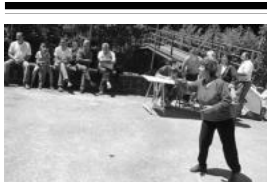
Aurten ere Toka Txapelketa egongo da Txaramako jaietan. JAIONE ASTIBIA

■ Etxea. Etxebizitza salgai Tolosako alde zaharrean. Merkea. Obra egin behar da. Interesatuak deitu: 657 23 0011/634 9194 82.