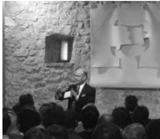
Jeremy Rifkin, herenegun, Txillida Lekun hitzaldia ematen.

Rifkinen energia mota baten, petrolioaren gainbeheran gaudela esan zuen, izan ere, «petrolio gehiegi erabili dugu». «Energia gehiegi erabiltzearen ondorioz klima aldaketa bezalako eraginak sortu ditu gizakiak, eta kontsumoa murriztea litzateke jarraitu beha-